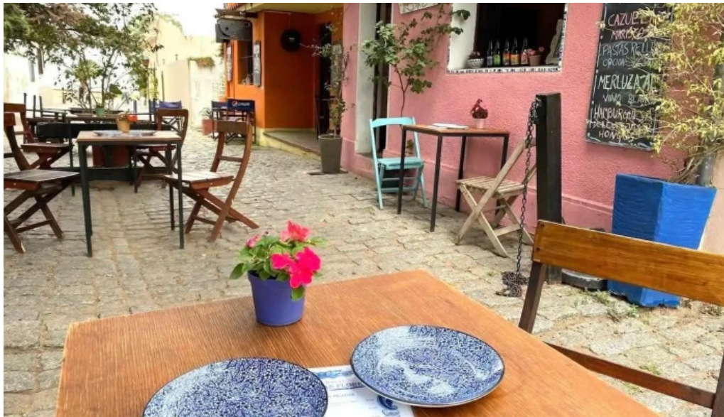
Restaurante pasaje las flores ambiente