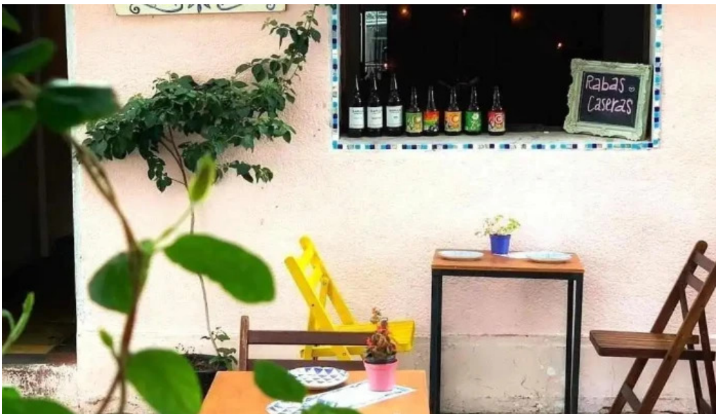
Restaurante pasaje las flores col del sacramento