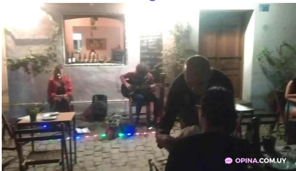
Restaurante pasaje las flores videos