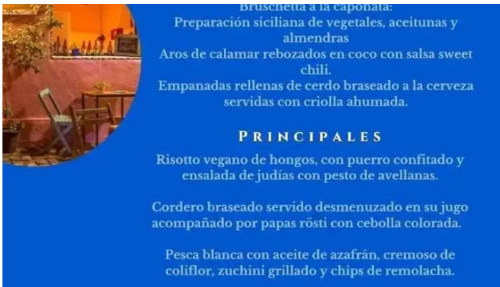
Restaurante pasaje las flores menu