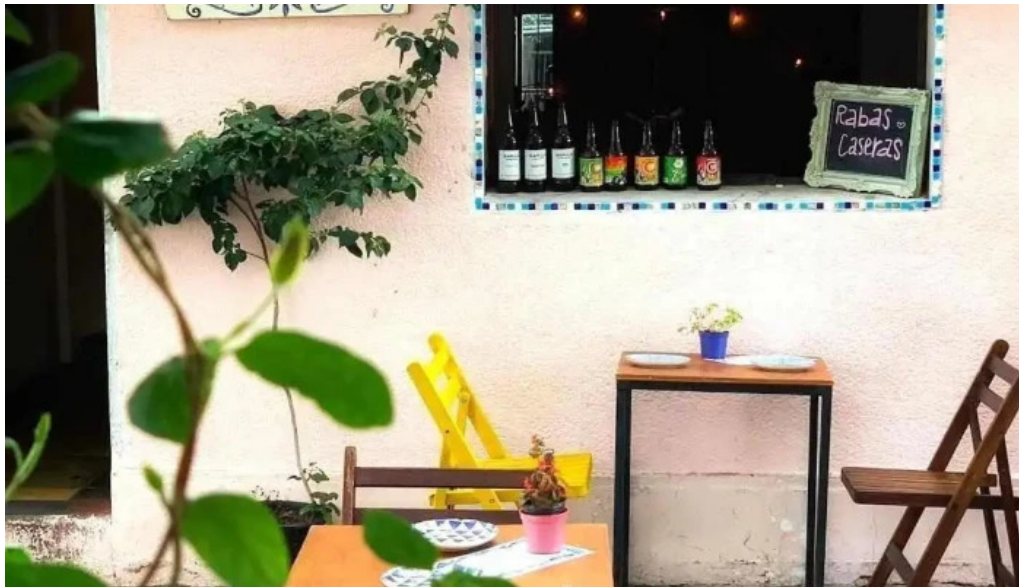
Restaurante pasaje las flores todas