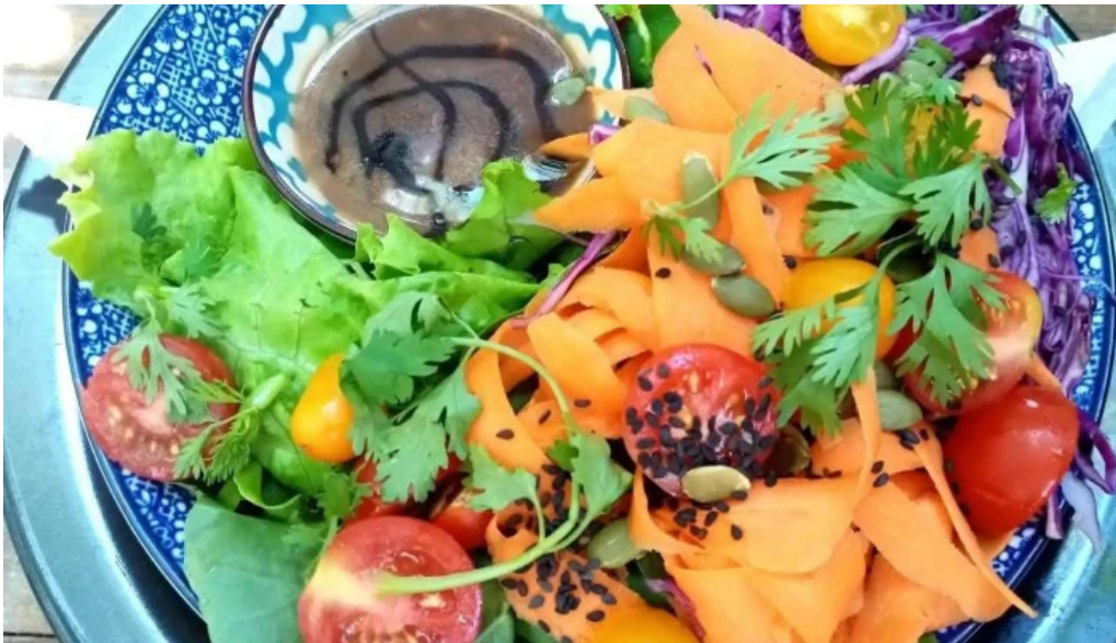
Restaurante pasaje las flores comida y bebida