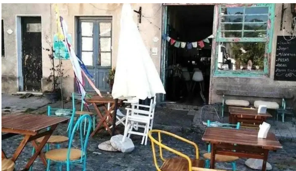
Muelle sur ambiente