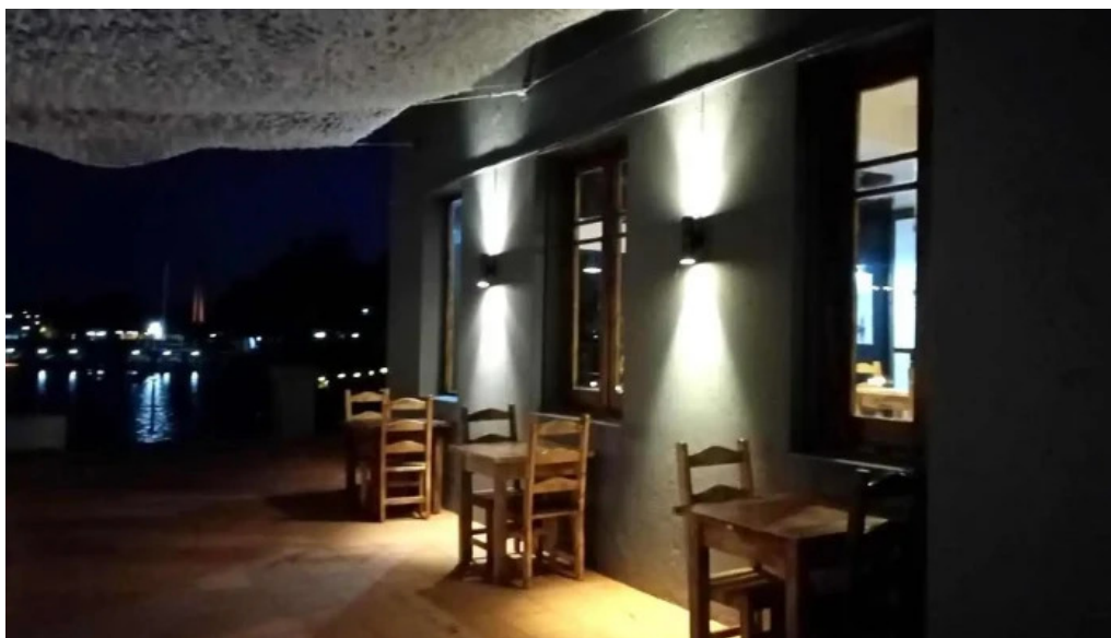
Muelle sur col del sacramento