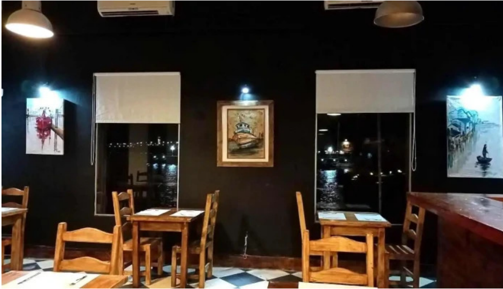
Muelle sur del propietario