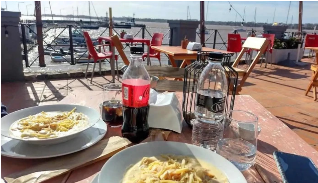
Muelle sur comida y bebida