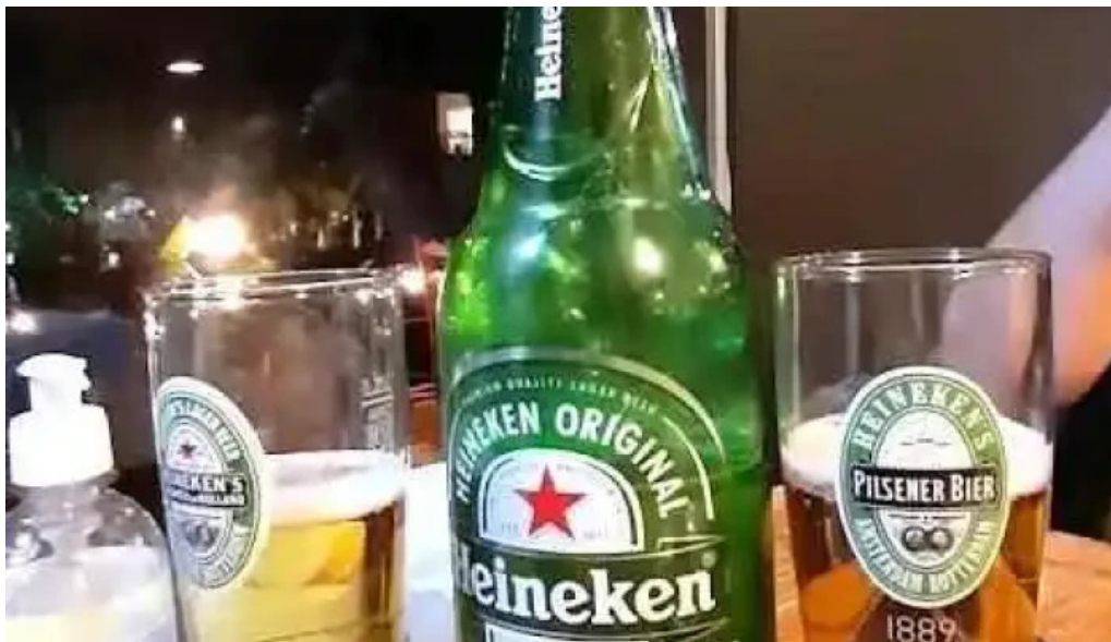
Muelle sur heineken