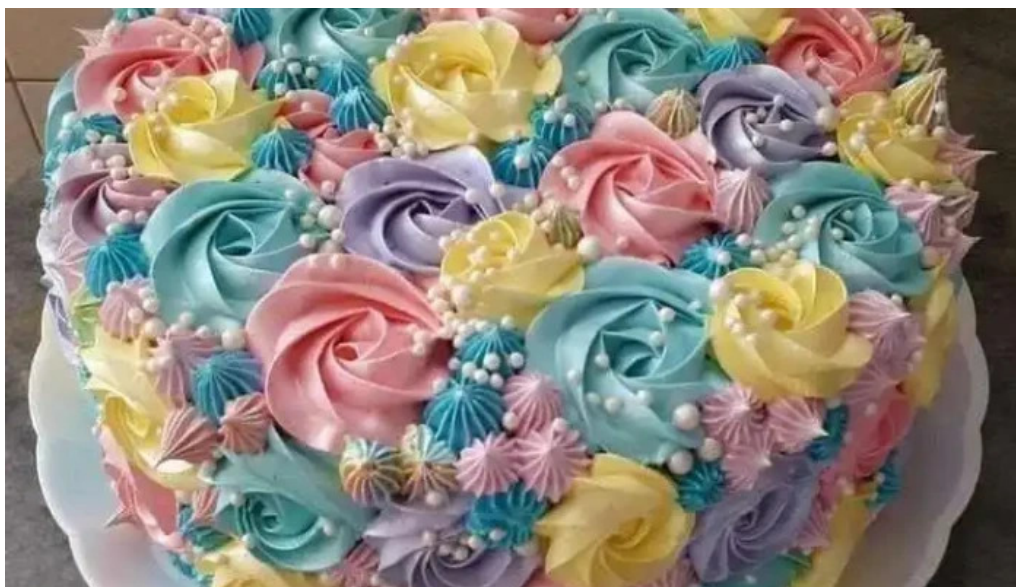
Los corales col del sacramento