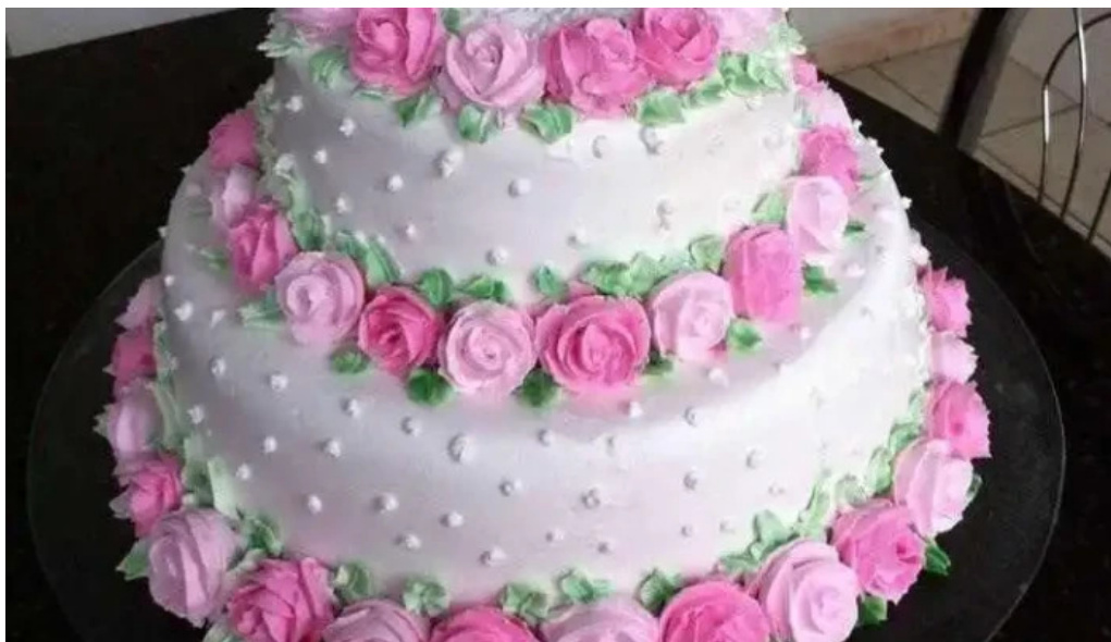
Los corales comida y bebida