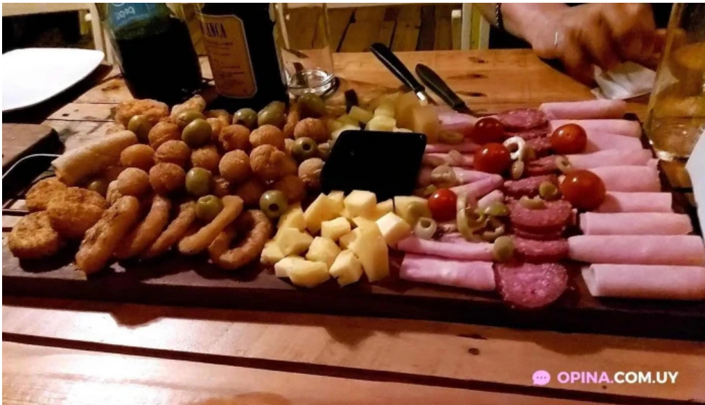
La taberna rock comida y bebida