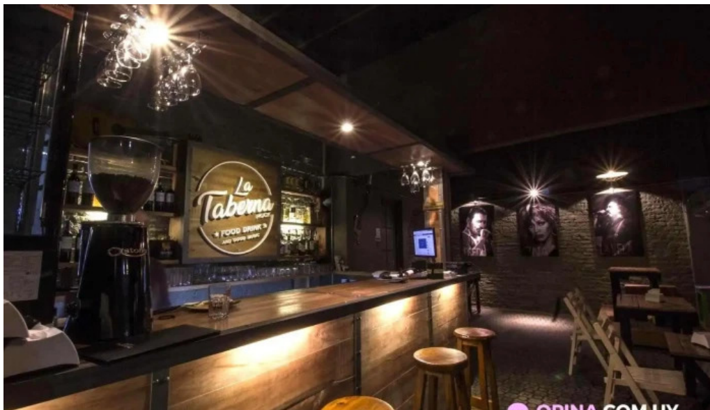
La taberna rock ambiente