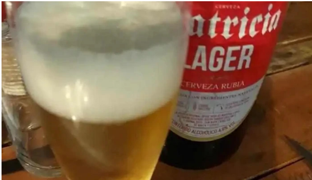
La taberna rock cerveza