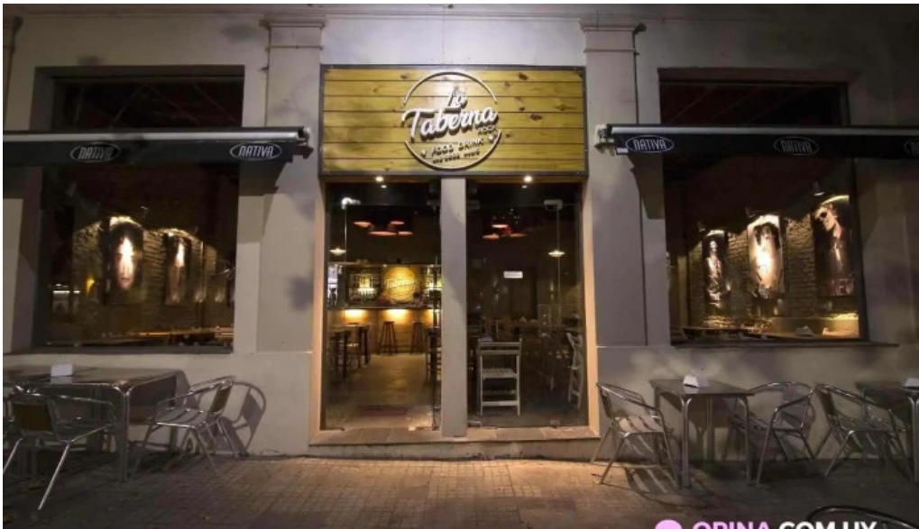
La taberna rock del propietario