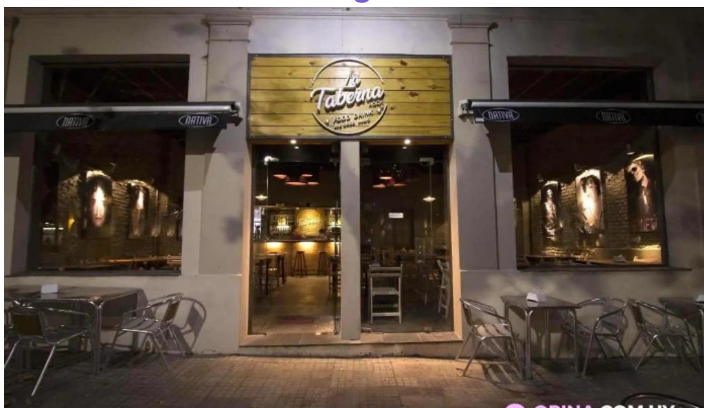
La taberna rock todas