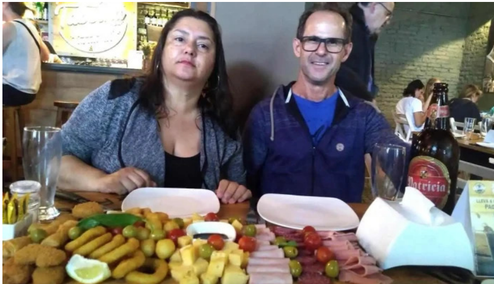
La taberna rock picada