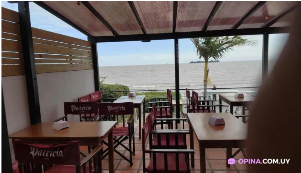
La bodeguita ambiente