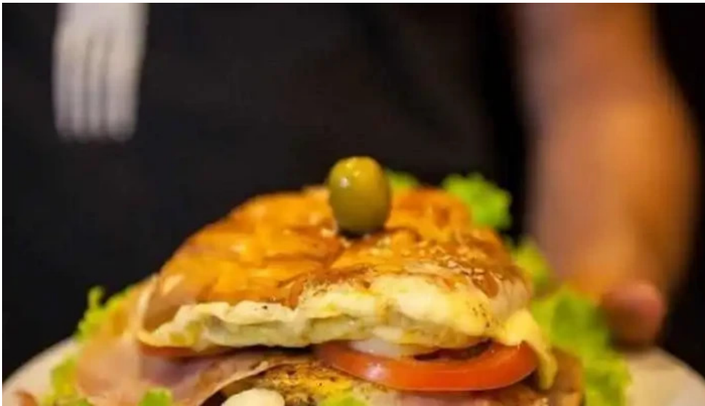
La bodeguita del propietario