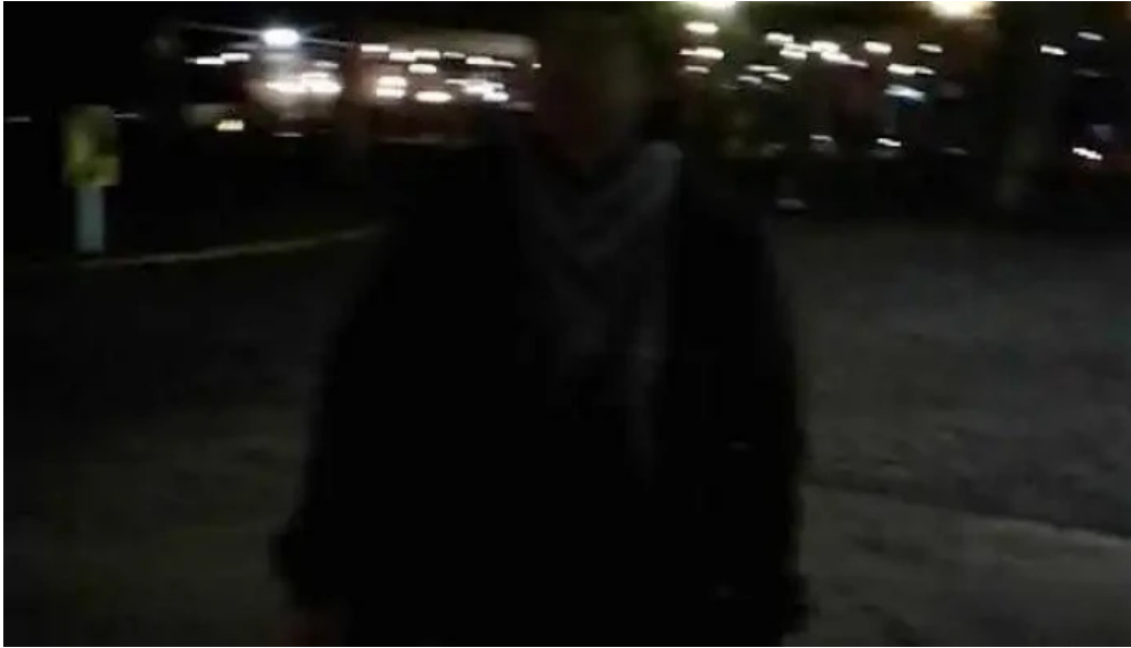
La bodeguita videos