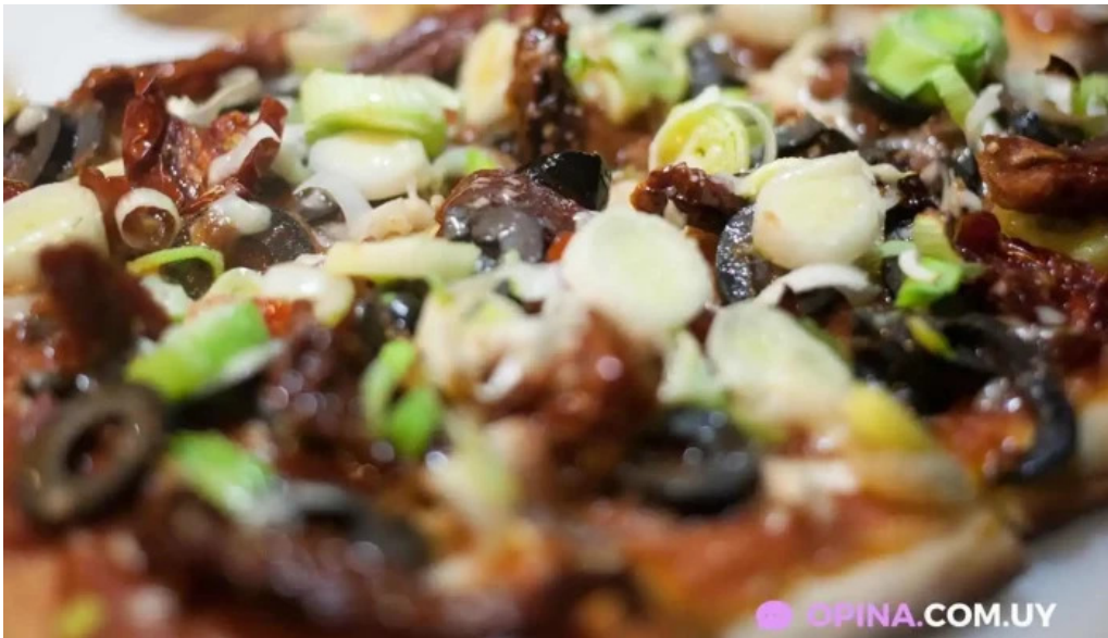
La bodeguita comida y bebida