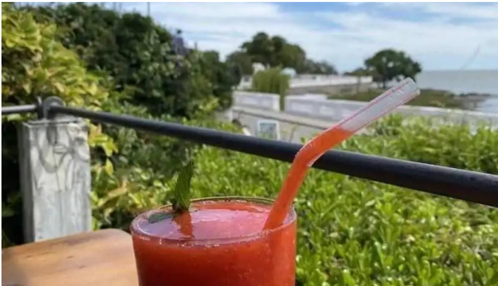
La bodeguita jugo