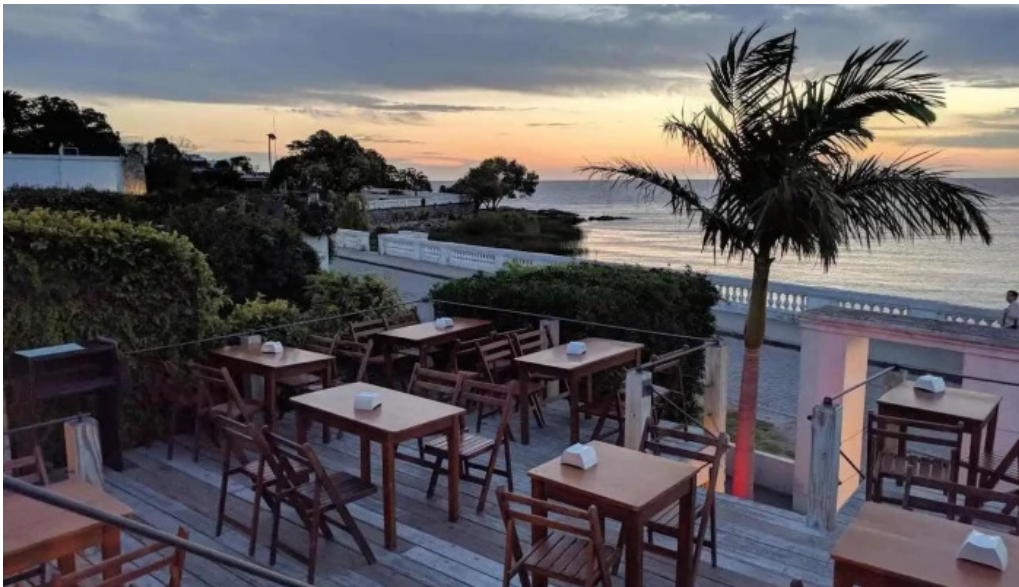
La bodeguita col del sacramento