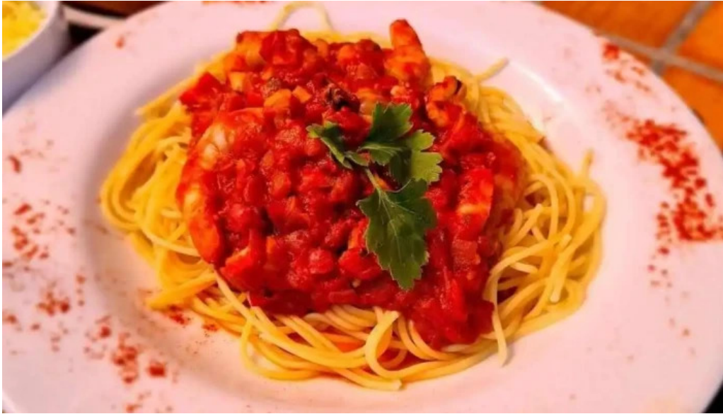
La bodeguita espagueti