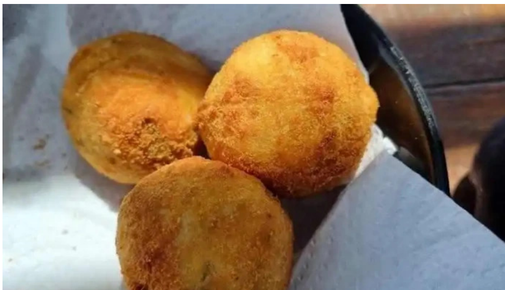
Cocina de la barra laguna de rocha arancini