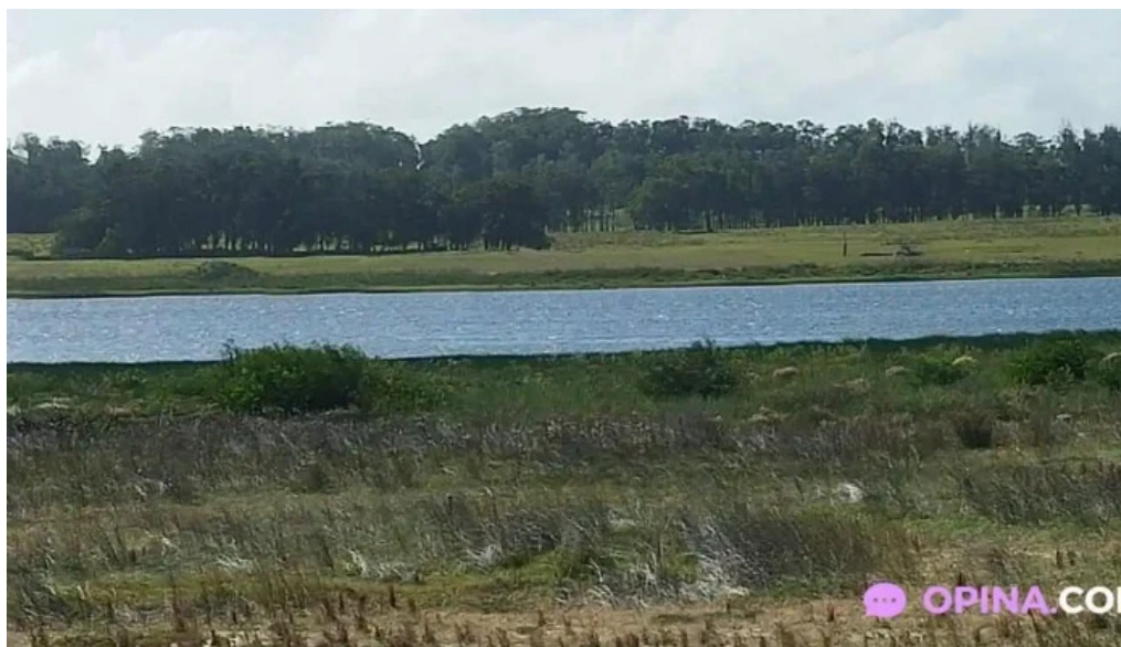
Cocina de la barra laguna de rocha mas recientes