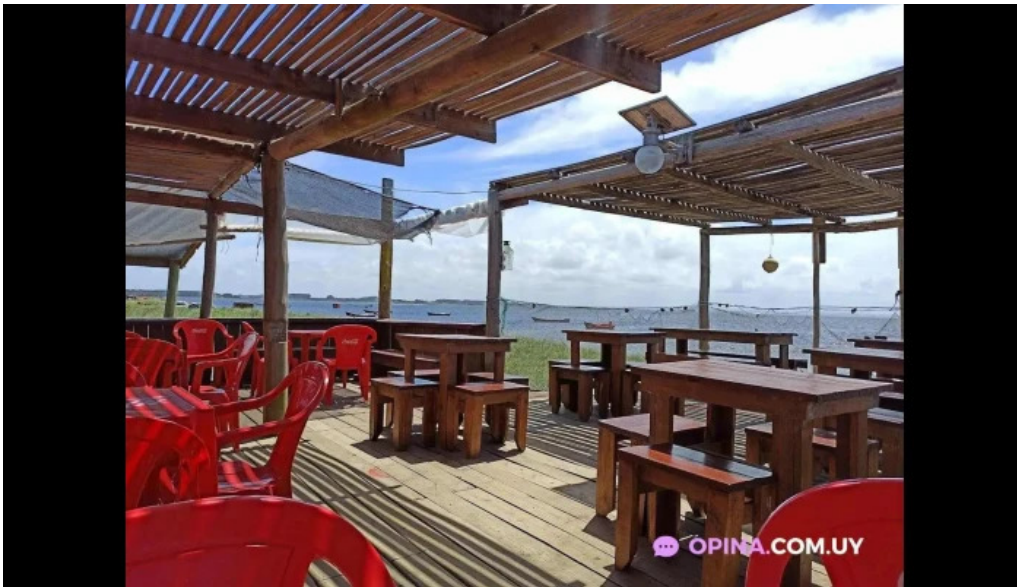
Cocina de la barra laguna de rocha rincon de la laguna