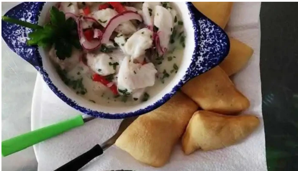
Cocina de la barra laguna de rocha ceviche