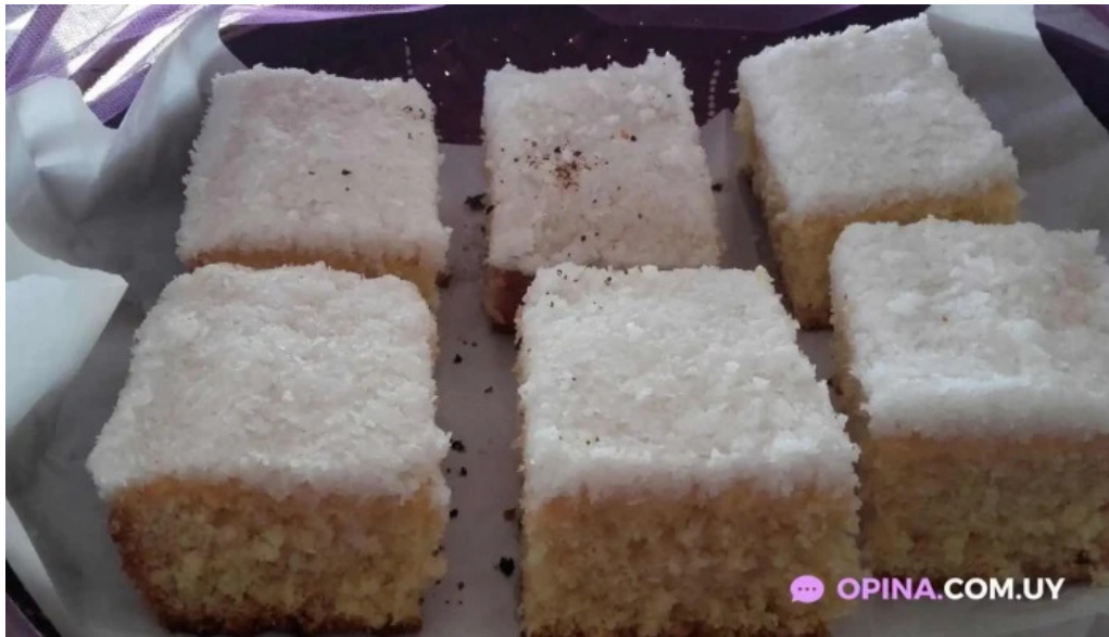
Cocina de la barra laguna de rocha comida y bebida