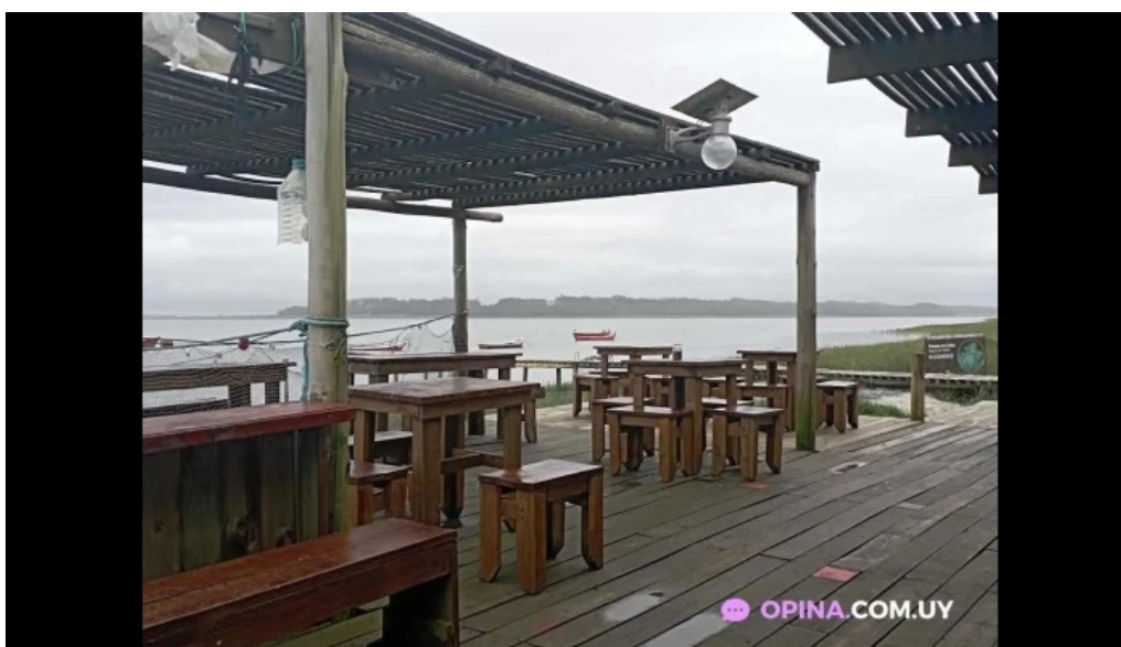
Cocina de la barra laguna de rocha ambiente