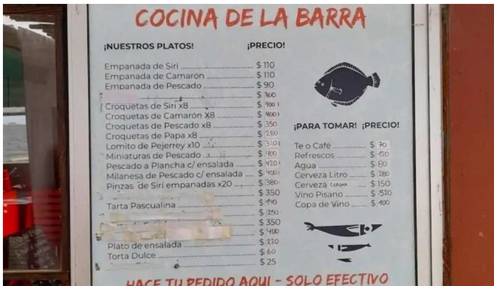
Cocina de la barra laguna de rocha menu