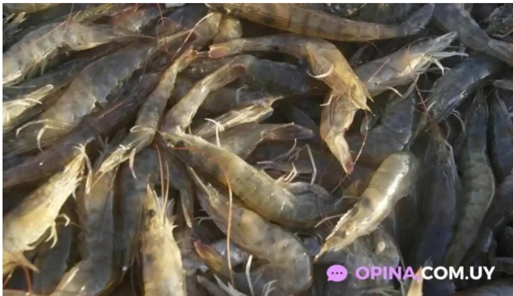
Cocina de la barra laguna de rocha del propietario