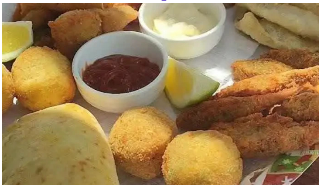
Cocina de la barra laguna de rocha videos