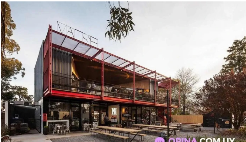
Sushi app parque miramar del propietario