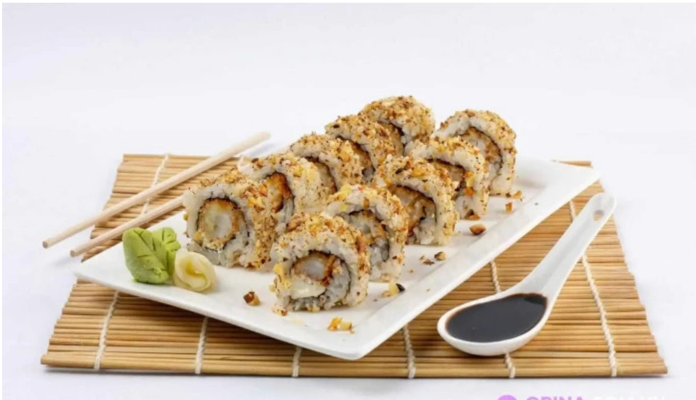
Sushi app parque miramar ciudad de la costa