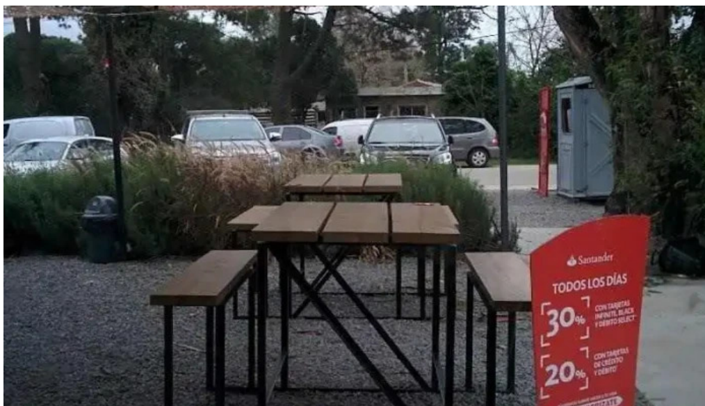
Sushi app parque miramar ambiente