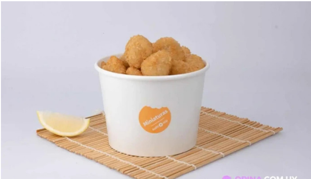
Sushi app parque miramar comida y bebida