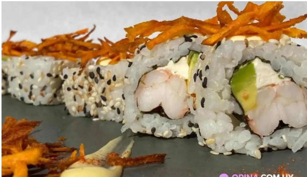
Sushi app parque miramar sushi