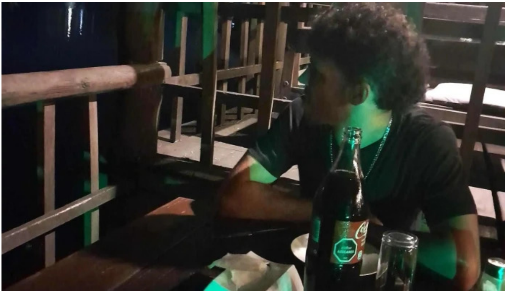
Indico pizza bar comentario 1