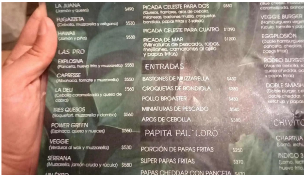
Indico pizza bar comentario 4