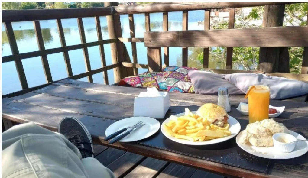
Indico pizza bar comidas y bebidas