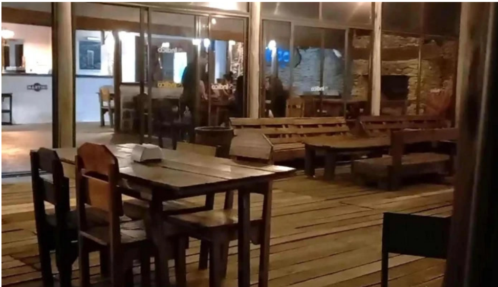
Indico pizza bar comentario 3