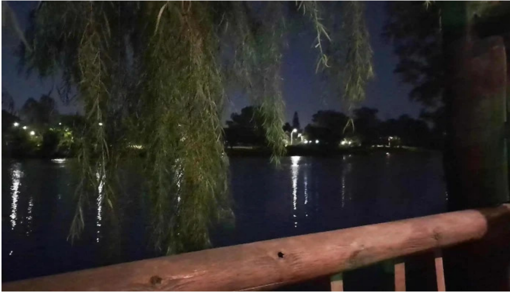
Indico pizza bar comentario 2