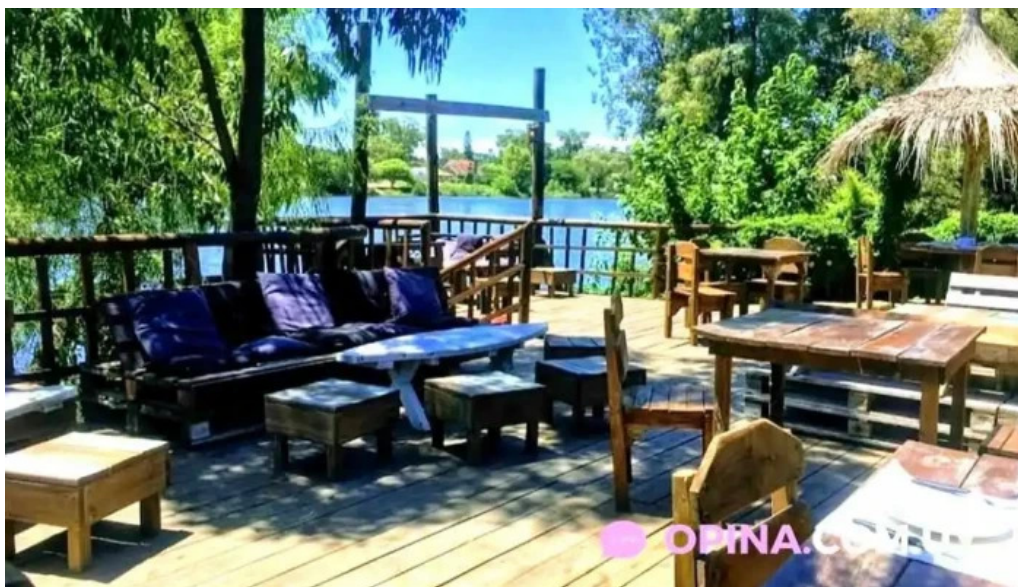
Indico pizza bar ciudad de la costa