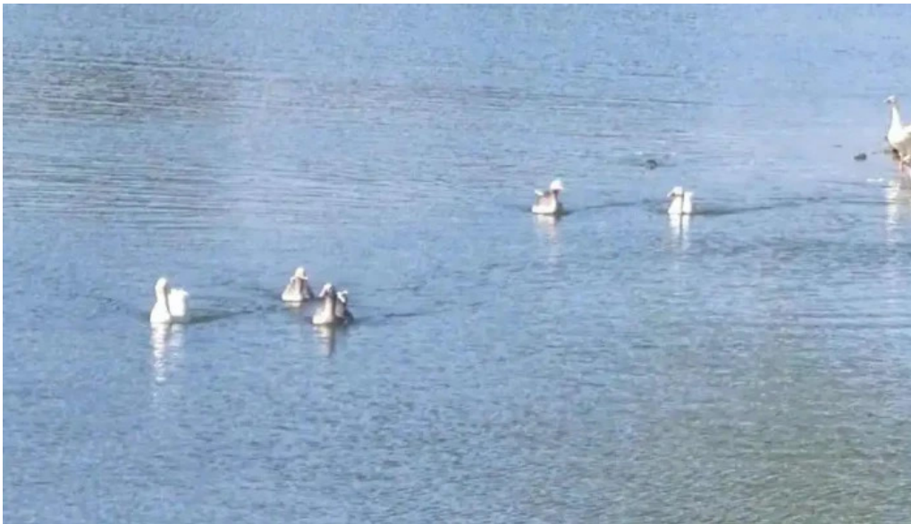
Indico pizza bar videos