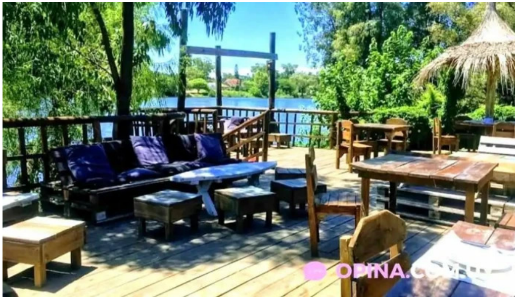
Indico pizza bar todo