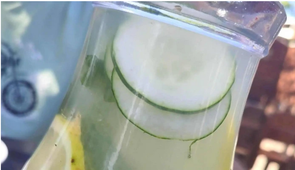
Indico pizza bar comentario 8