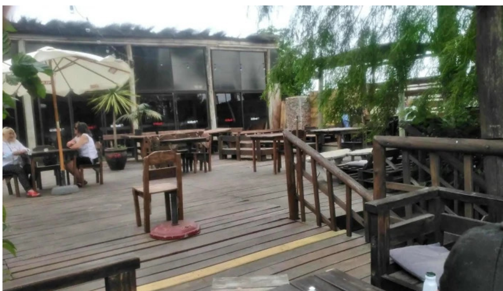
Indico pizza bar ambiente