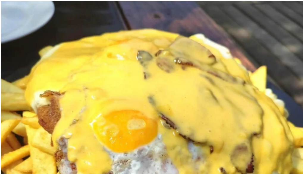
Indico pizza bar comentario 7