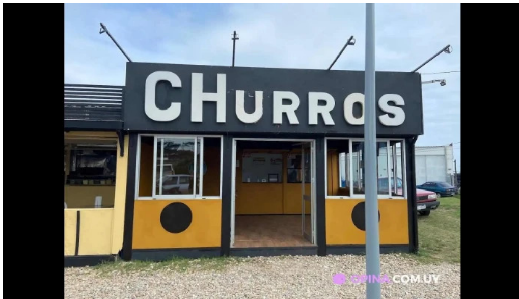
Churros danyis la paloma