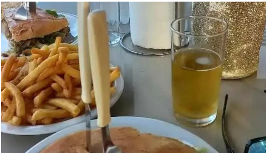
Churros danyis comida y bebida