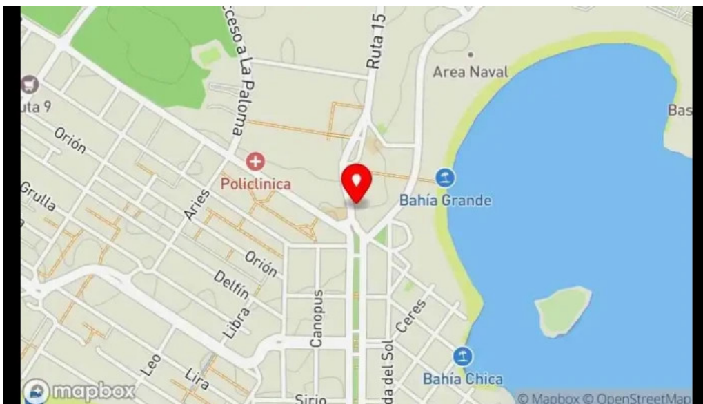
Churros danyis mapa