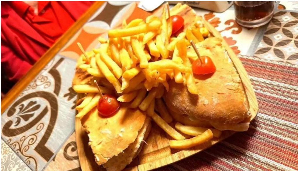
Chiviteria mariscal papas fritas