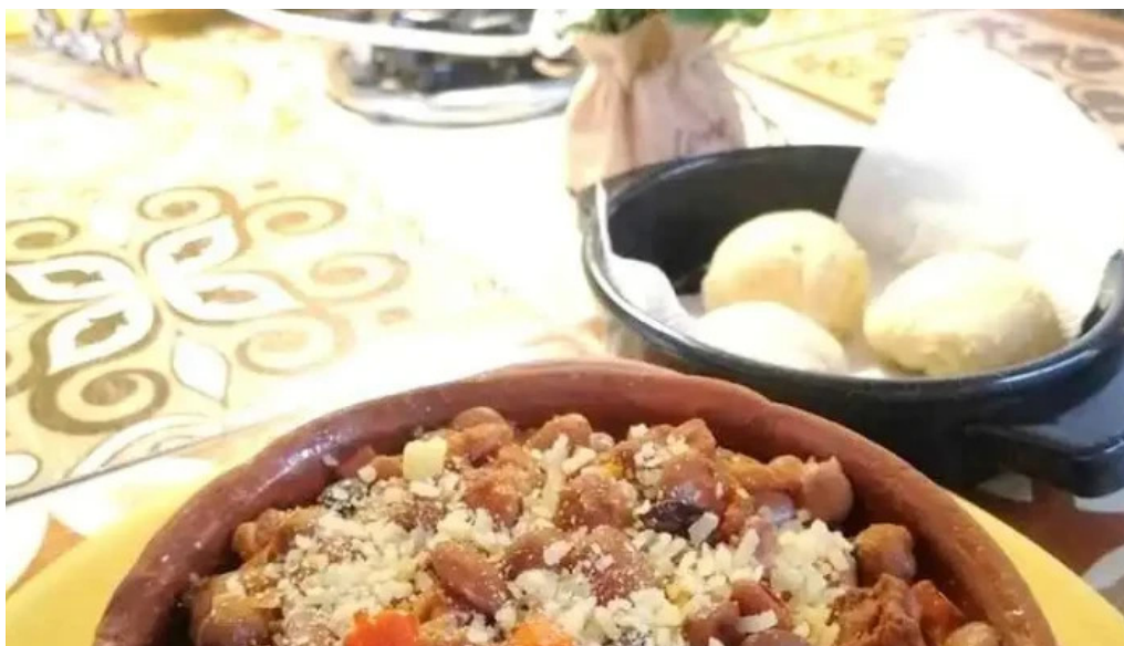
Chivitería mariscalá comida y bebida