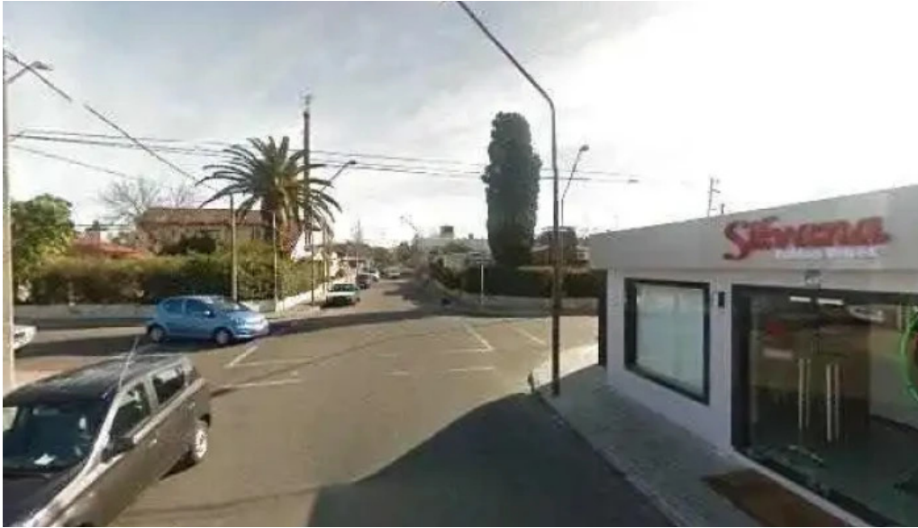
Chiviteria mariscal street view y 360