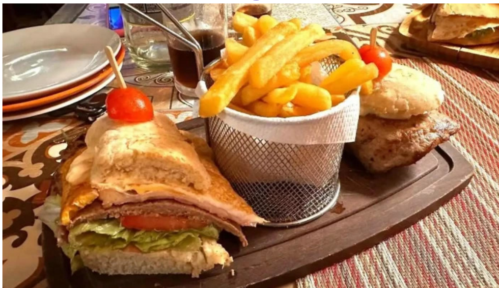
Chiviteria mariscalá todas