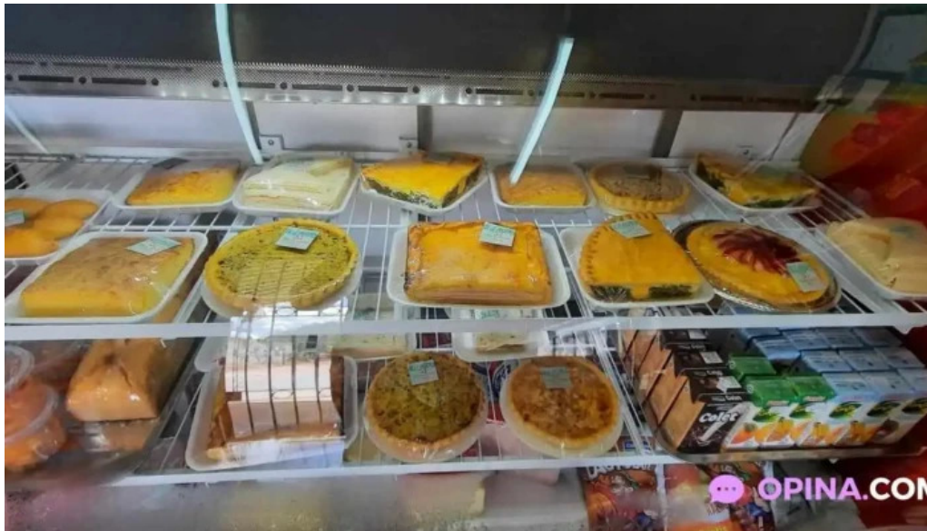
Celiacos 33 comida y bebida