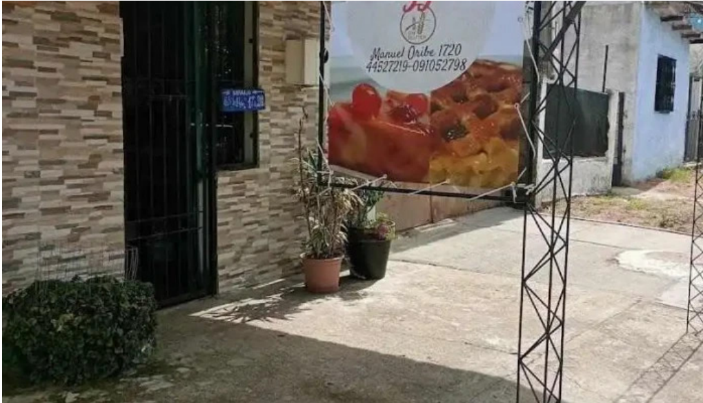
Celiacos 33 mas recientes