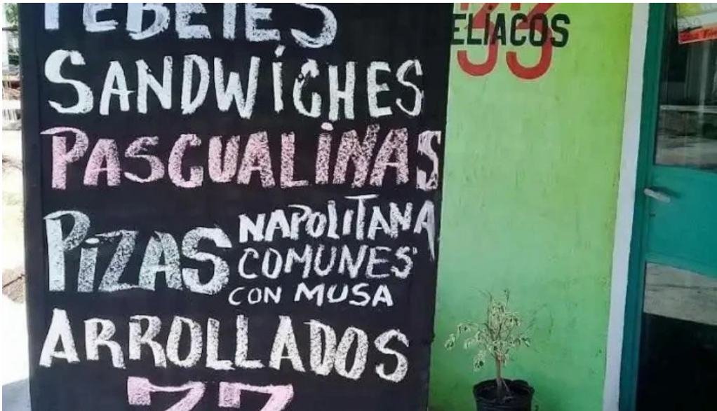
Celiacos 33 menu