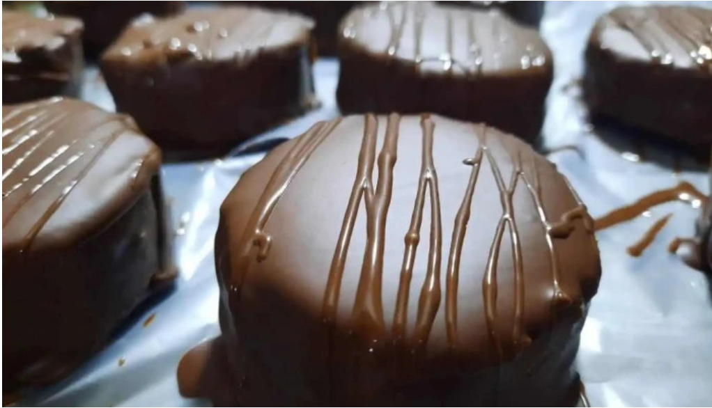
Celiacos 33 todas