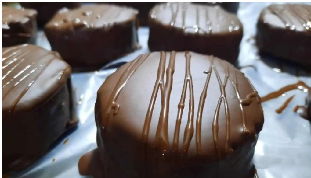
Celiacos 33 treinta y tres