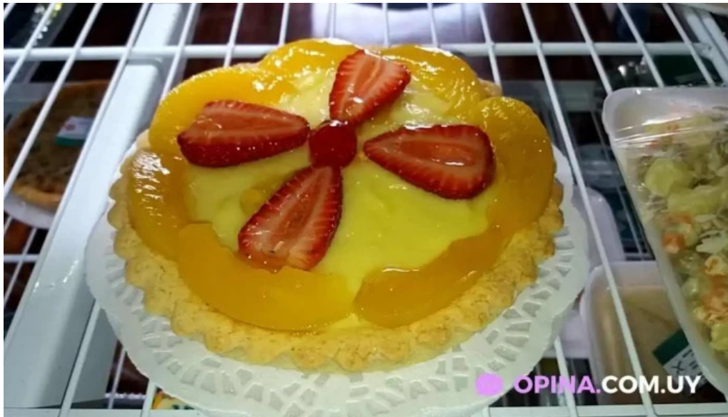
Celiacos 33 videos