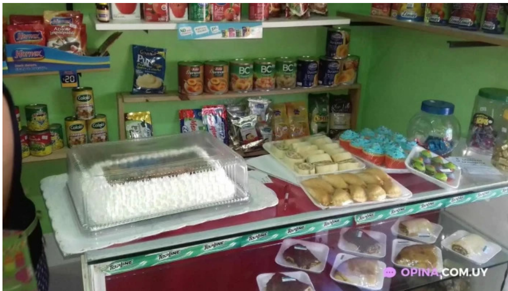
Celiacos 33 ambiente