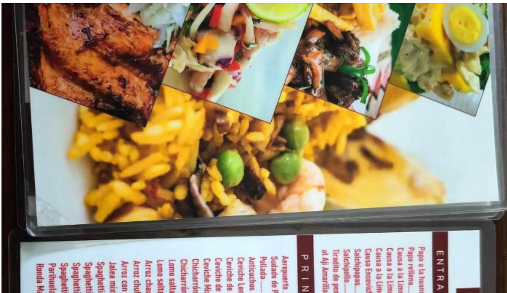
Cayena comentario 2