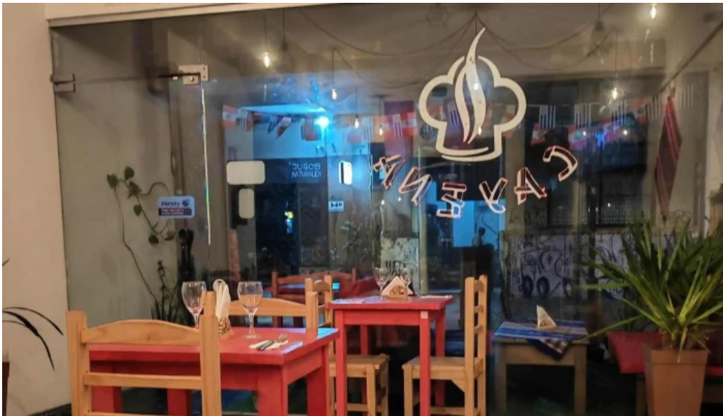
Cayena comentario 3