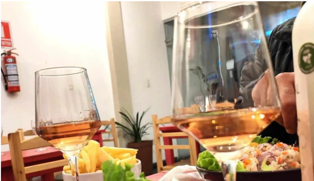
Cayena comentario 5