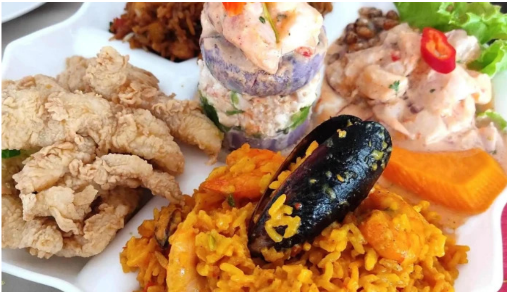
Cayena comentario 6