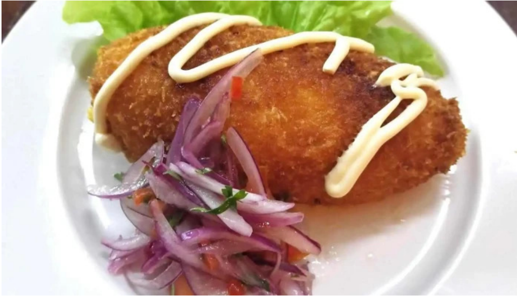
Cayena comidas y bebidas