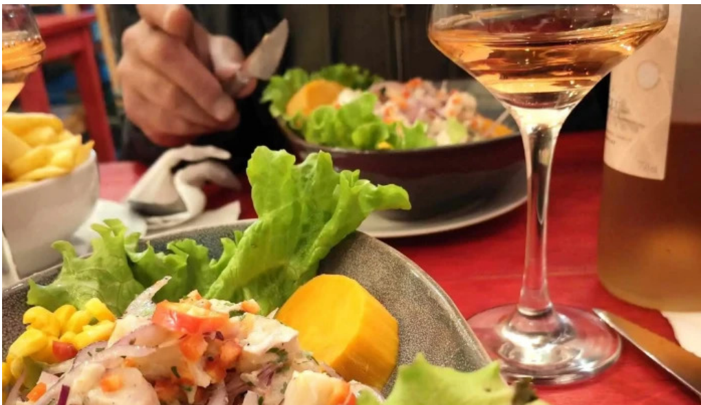
Cayena comentario 4