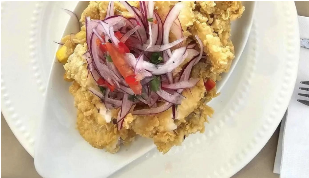
Cayena comentario 1