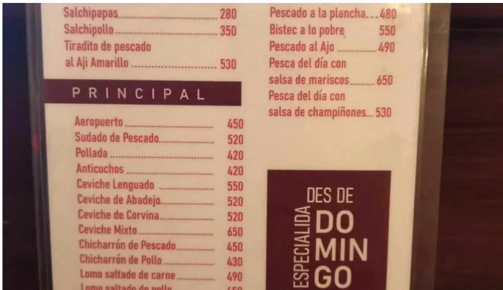
Cayena del propietario