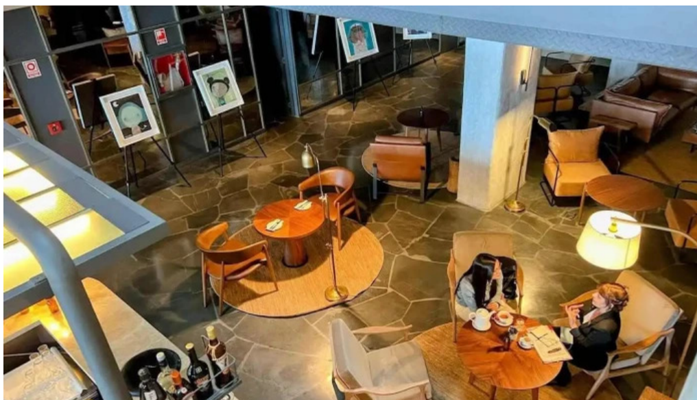
Cauce restaurante ambiente