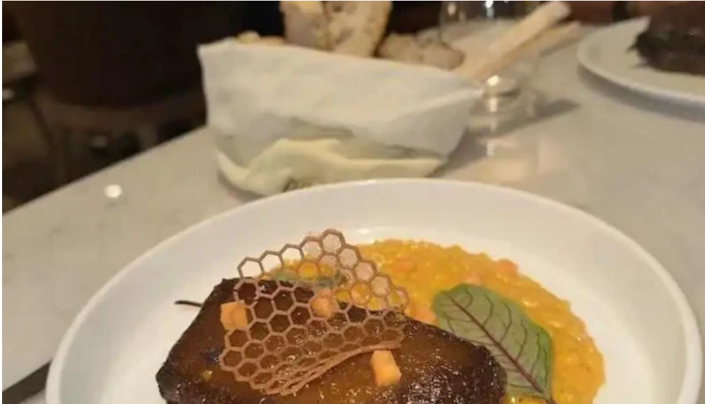
Cauce restaurante mas recientes