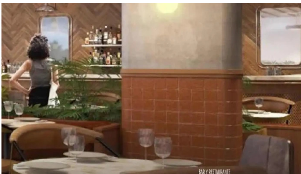
Cauce restaurante todas