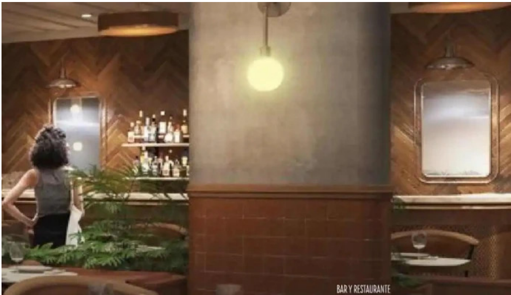
Cauce restaurante del propietario