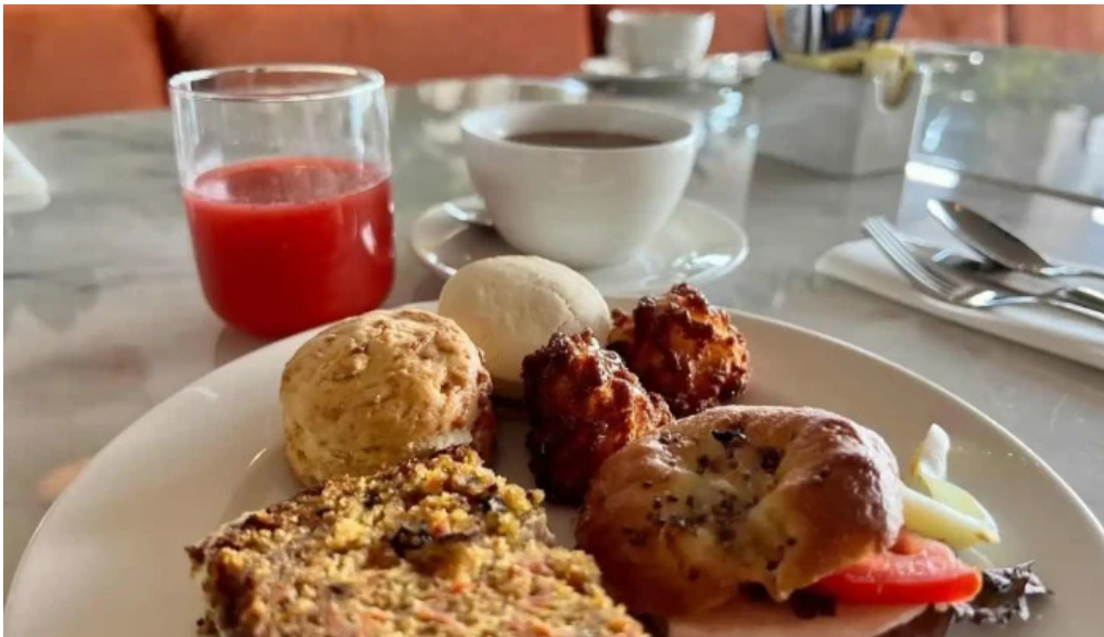
Cauce restaurante comida y bebida