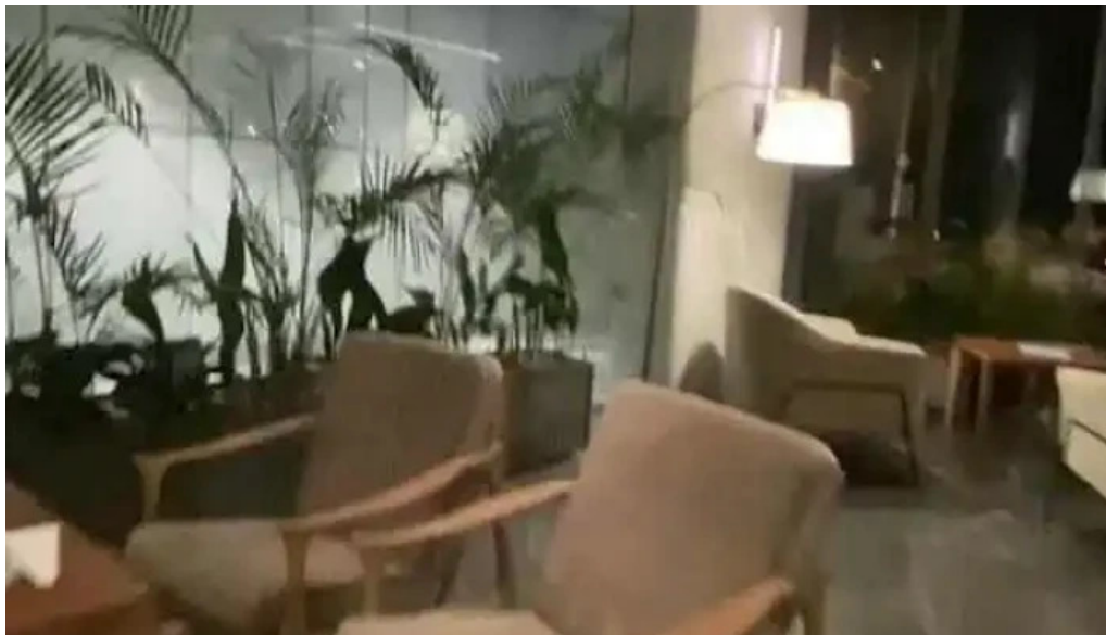
Cauce restaurante videos