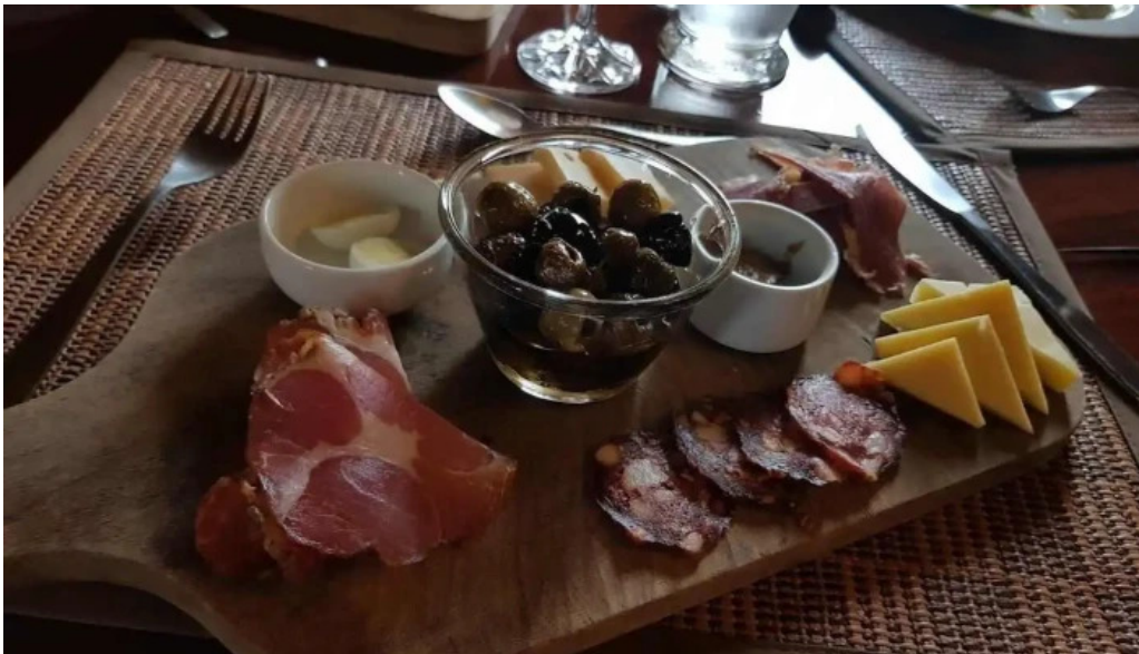
La pulperia charcuteria