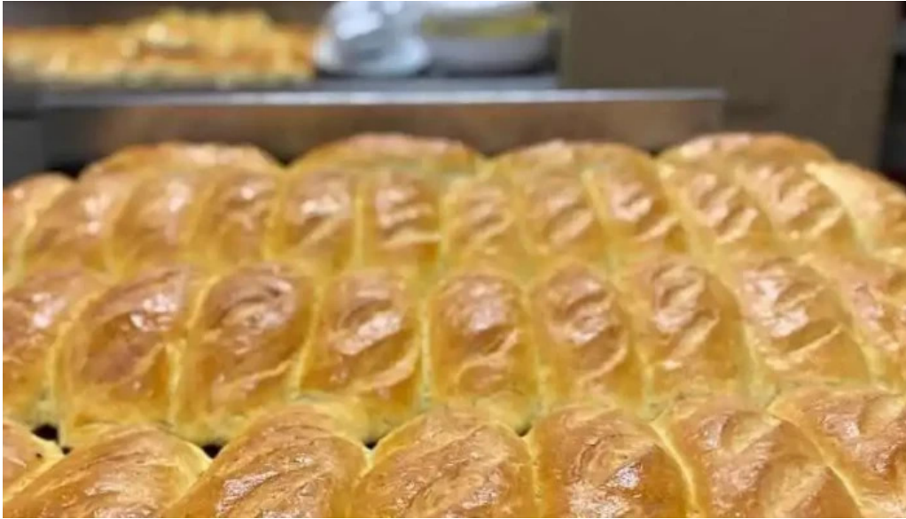
La pulperia comida y bebida