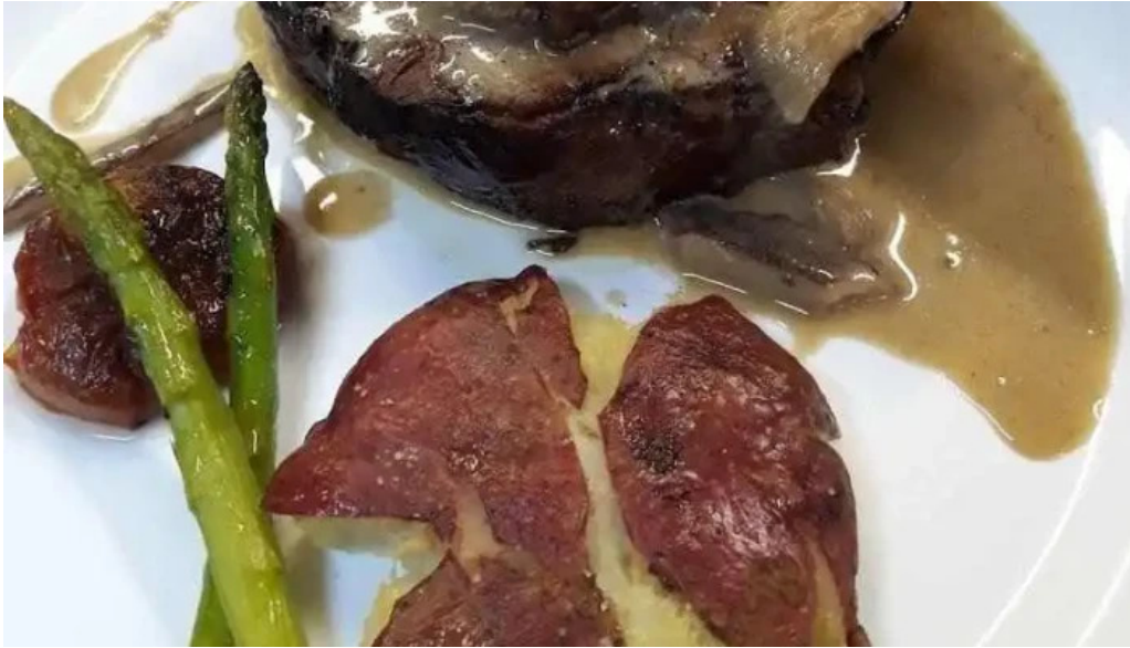
La pulperia filet mignon