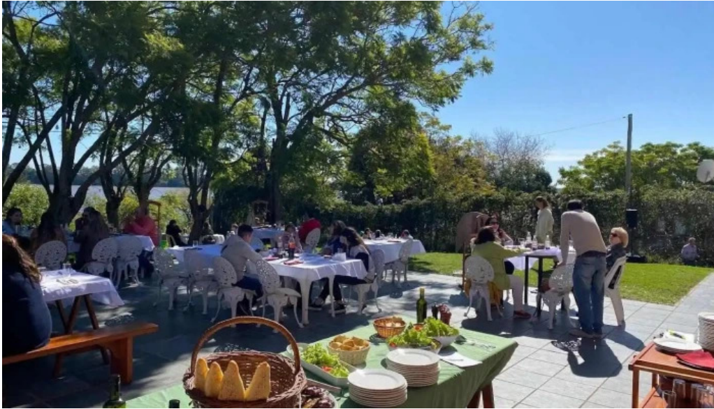
La pulperia casablanca