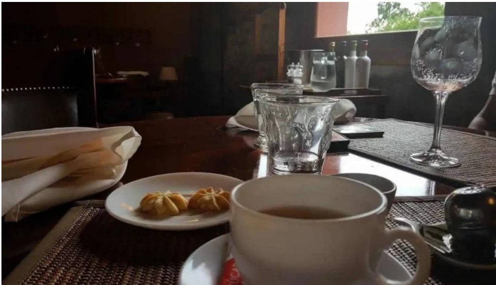
La pulperia cafe expreso