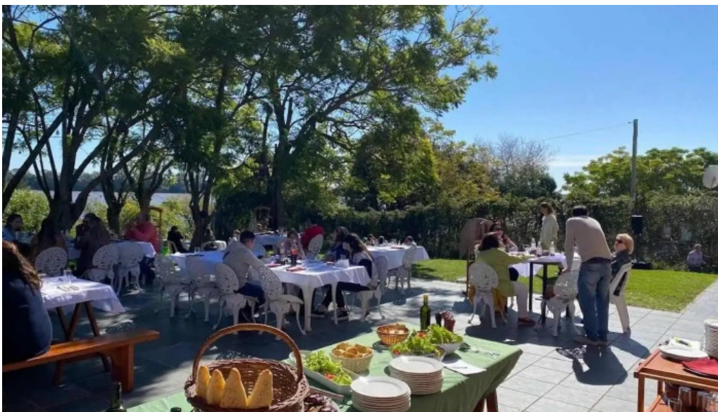
La pulperia todas