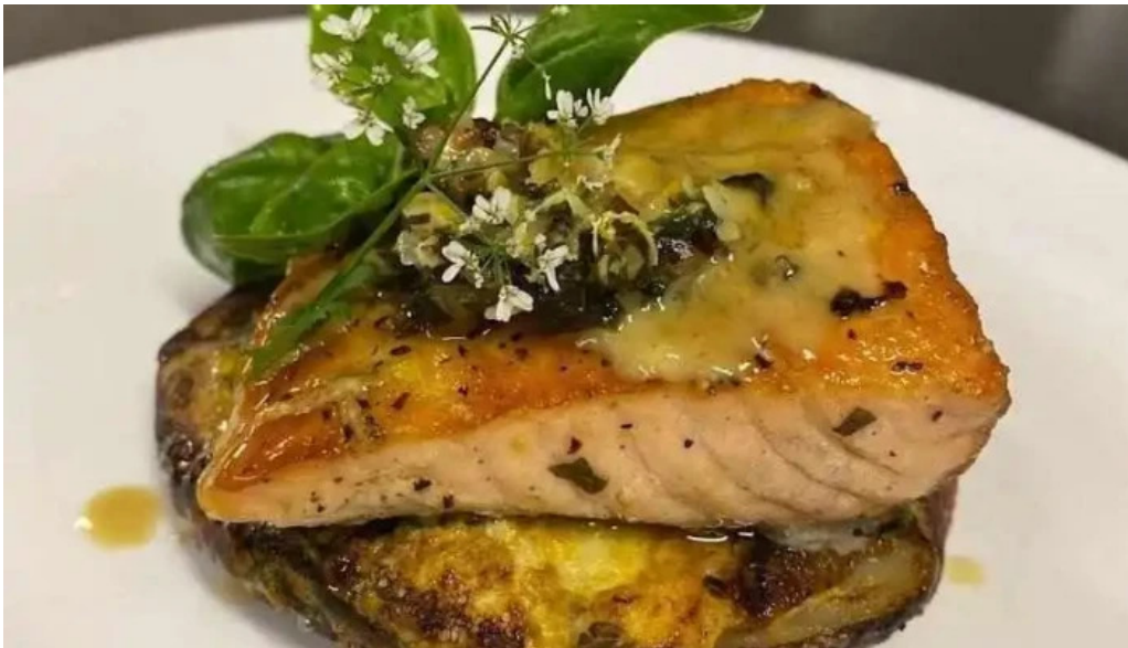
La pulperia del propietario