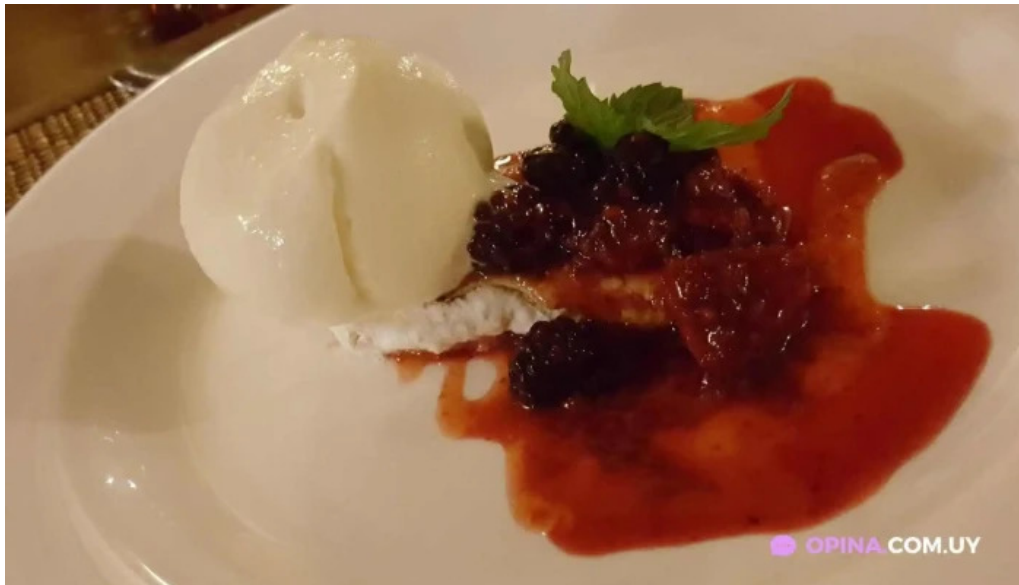
La pulperia panna cotta