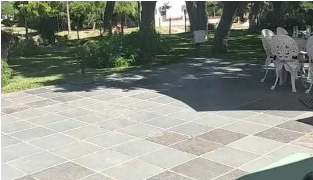
La pulperia videos