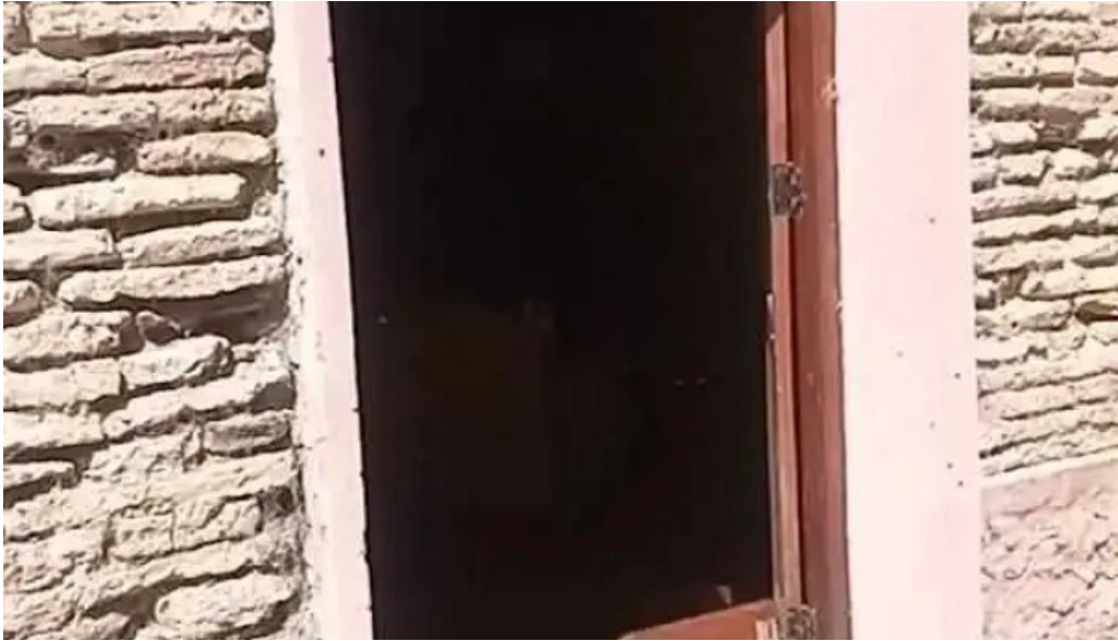
La pulperia mas recientes