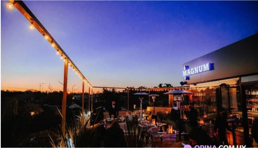
Casa magnum del propietario