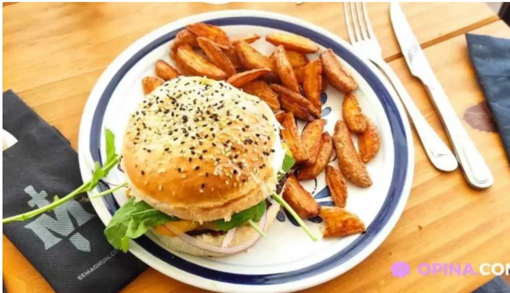
Casa magnum hamburguesa