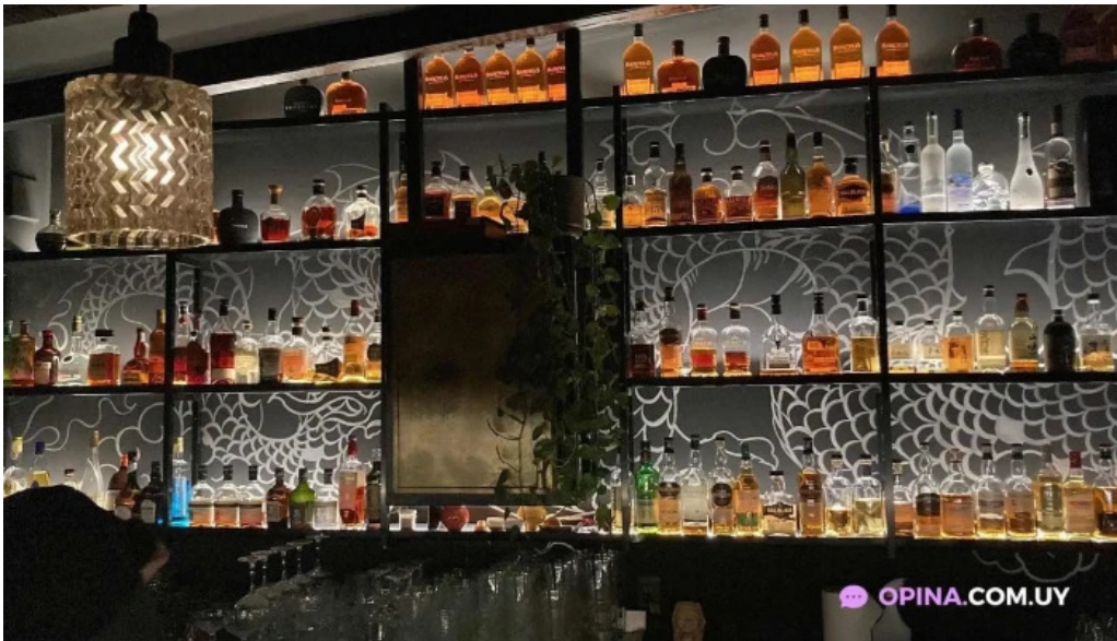
Casa magnum todas