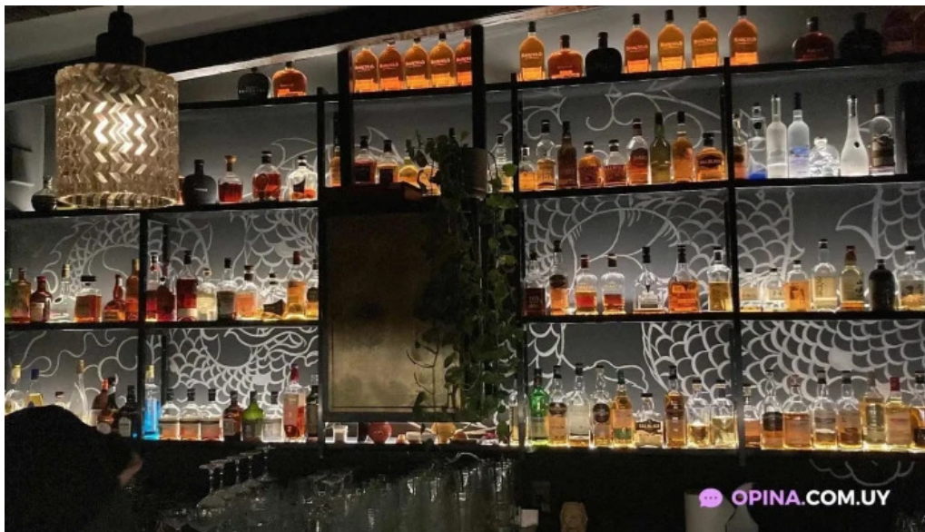
Casa magnum montevideo