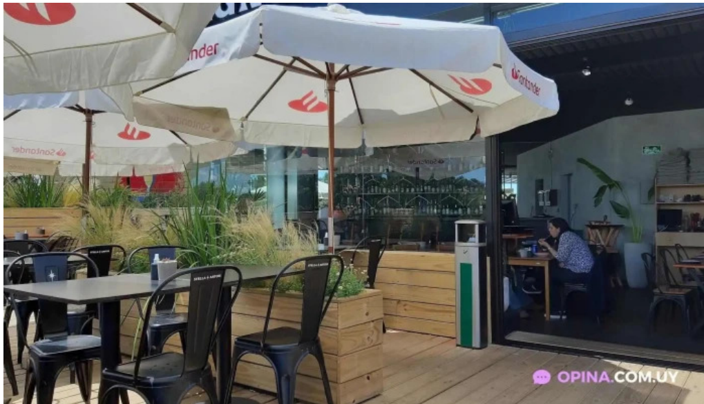
Casa magnum ambiente