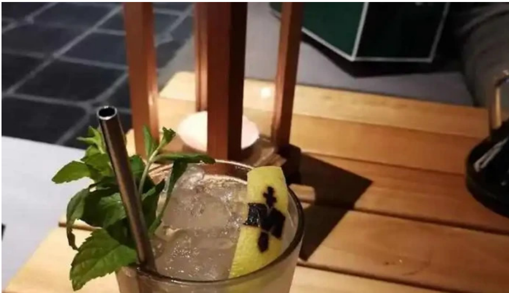
Casa magnum mojito