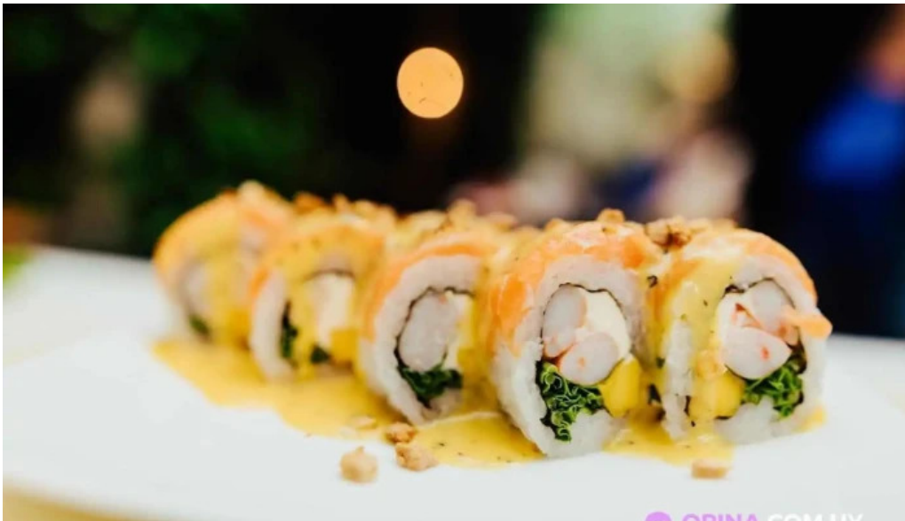
Casa magnum comida y bebida