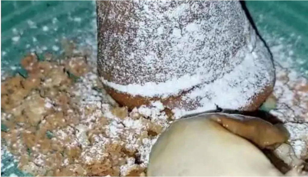
Casa magnum videos