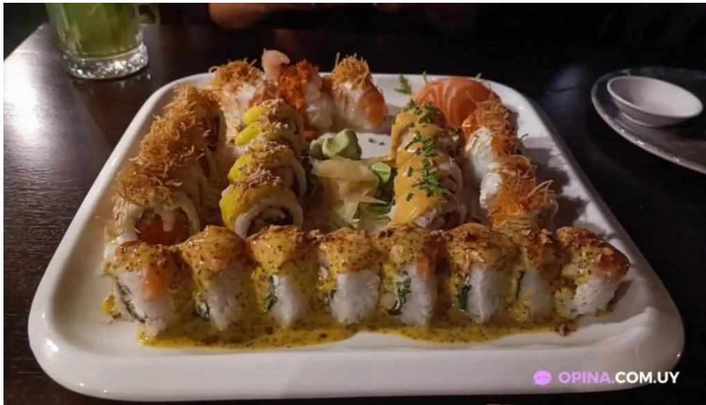
Casa magnum sushi