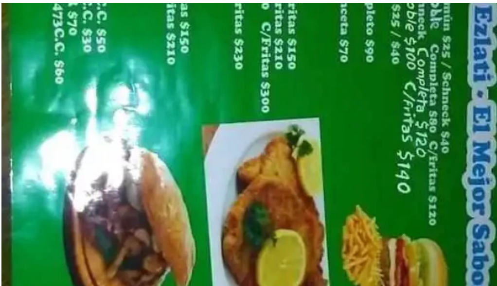
Carrito ezlati menu