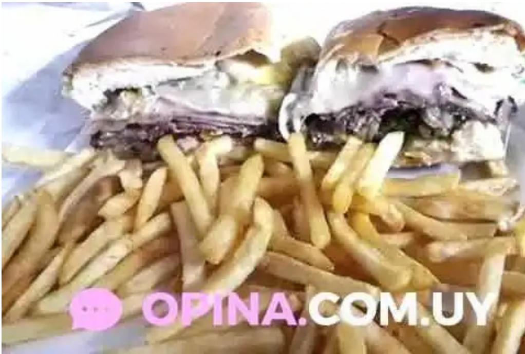
Carrito ezlati san jose de mayo