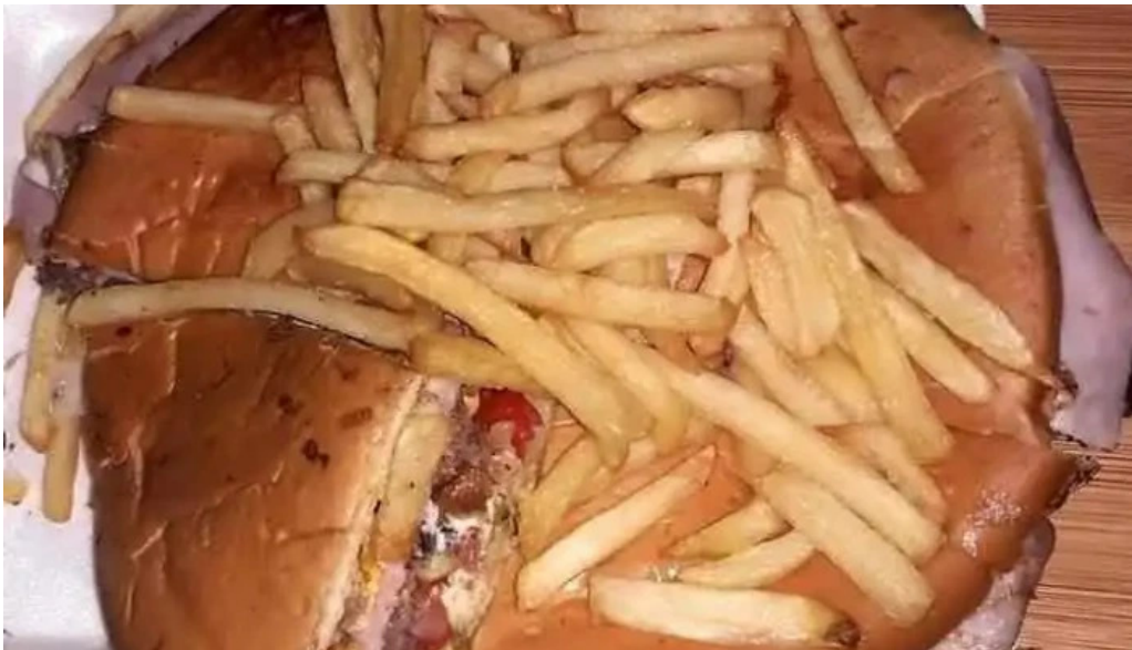
Carrito ezlati papas fritas