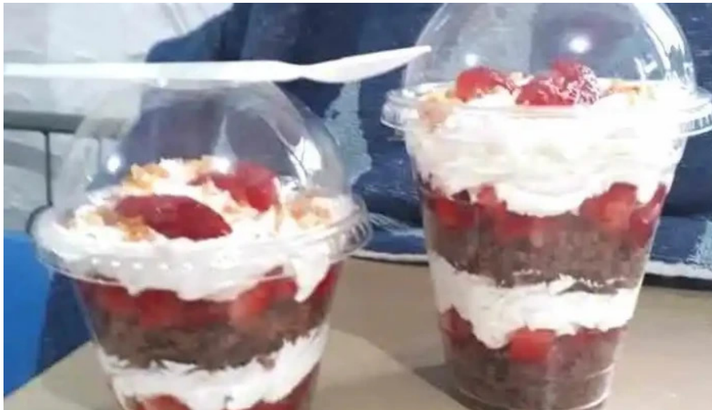
Carrito ezlati comida y bebida