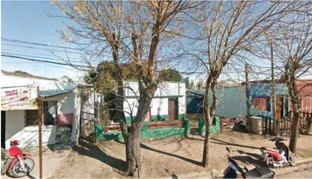
Carrito ezlati street view y 360