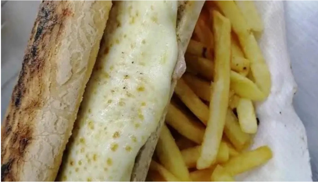
Carrito el 26 todas