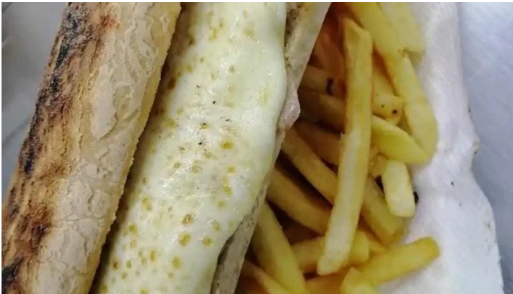
Carrito el 26 montevideo