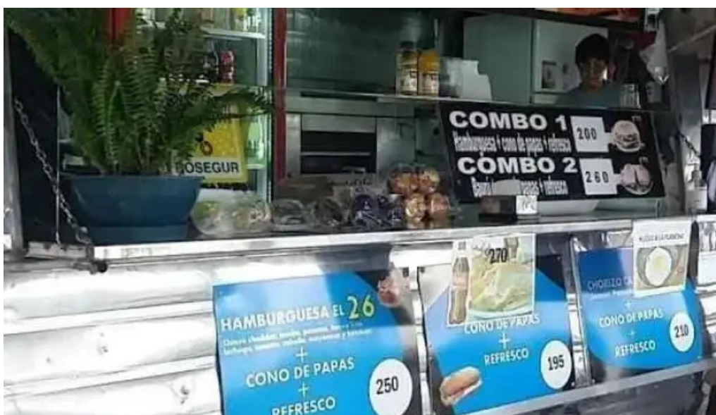
Carrito el 26 ambiente