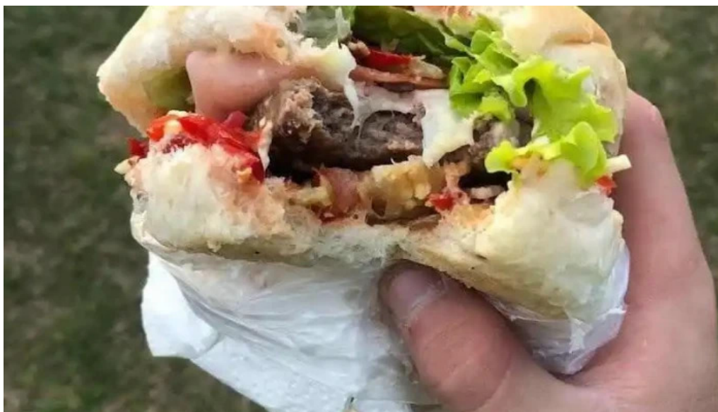
Carrito el 26 comida y bebida