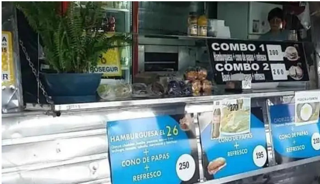
Carrito el 26 menu