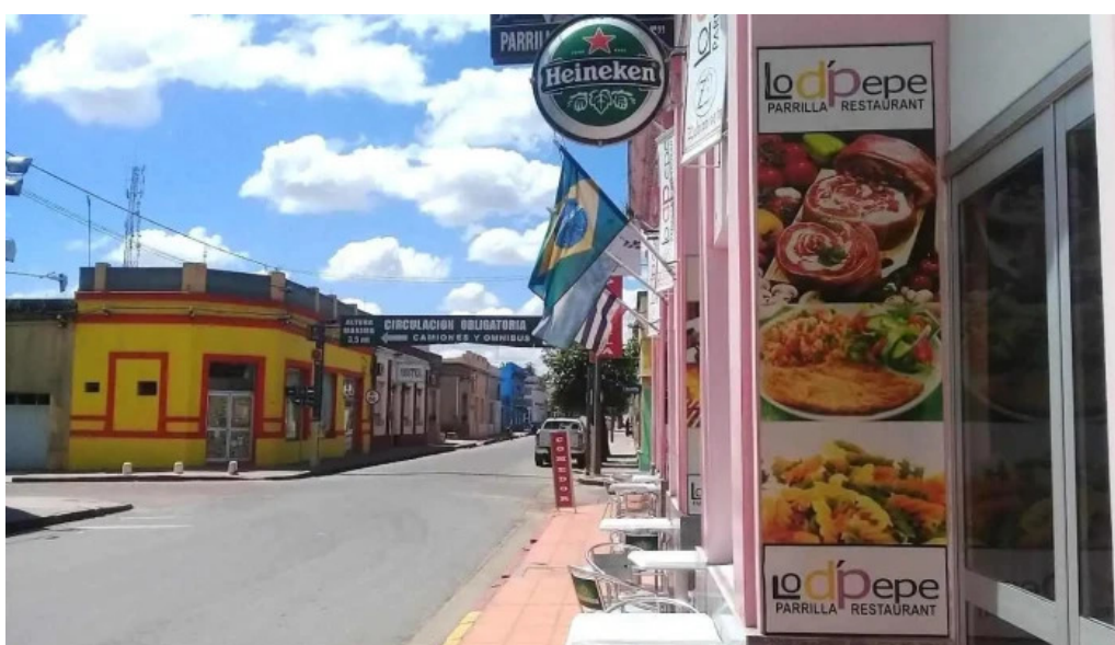
Lo d'pepe parrilla restaurant carmelo