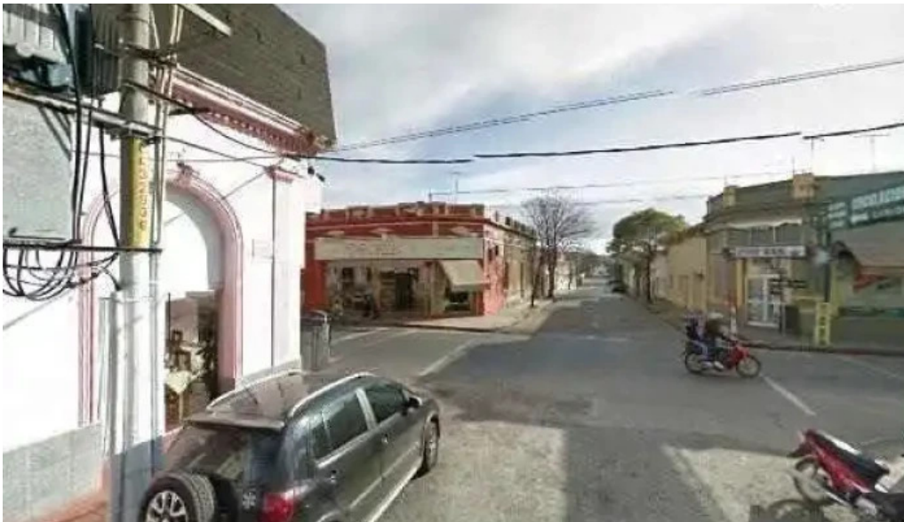
Lo dpepe parrilla restaurant street view y 360