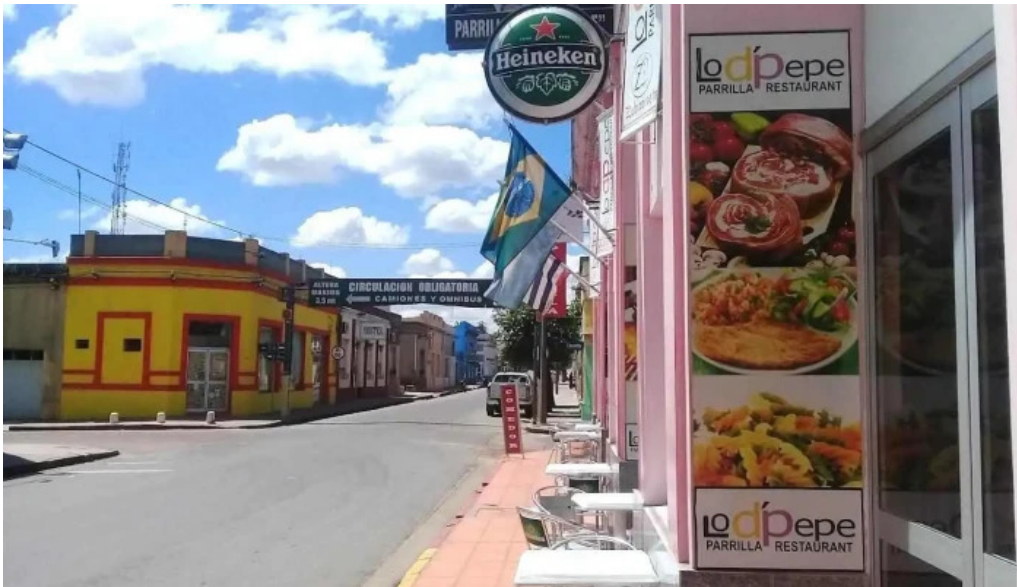
Lo dpepe parrilla restaurant todas