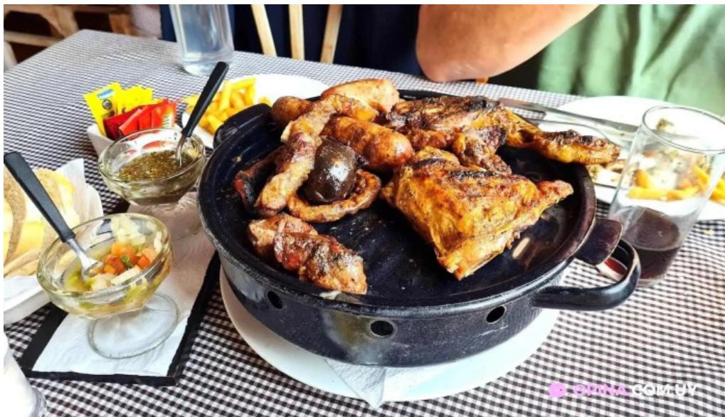
Lo dpepe parrilla restaurant comida y bebida