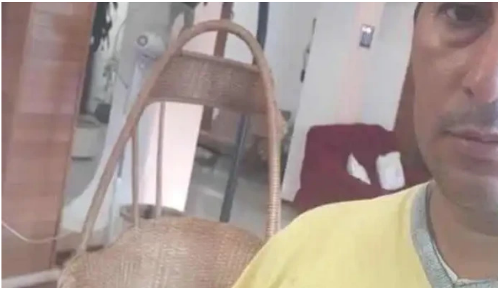
Lo dpepe parrilla restaurant videos