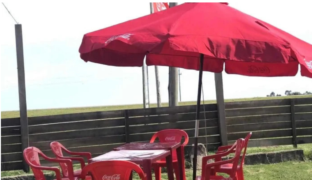
Carbon sabor todas