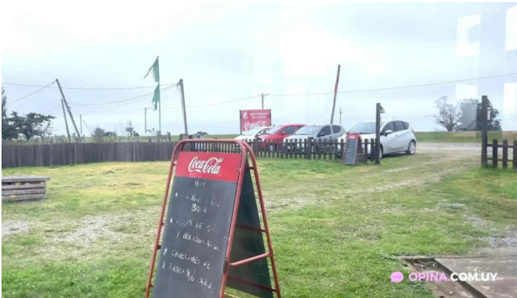
Carbon sabor videos