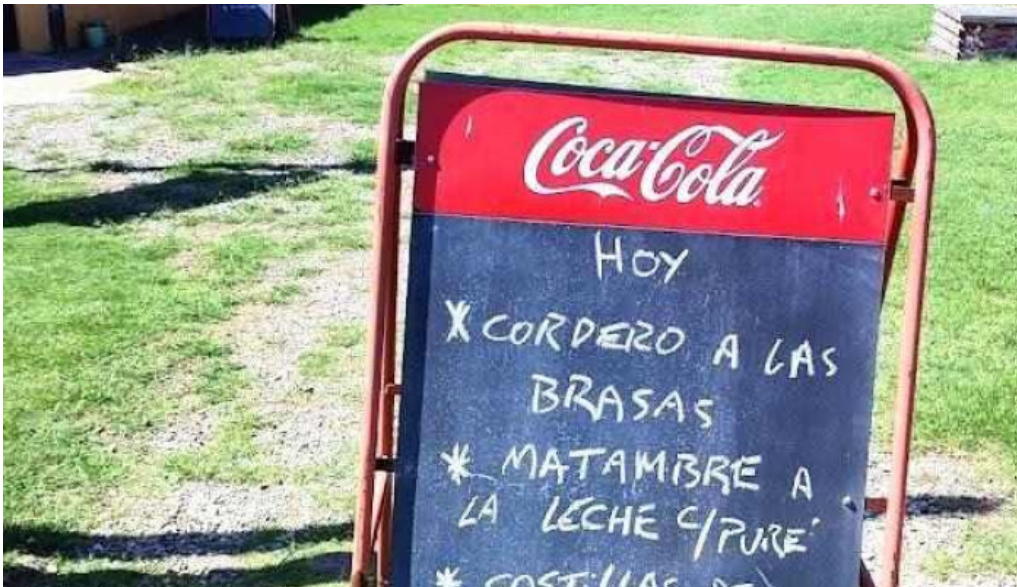
Carbon sabor menu