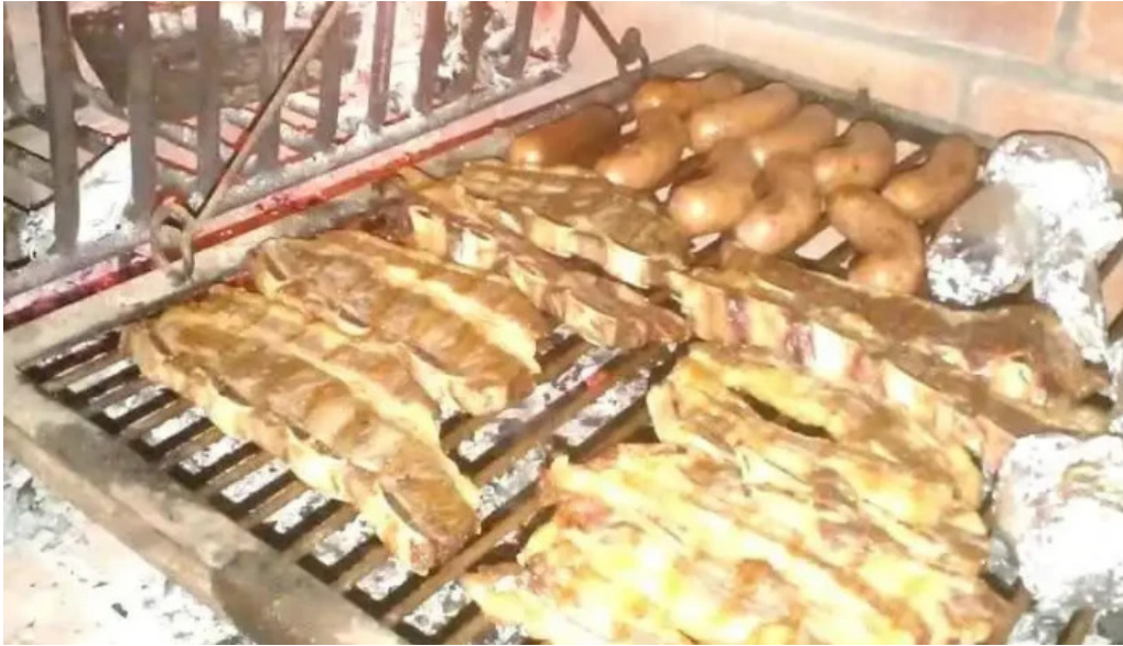
Carbon sabor del propietario