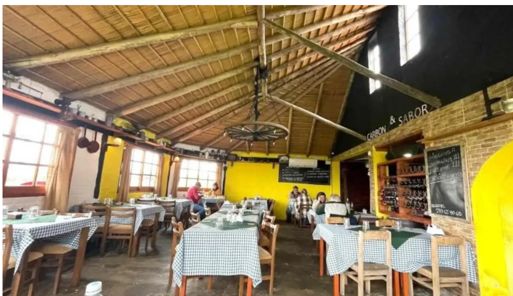
Carbon sabor ambiente