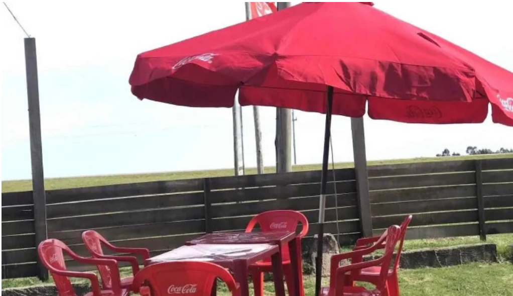
Carbon sabor solis de mataojo