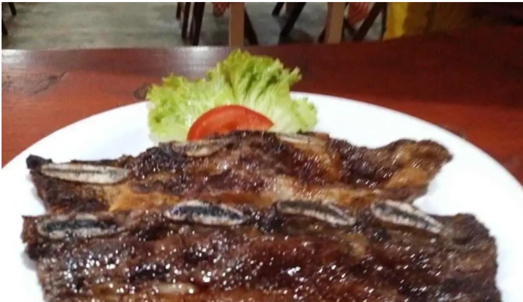
Carbon sabor comida y bebida