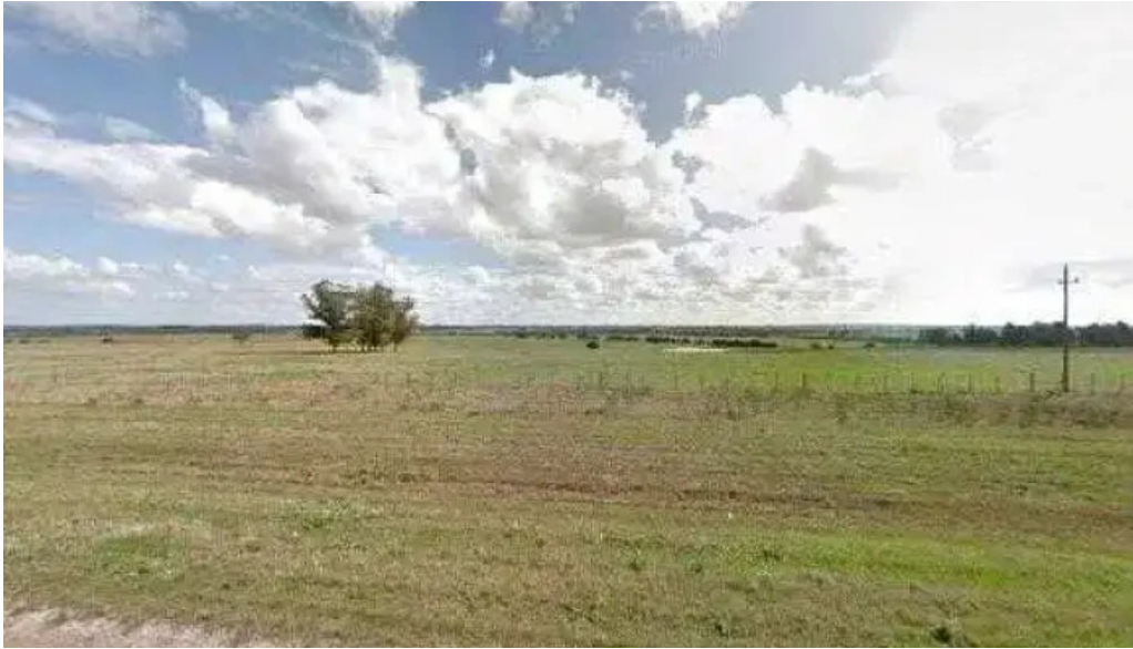
Carbon sabor street view y 360