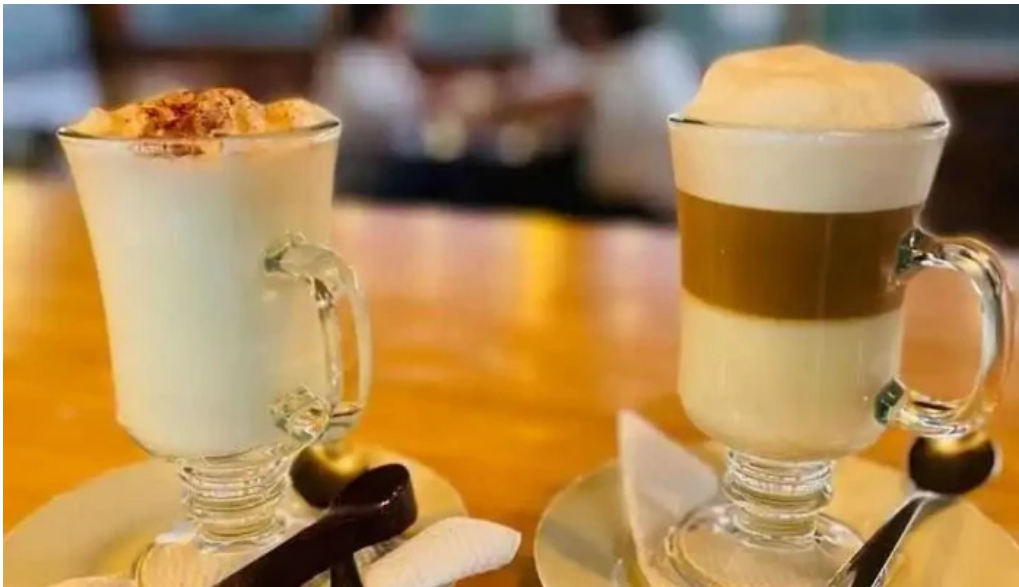
Cafe con sal del propietario