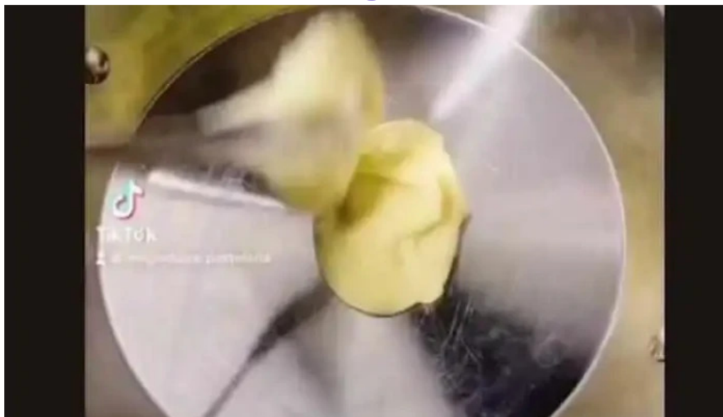
Cafe con sal videos