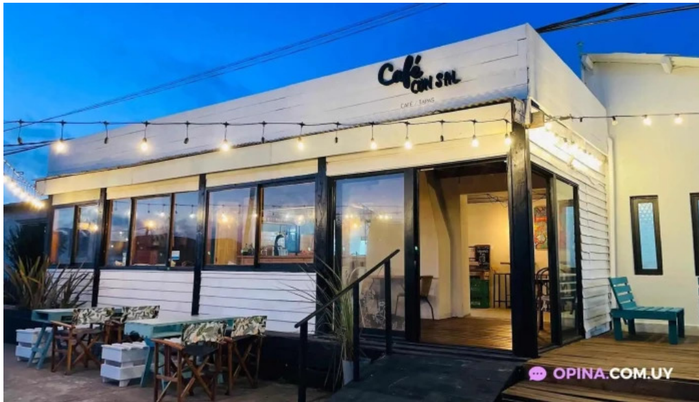
Cafe con sal todas