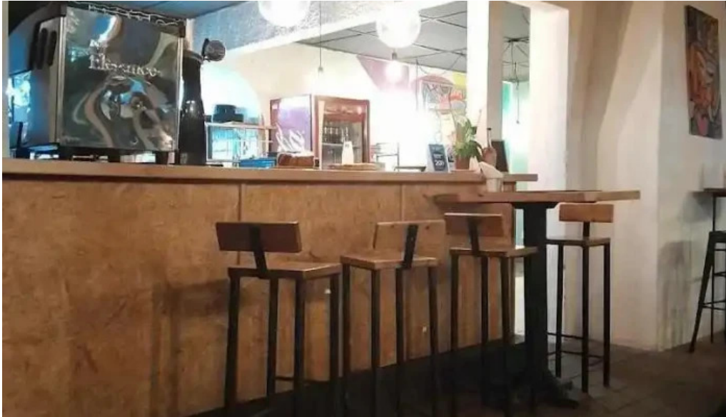
Cafe con sal ambiente