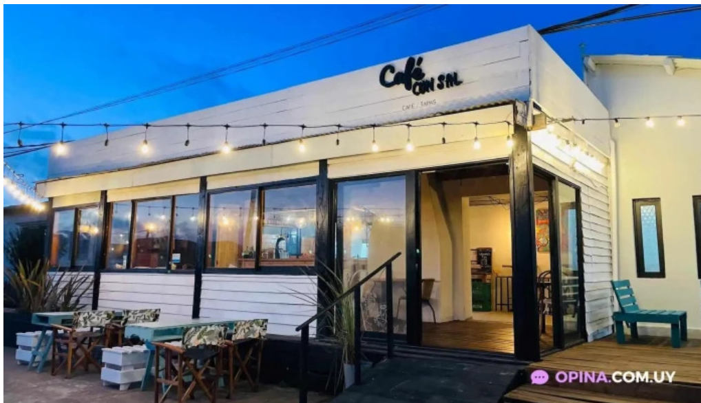
Cafe con sal la paloma