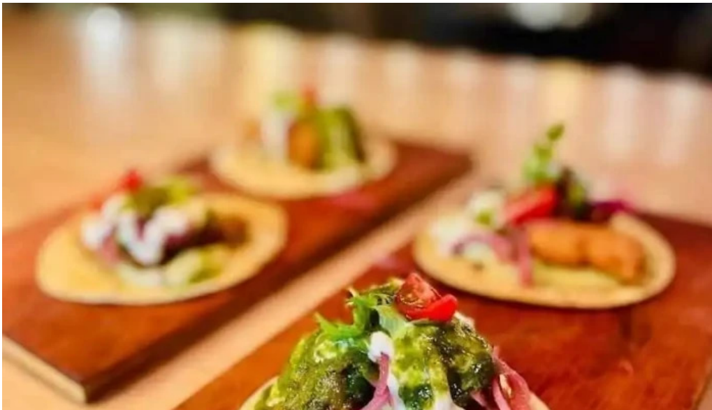
Cafe con sal comida y bebida