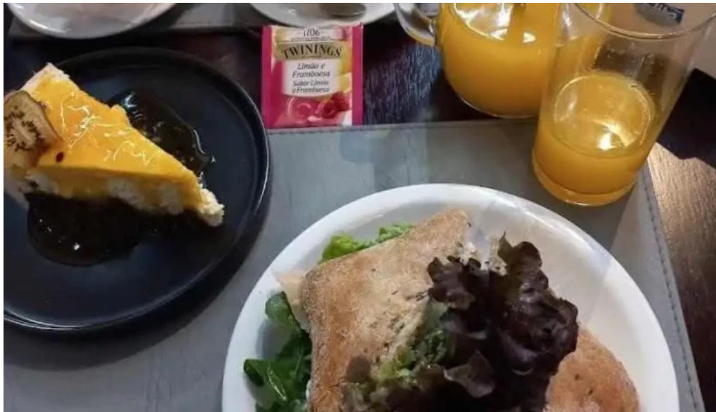
Cafe cai comida y bebida