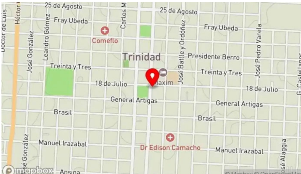
Cafe cai mapa