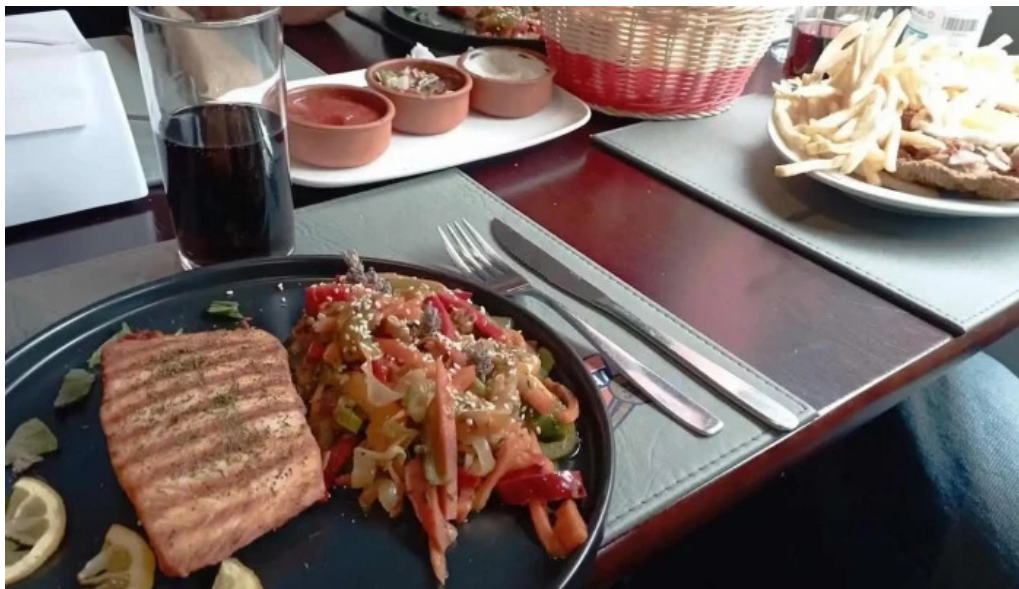
Cafe cai papas fritas