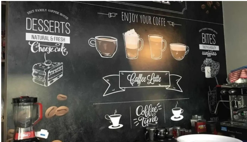
Cafe cai menu