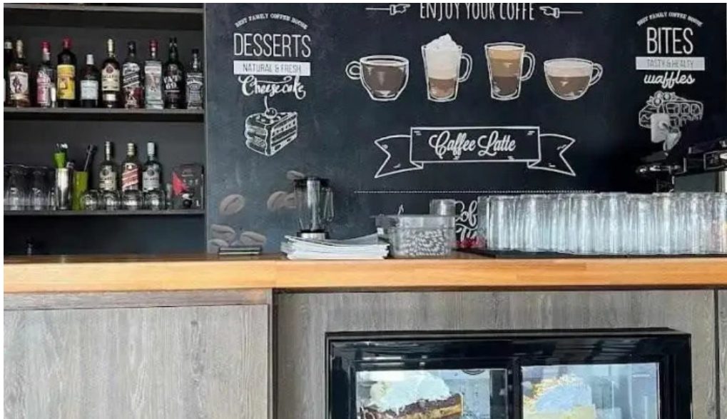
Cafe cai ambiente