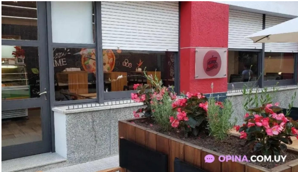
Cafe cai del propietario