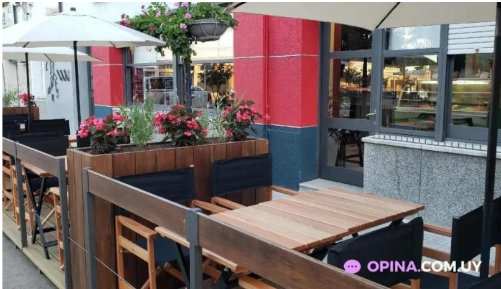
Cafe cai todas