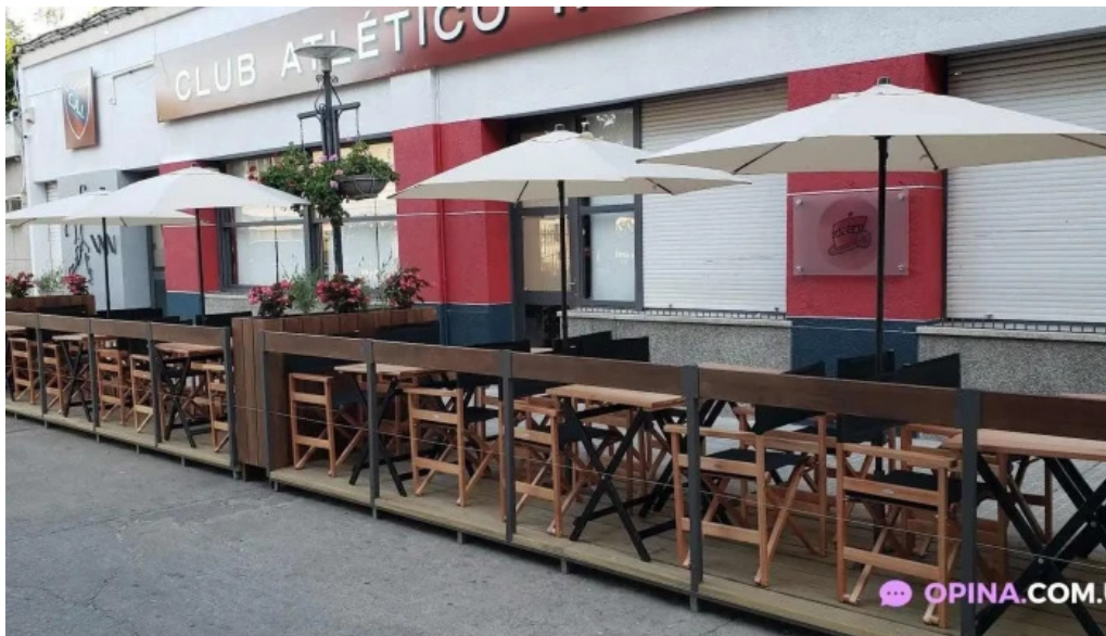
Cafe c a i trinidad