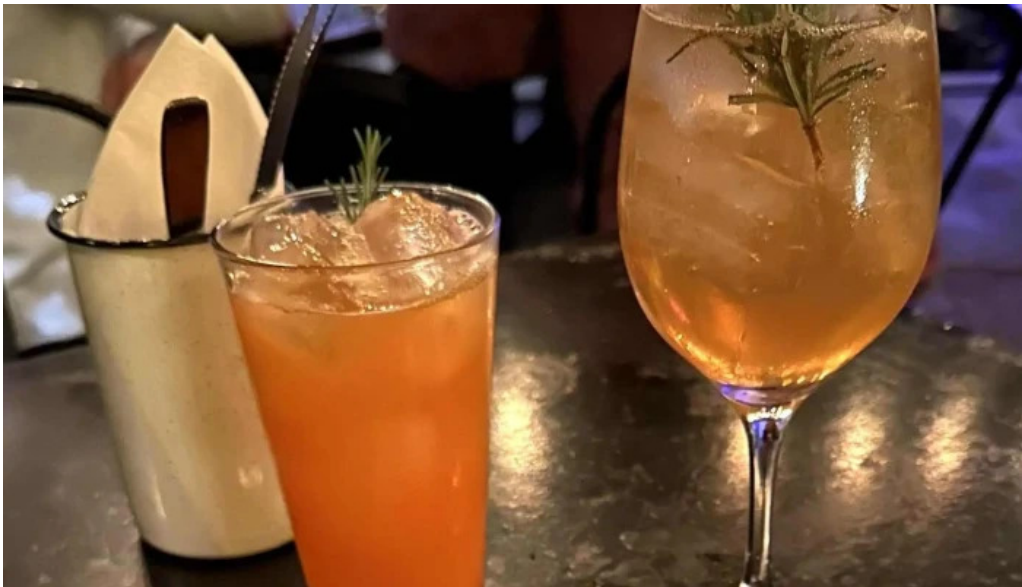
Brujona comentario 5