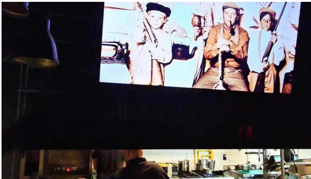
Brujona comentario 1