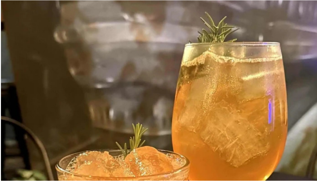
Brujona comentario 6