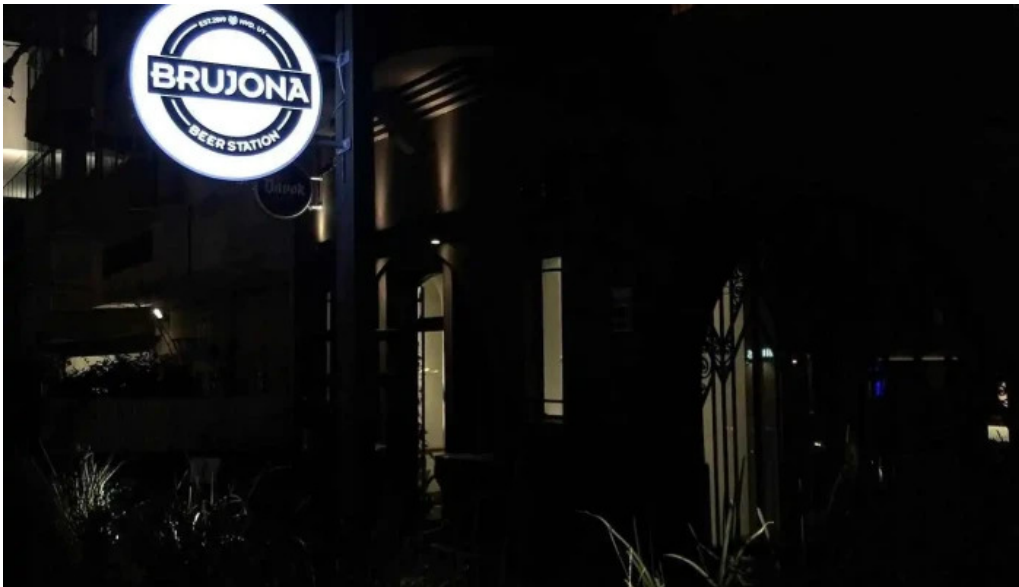
Brujona del propietario