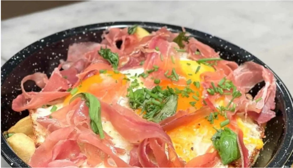
Brujona comidas y bebidas