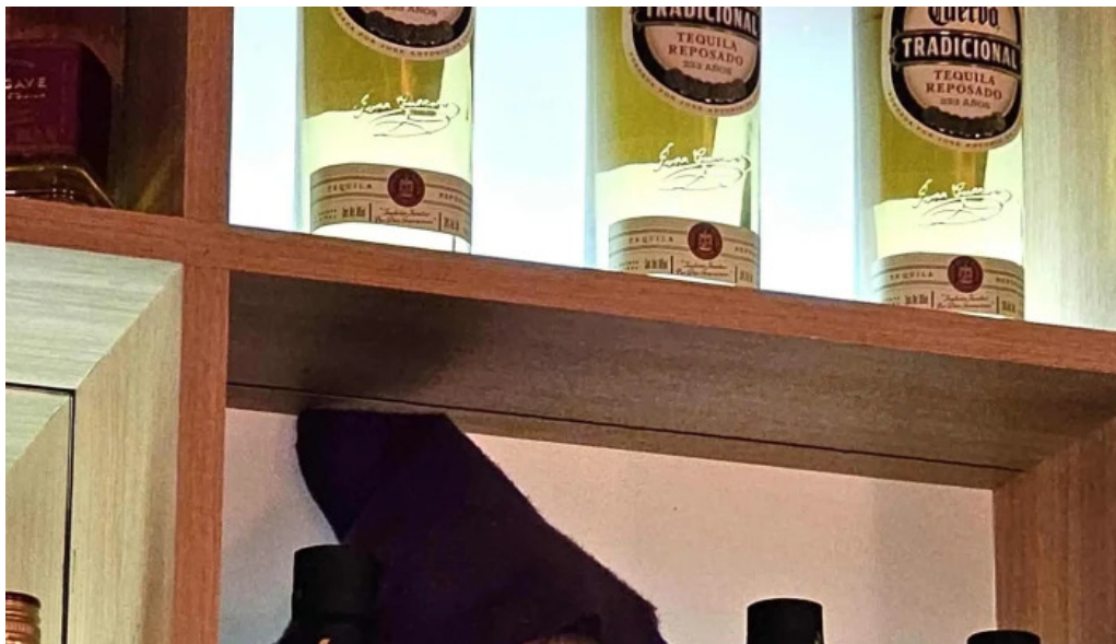
Brujona comentario 3