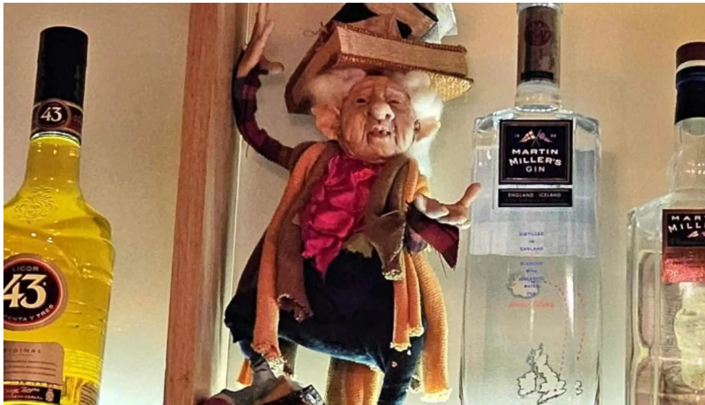
Brujona comentario 2