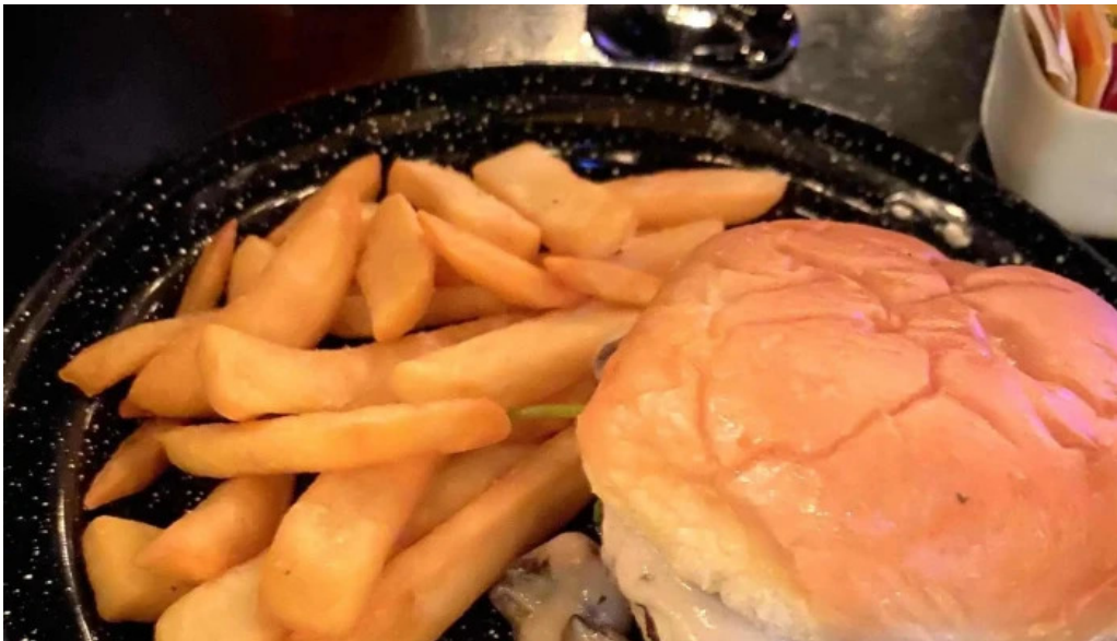
Brujona comentario 7