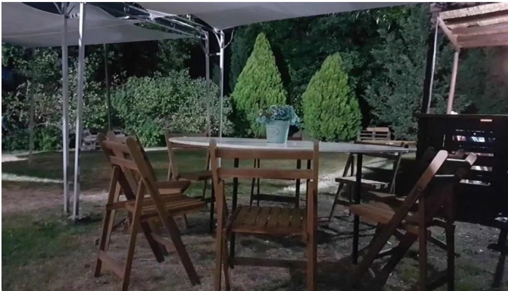
Brazuca nueva helvecia