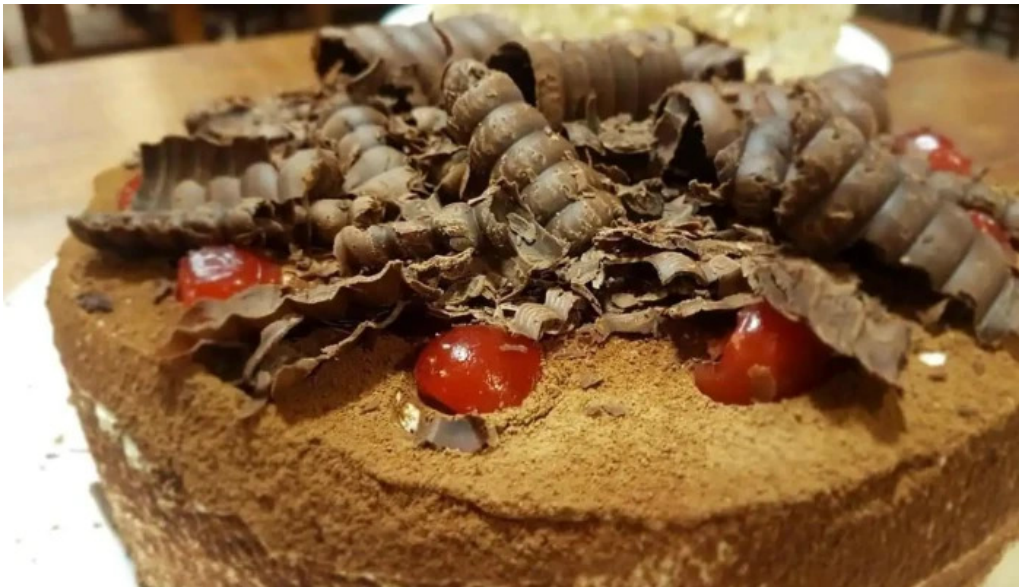
Brazuca del propietario