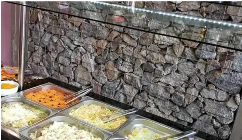
Brazuca comida y bebida