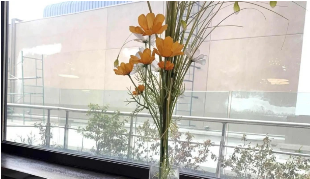
Blas comentario 2