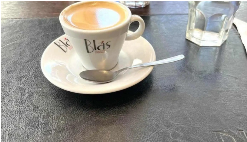
Blas cafe expresso