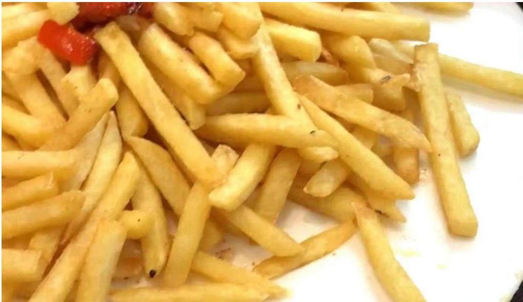
Blas comentario 1