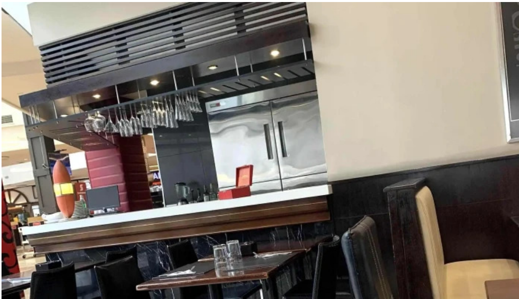
Blas comentario 3