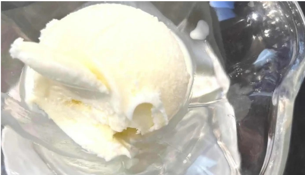
Blas helado italiano