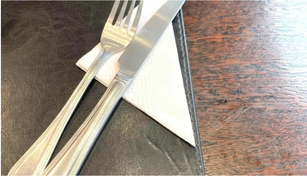
Blas comentario 4