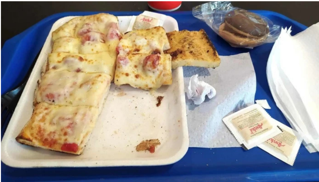
Blas comidas y bebidas