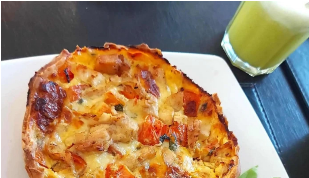
Blas comentario 6