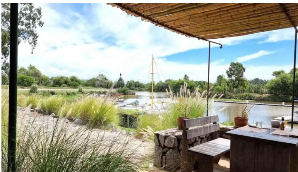
Basta pedro ambiente