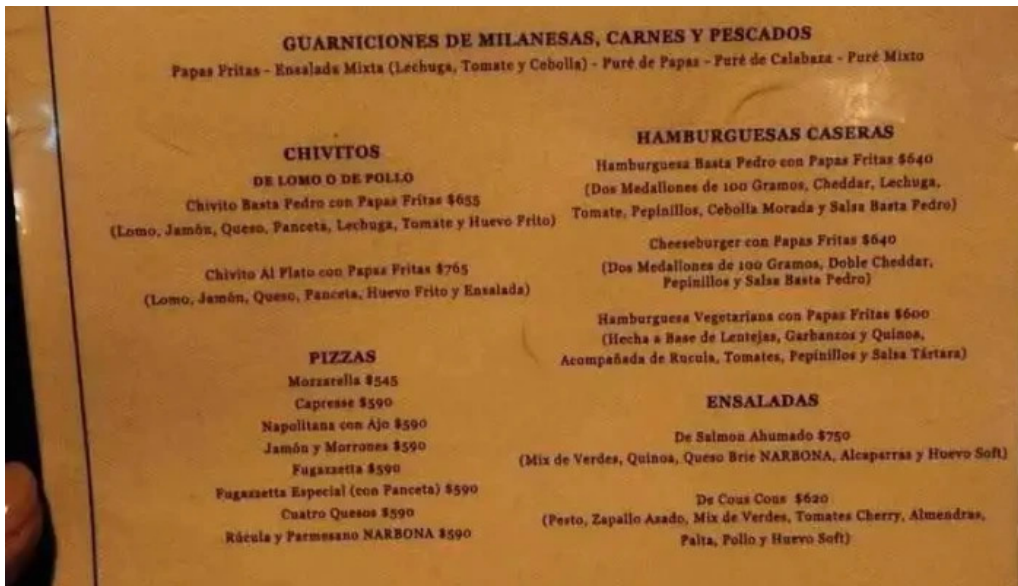
Basta pedro menu