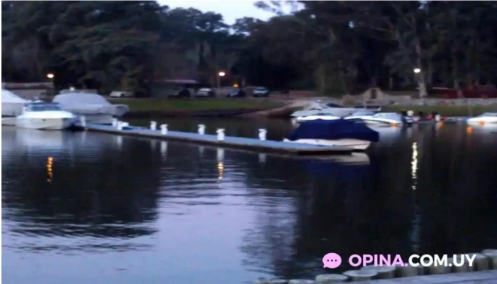
Basta pedro videos