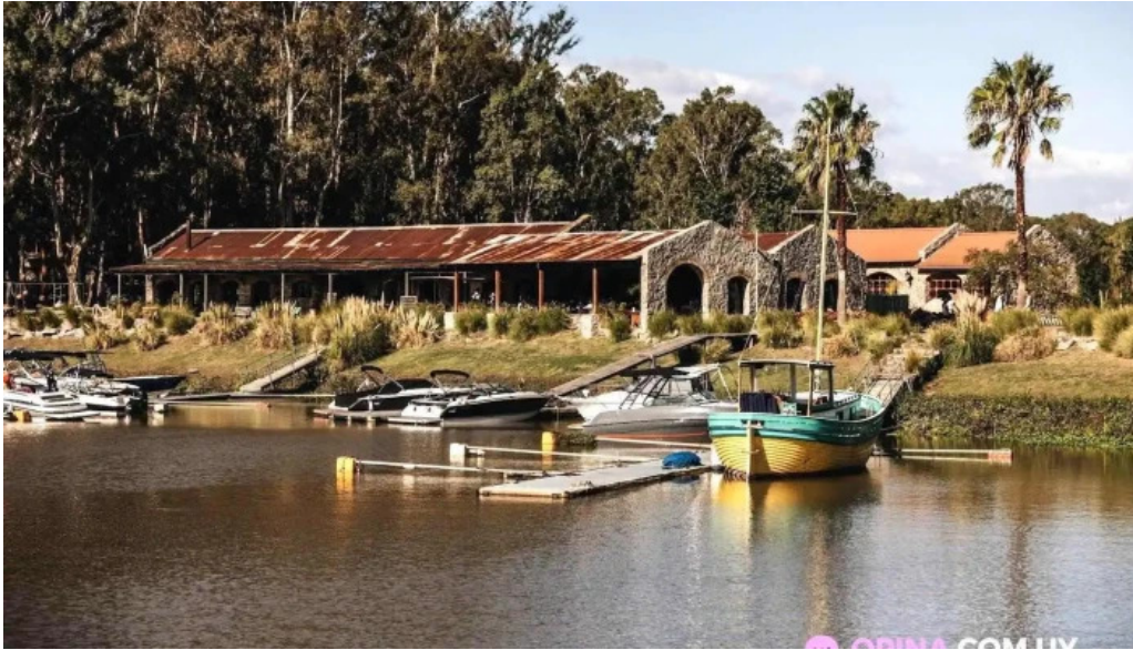
Basta pedro del propietario