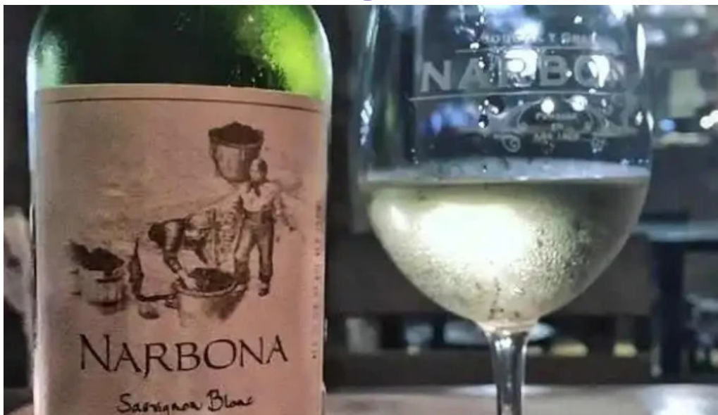
Basta pedro vino