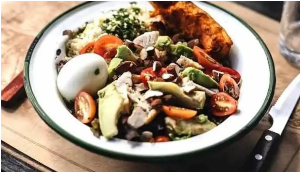
Basta pedro comida y bebida