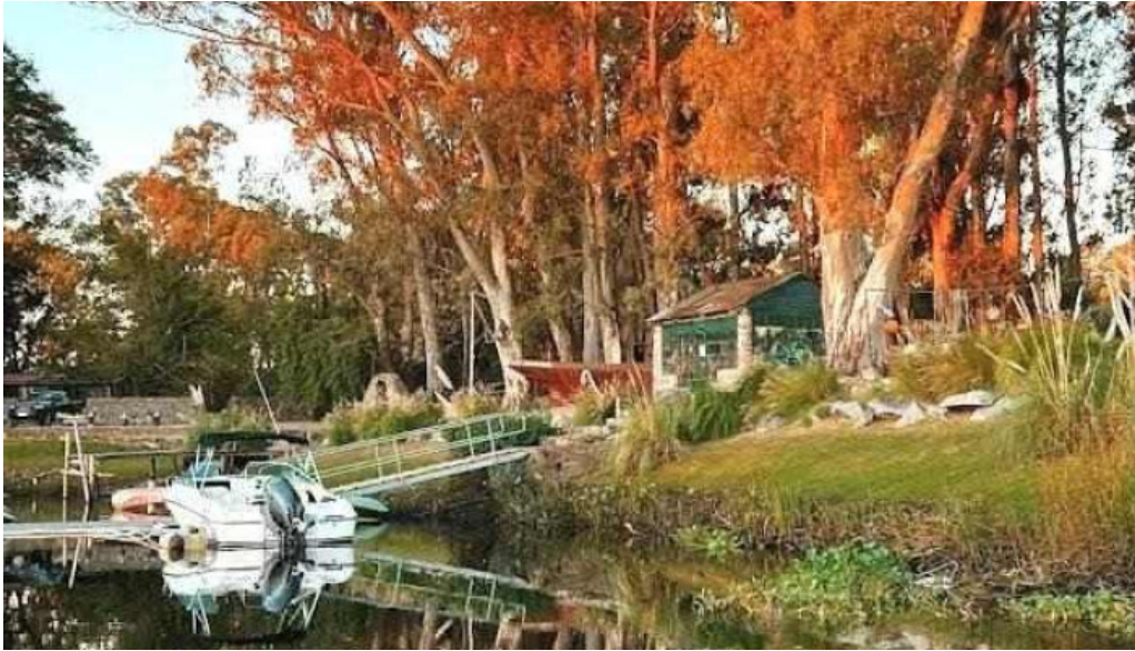
Basta pedro mas recientes