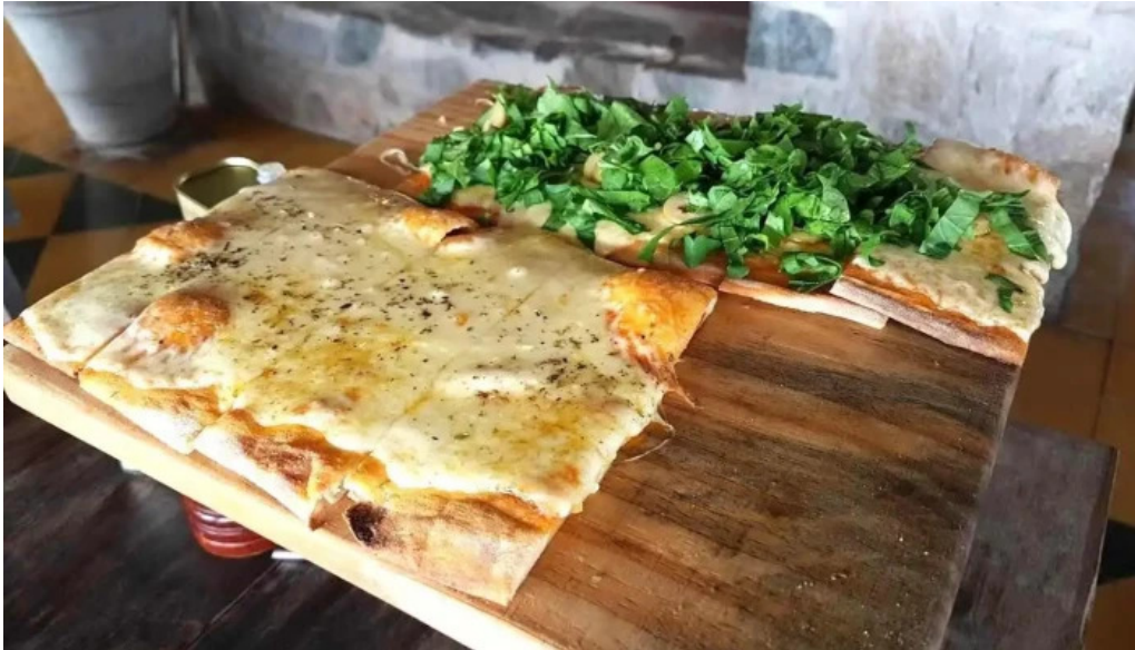
Basta pedro pan plano