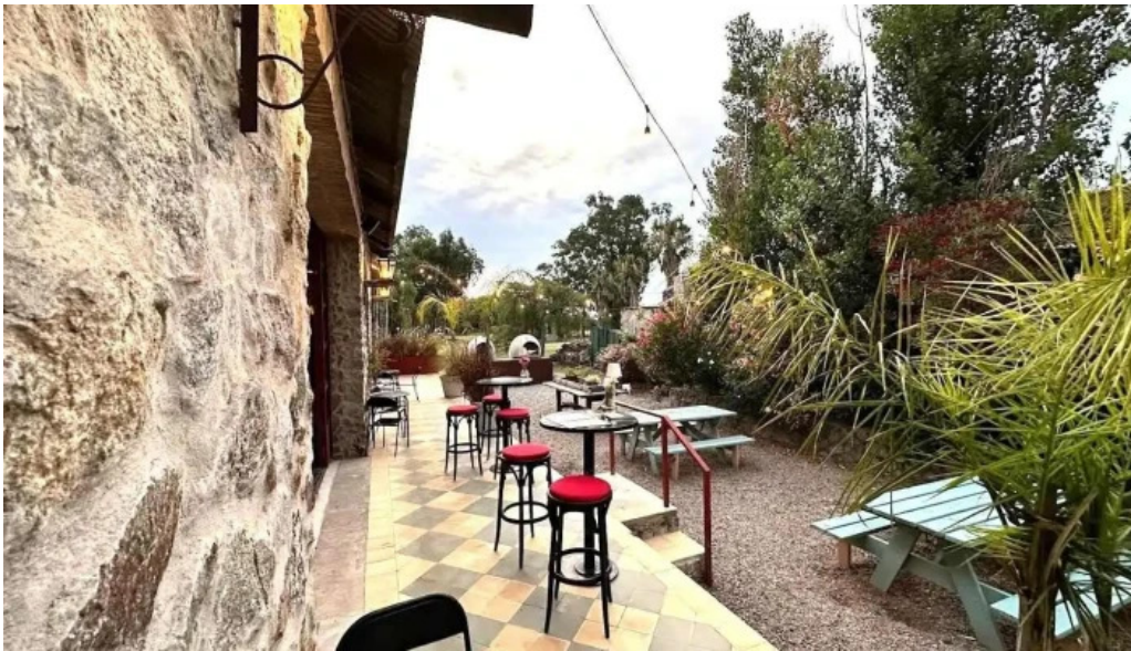
Basta pedro todas