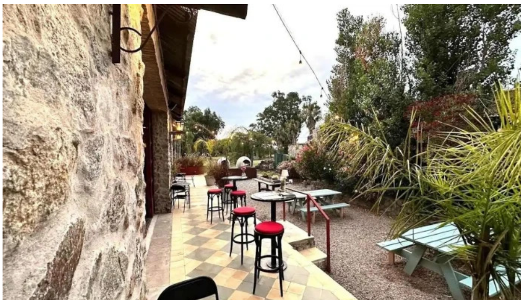
Basta pedro caramelo