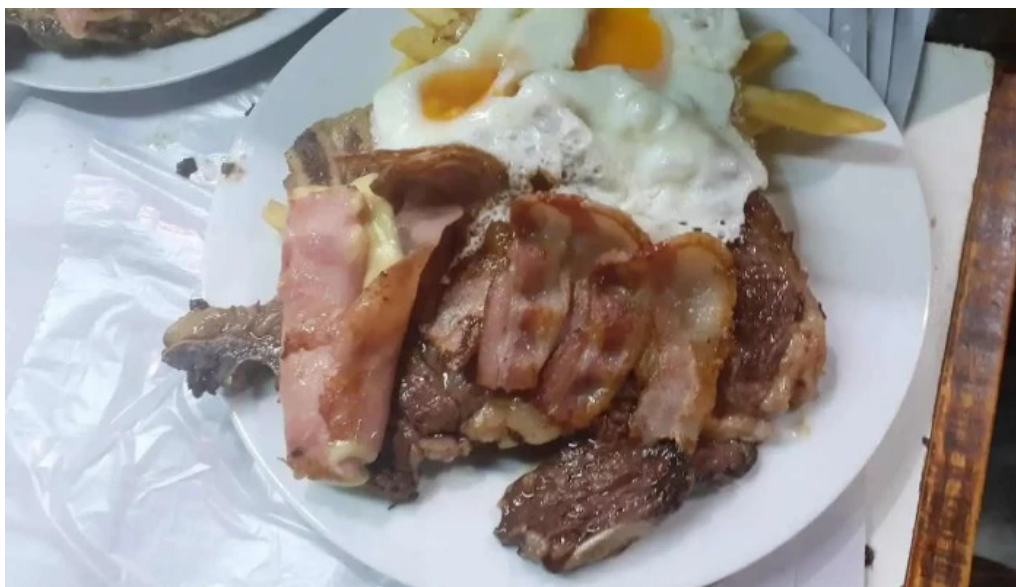
Barbacoa comida y bebida