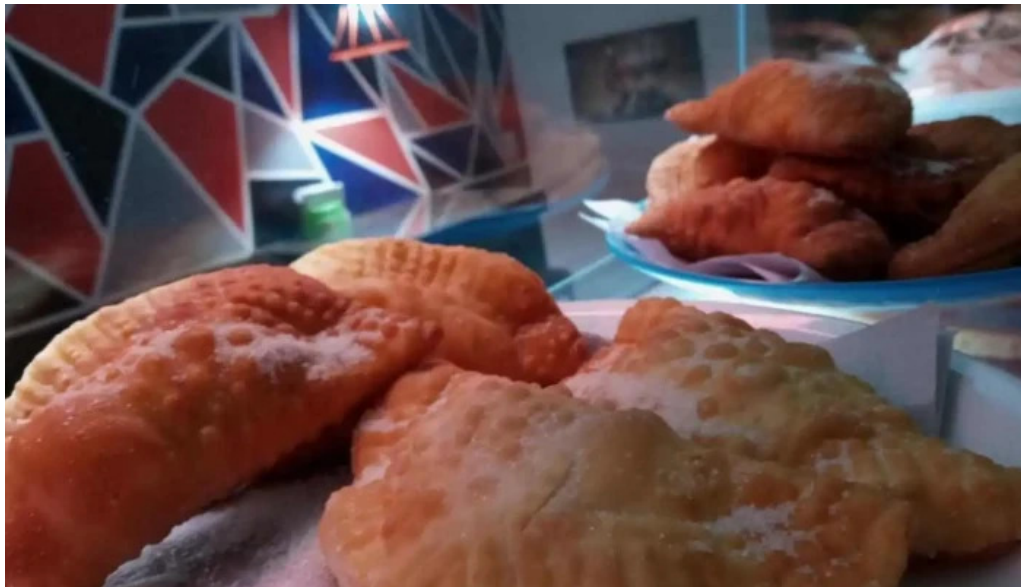
Barbacoa del propietario