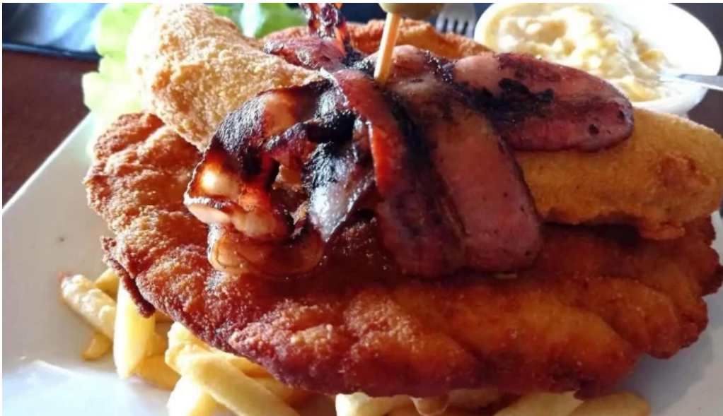
Bar mendizabal comida y bebida