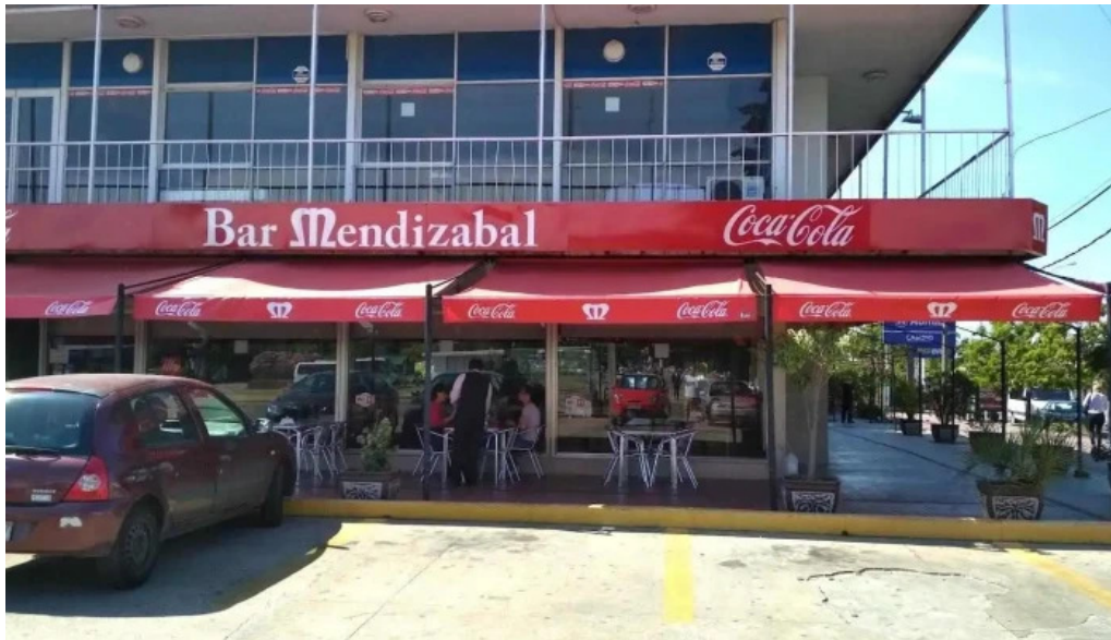
Bar mendizabal todas