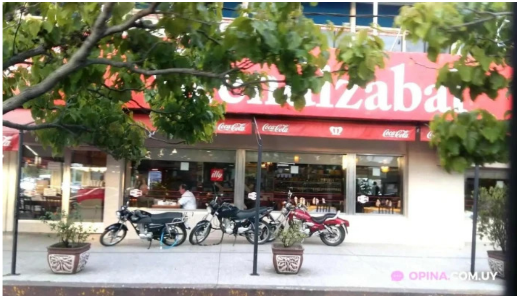
Bar mendizabal montevideo