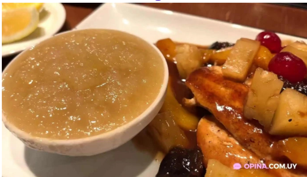
Bar mendizabal videos