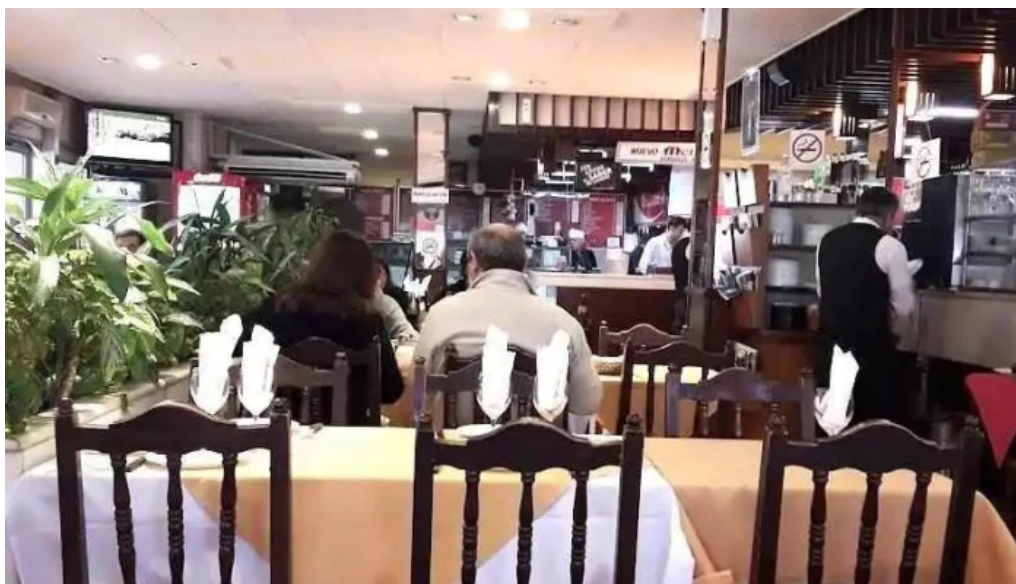
Bar mendizabal ambiente