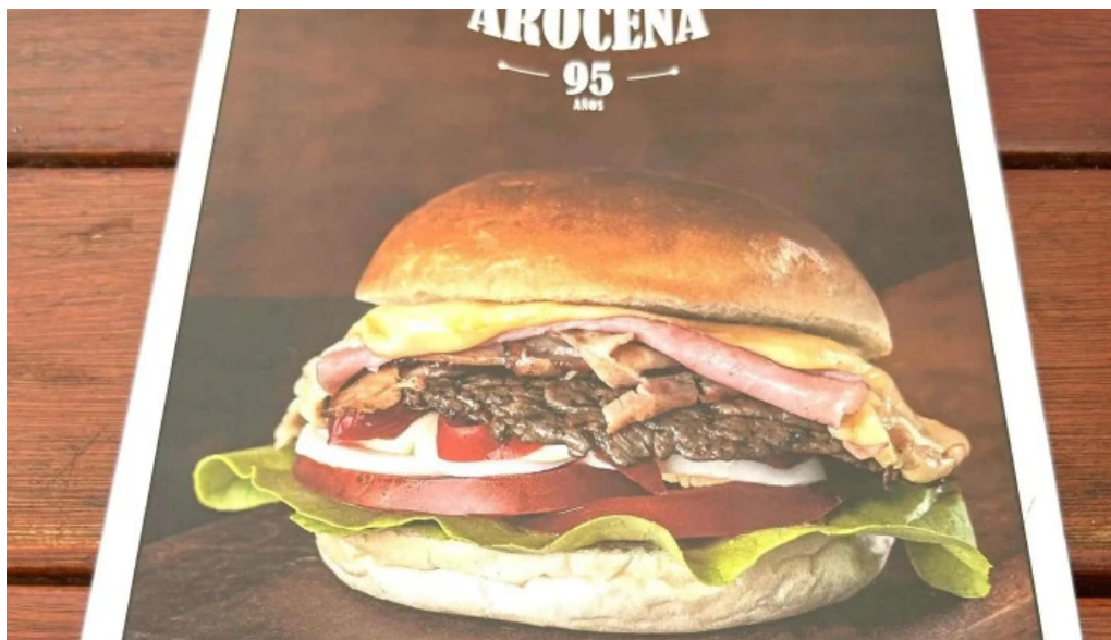
Bar arocena comentario 1