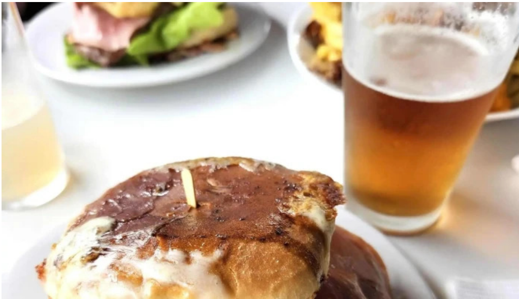
Bar arocena comentario 5