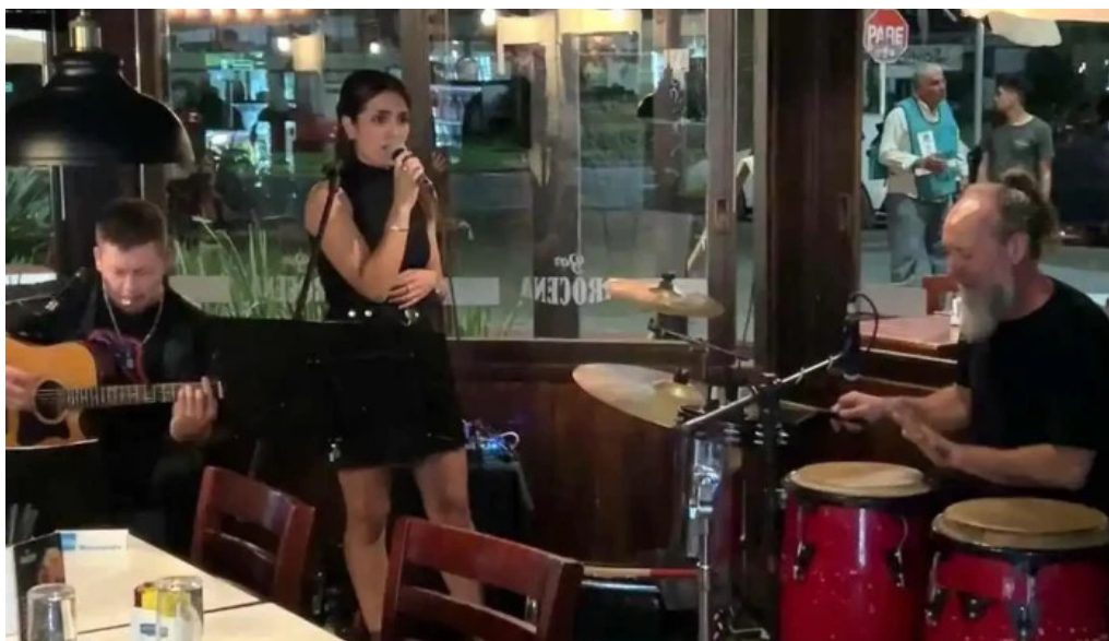
Bar arocena ambiente