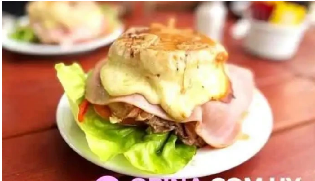
Bar arocena comidas y bebidas