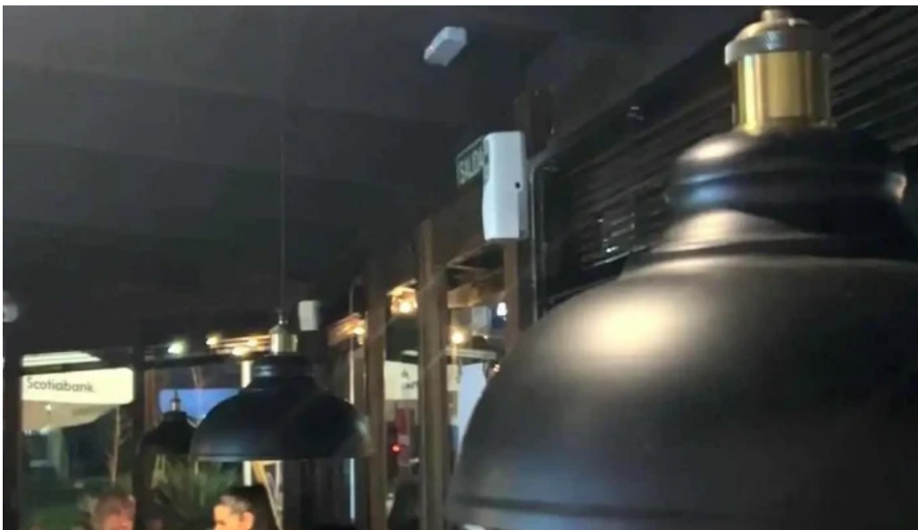
Bar arocena videos