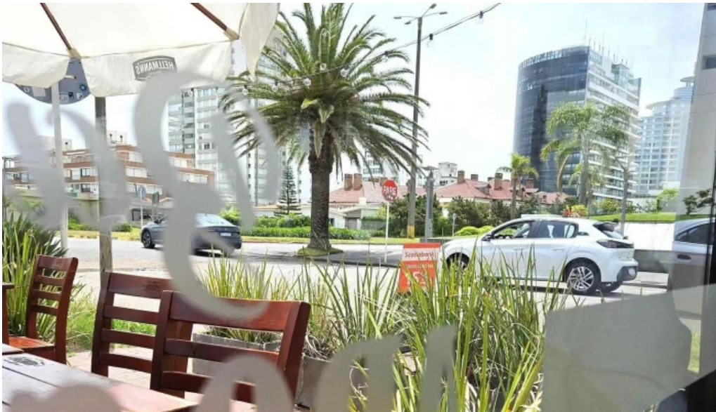
Bar arocena comentario 7