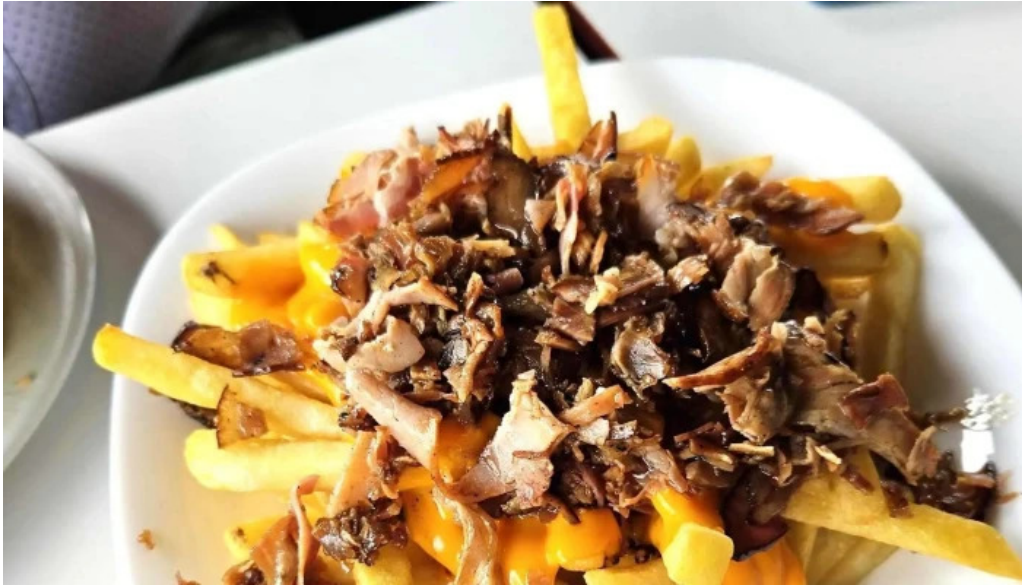
Bar arocena comentario 6