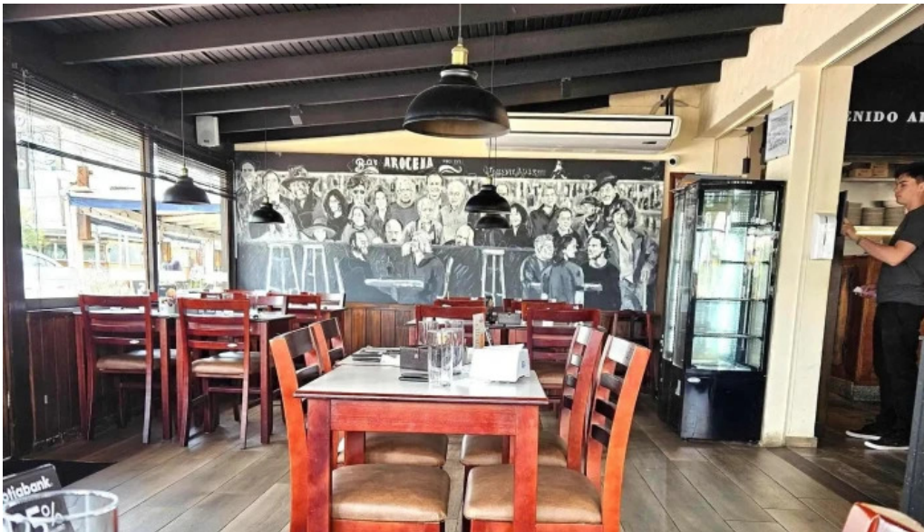
Bar arocena comentario 8