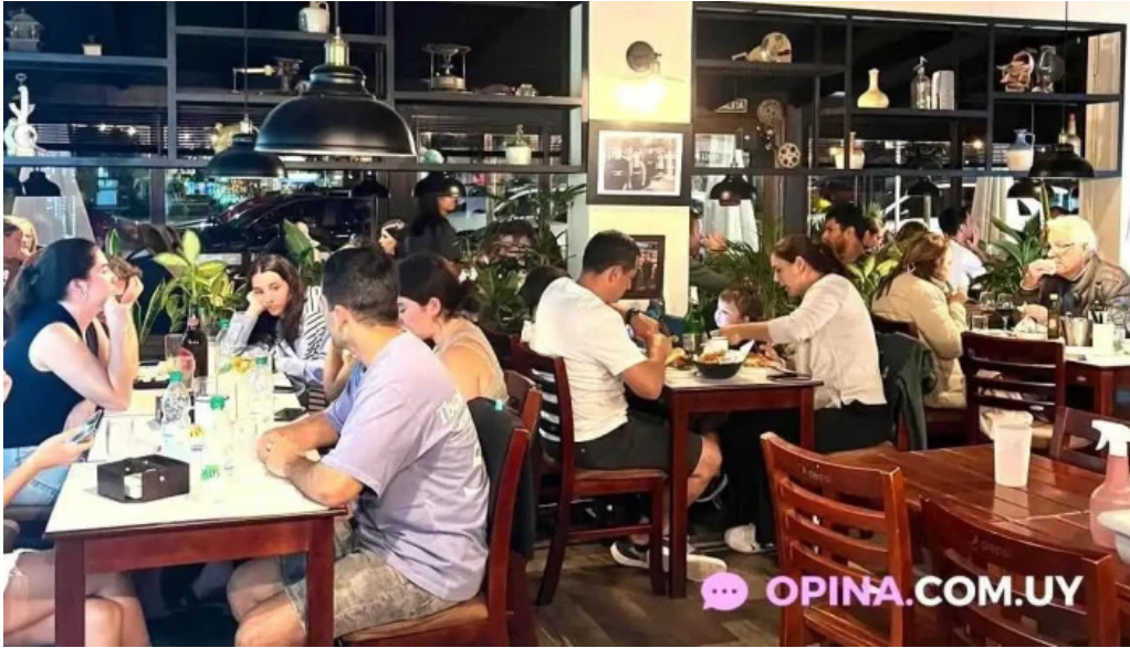
Bar arocena todo