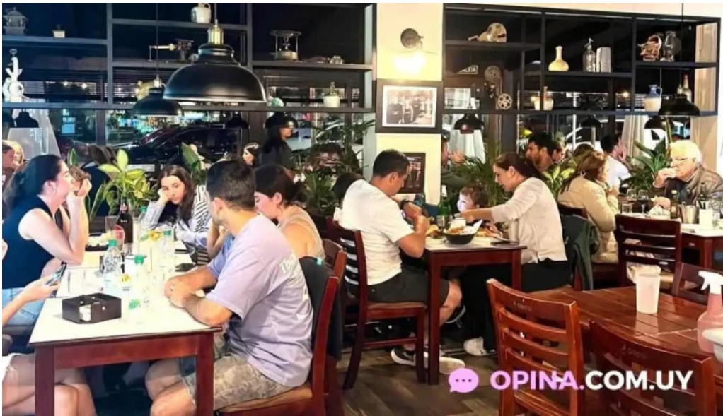
Bar arocena punta del este