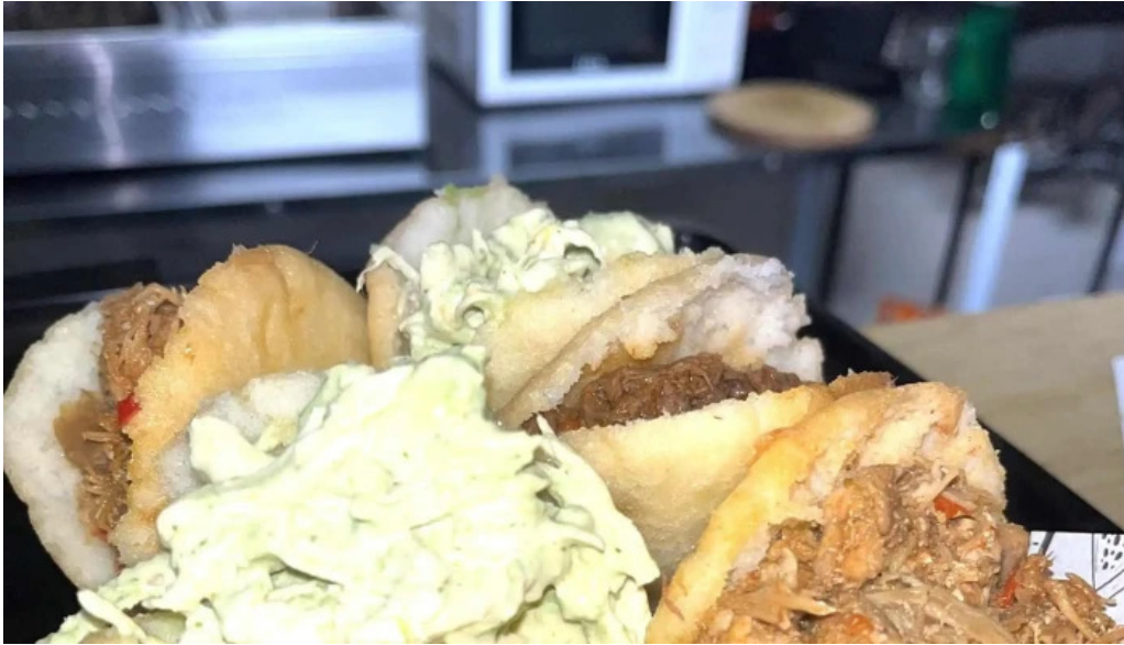
Araguaneys comida caribena atlantida comentario 4