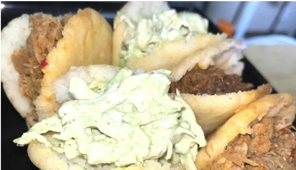
Araguaneys comida caribena atlantida comentario 3