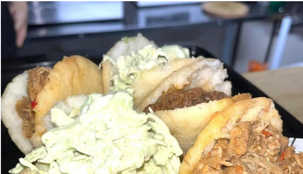
Araguany comida caribena atlantida comentario 5