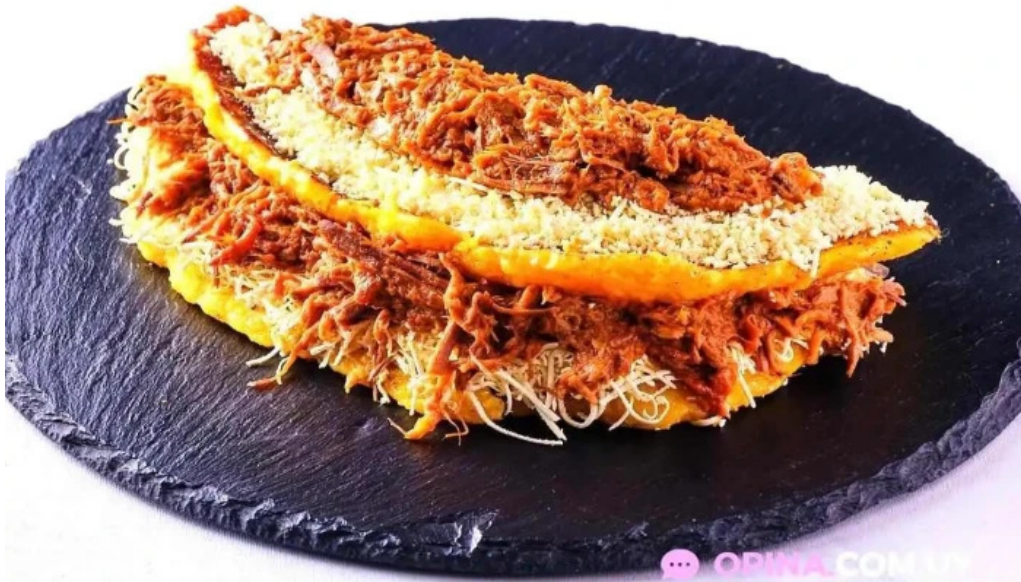
Araguaney comida caribena atlantida comidas y bebidas