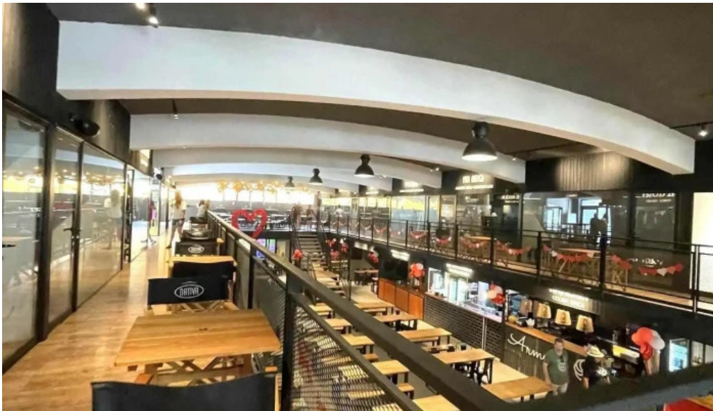
Araguaney comida caribena atlantida todo