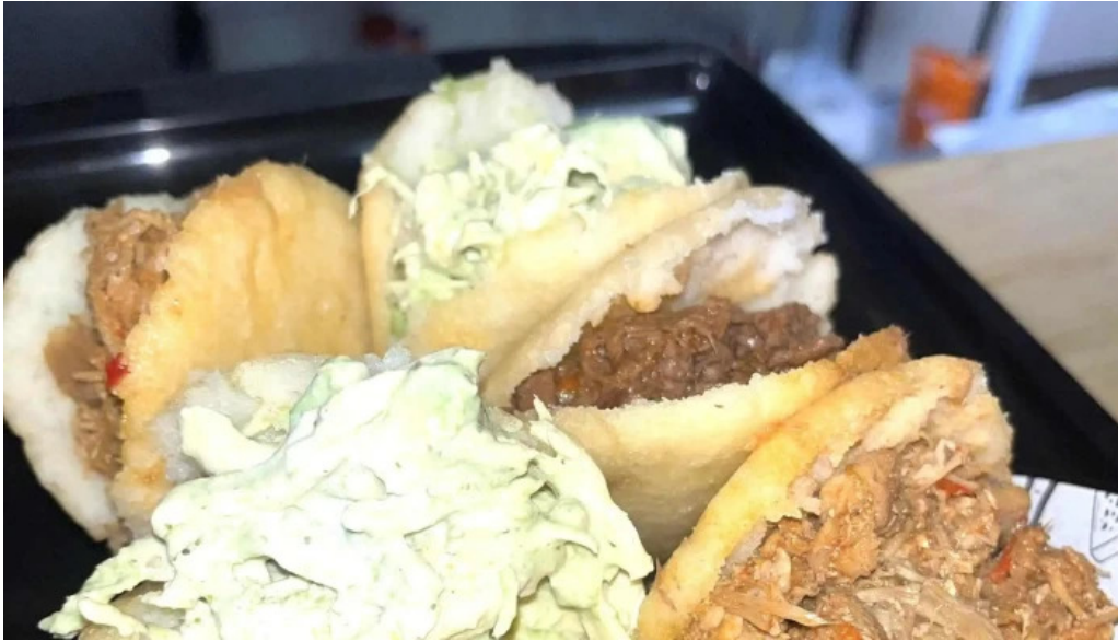
Araguaney comida caribena atlantida comentario 2