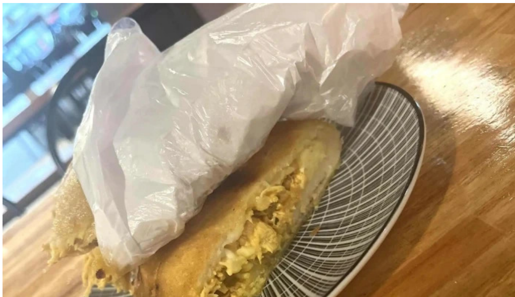
Araguaney comida caribena atlantida comentario 9