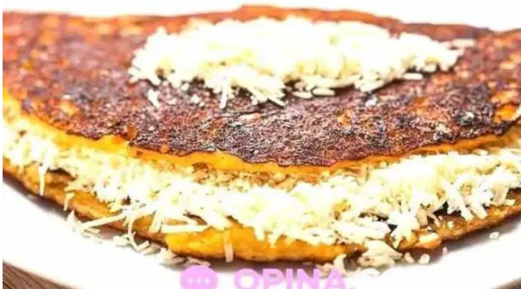
Araguaney comida caribena atlantida del propietario