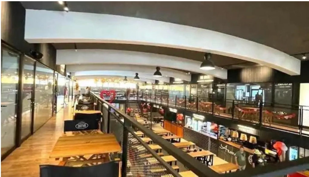
Araguany comida caribena atlantida atlantida