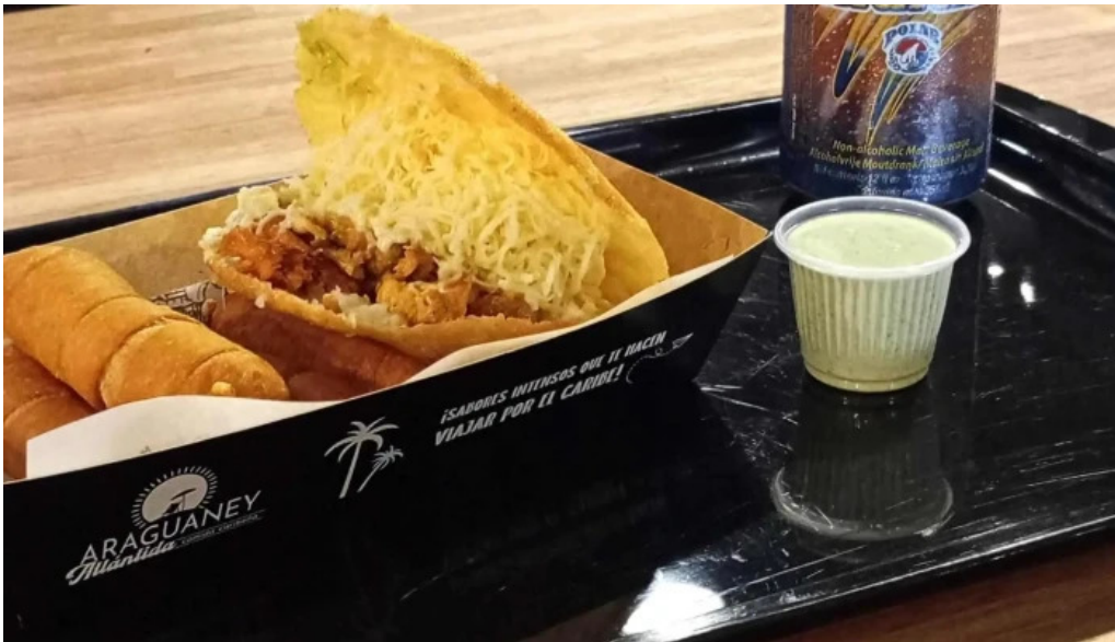
Araguany comida caribena atlantida comentario 7