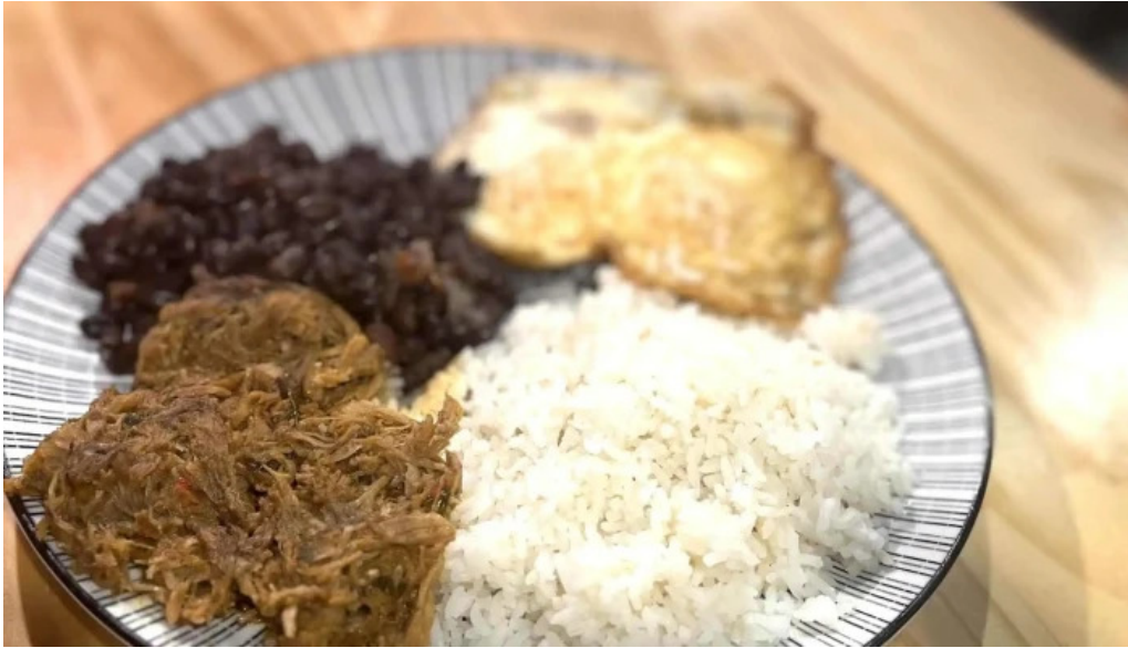
Araguany comida caribena atlantida comentario 8