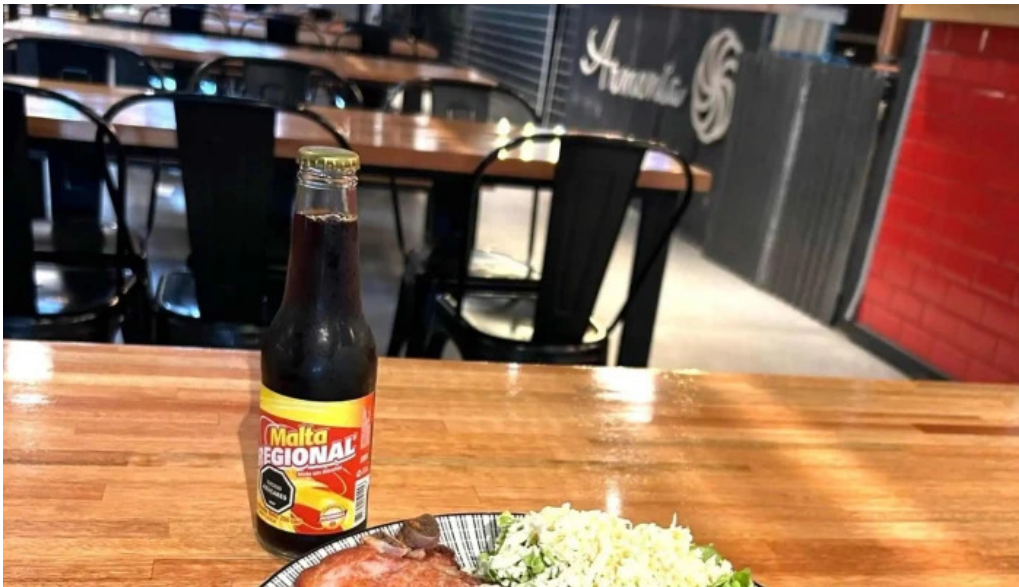
Araguany comida caribena atlantida comentario 6