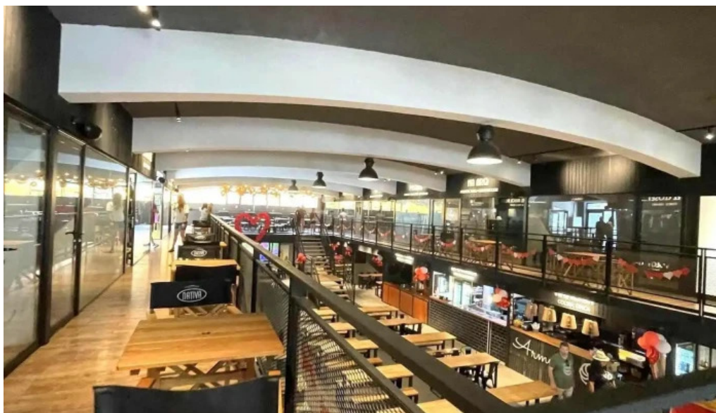
Araguaney comida caribena atlantida ambiente