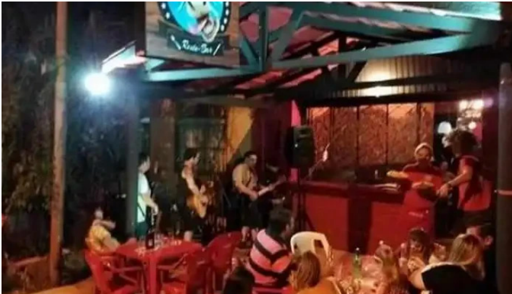
La vaca picada videos