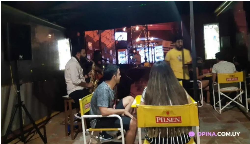
La vaca picada ambiente