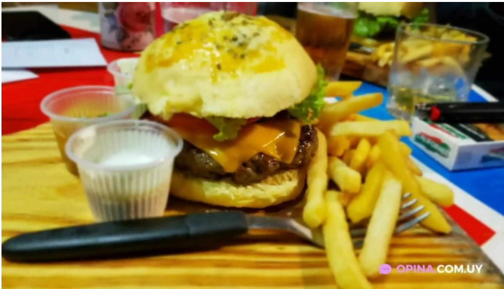
La vaca picada papas fritas