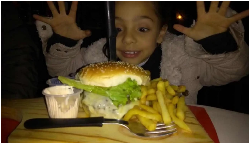
La vaca picada comida y bebida