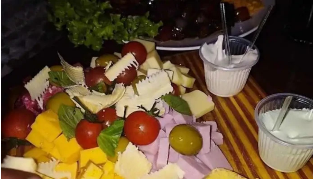
La vaca picada artigas