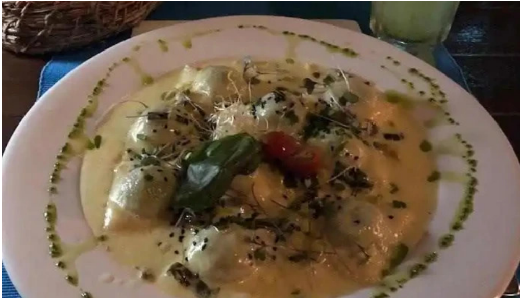
Araza resto ravioli