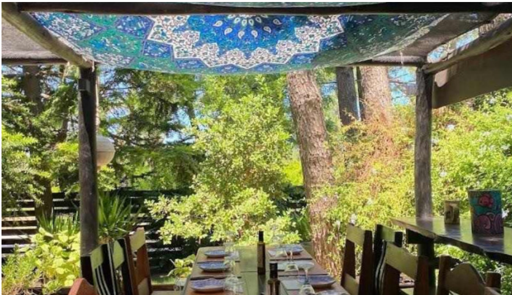
Araza resto ambiente