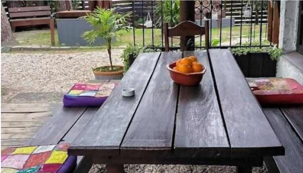
Araza resto ciudad de la costa