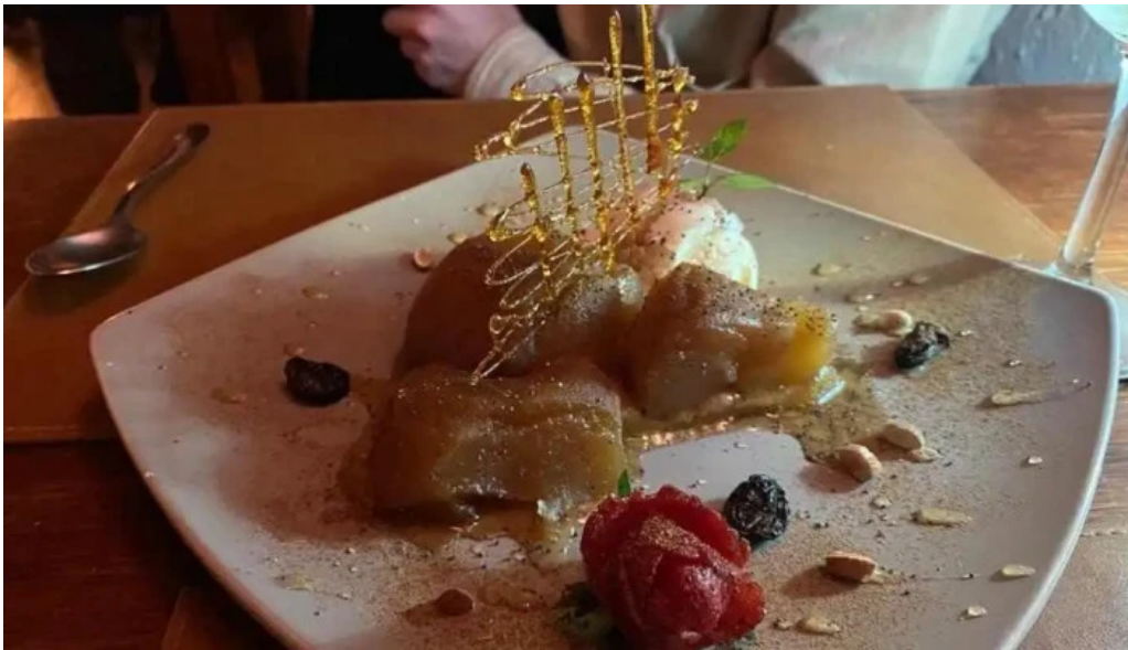
Araza resto tarta tatin