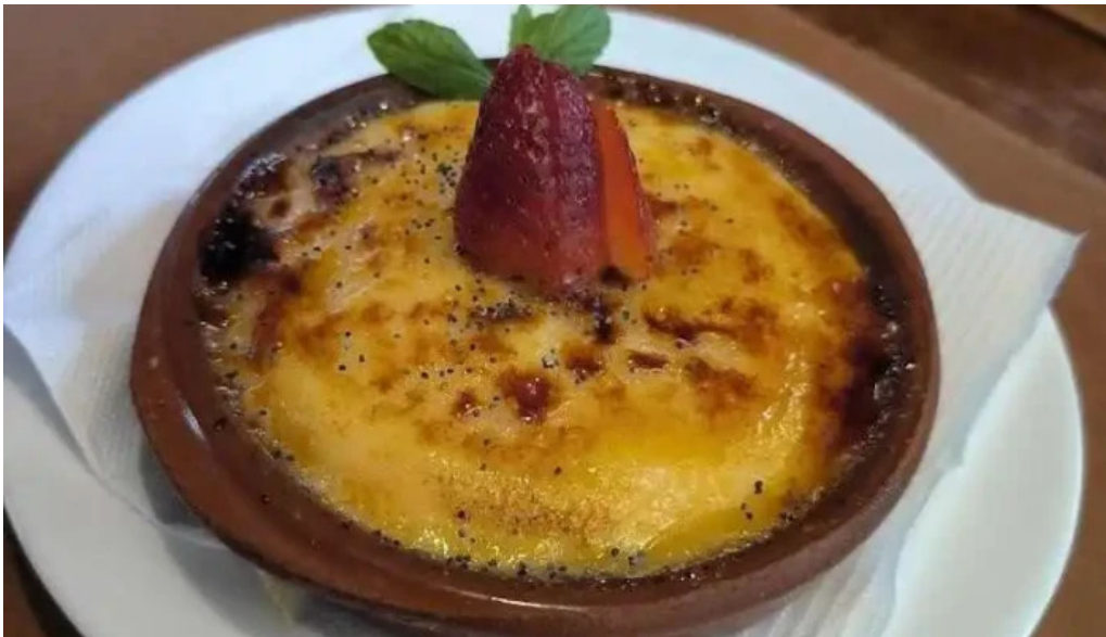
Araza resto comida y bebida