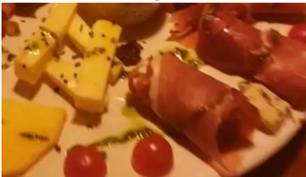
Araza resto videos