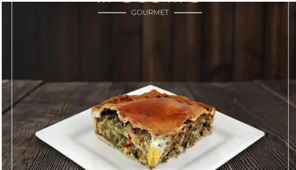
Apolonio del propietario