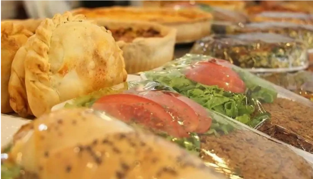
Apolonio comida y bebida