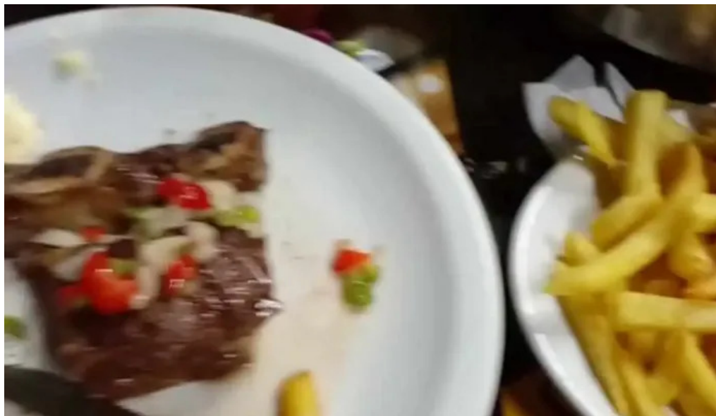
Americano mas recientes