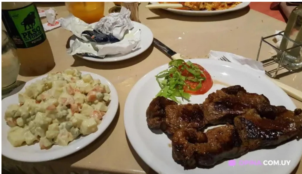
Americano comida y bebida