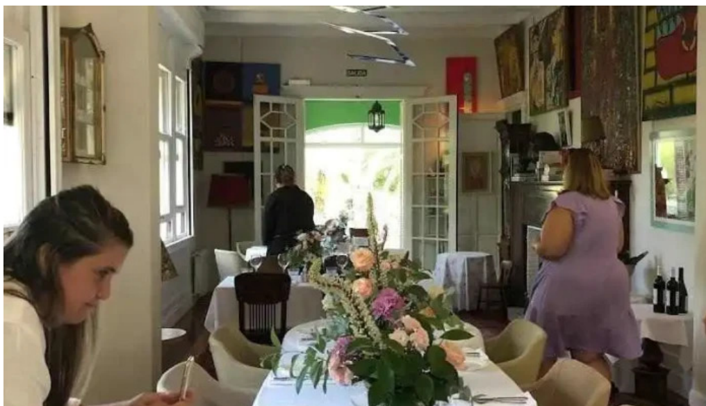
Alquimista restaurante ambiente