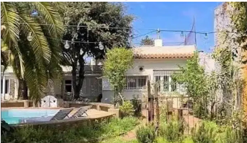
Alquimista restaurante videos