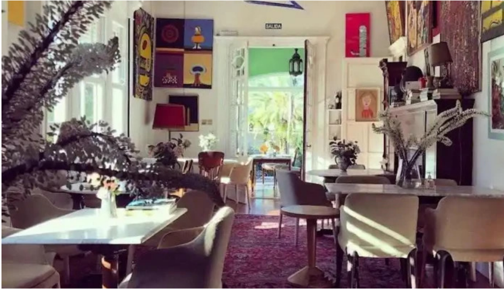
Alquimista restaurante todas