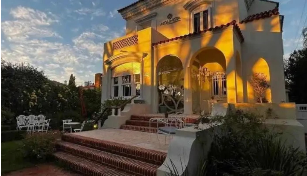
Alquimista restaurante del propietario