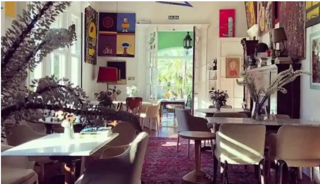
Alquimista restaurante montevideo