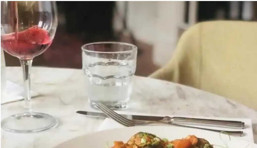
Alquimista restaurante comida y bebida