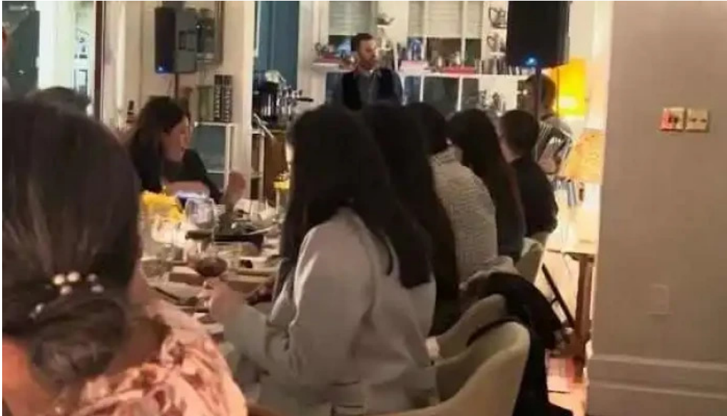
Alquimista restaurante mas recientes