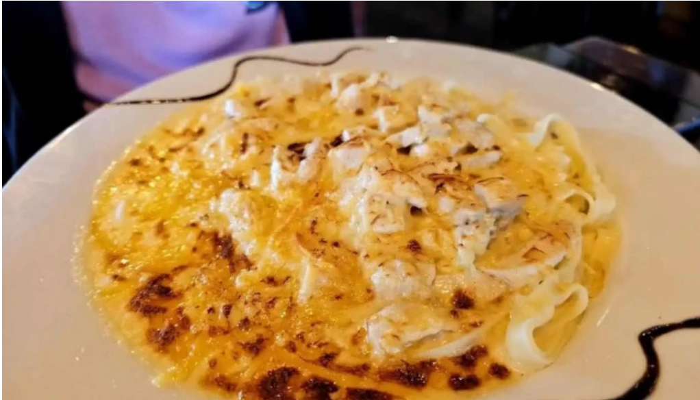
Albertos mas recientes