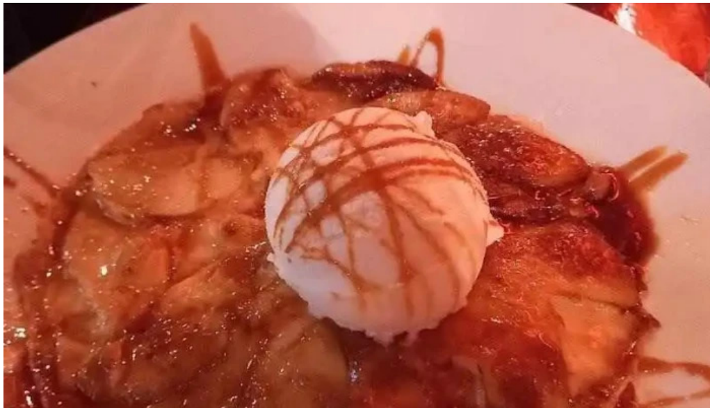
Albertos tarta de manzana