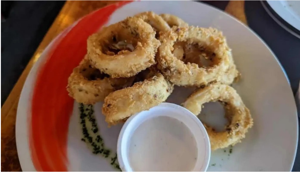
Albertos comida y bebida