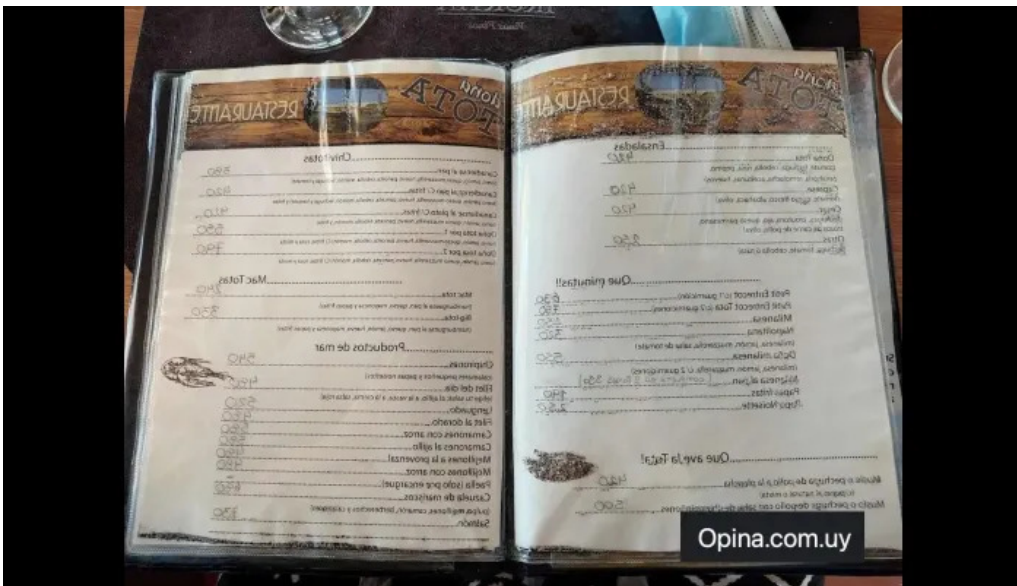
Restaurant dona tota menu