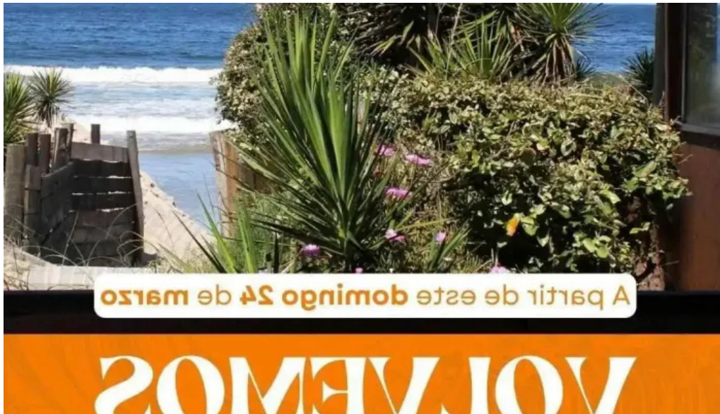
Restaurant dona tota del propietario