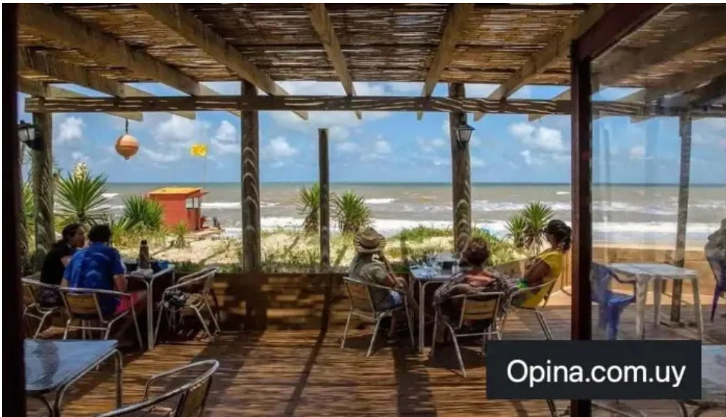
Restaurant dona tota todas