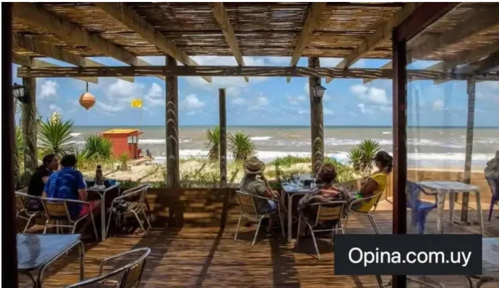
Restaurant dona tota