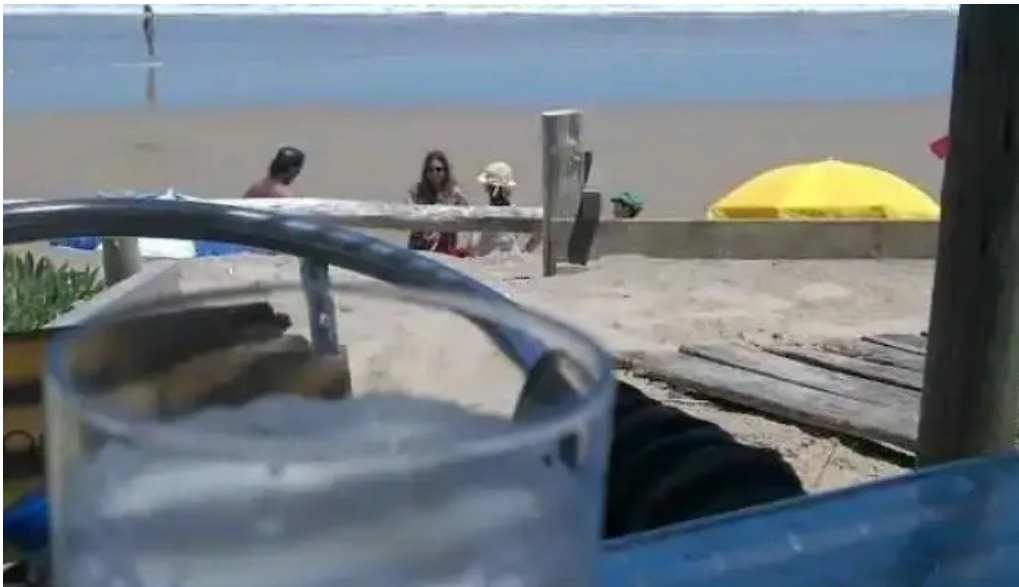
Restaurant dona tota comida y bebida