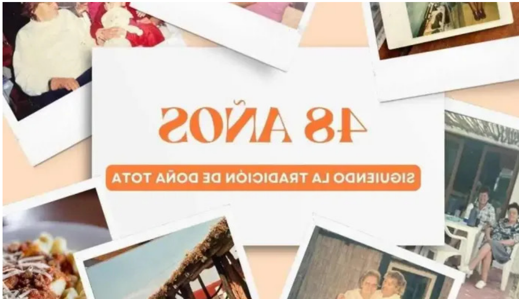
Restaurant dona tota mas recientes