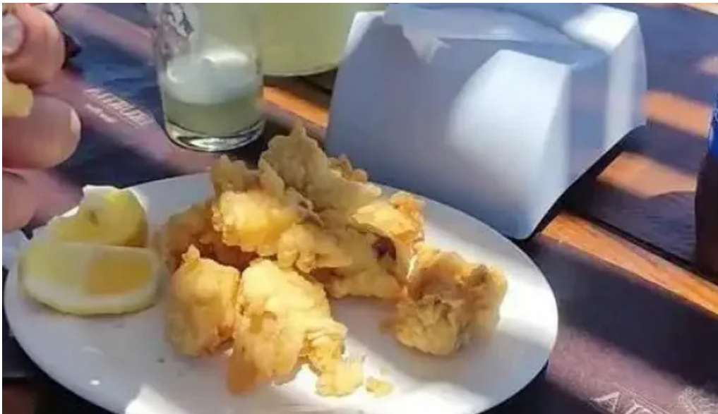
Restaurant dona tota videos