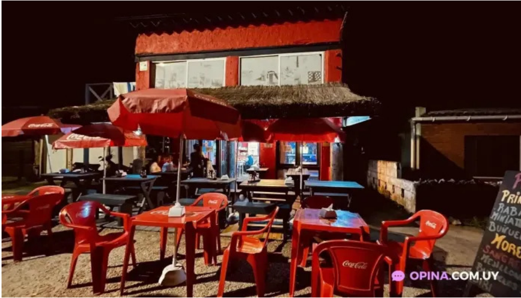
Lo del maestro