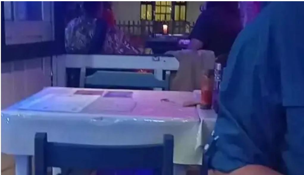
Lo del maestro videos