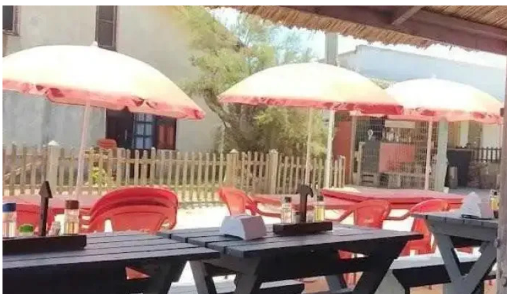
Lo del maestro ambiente