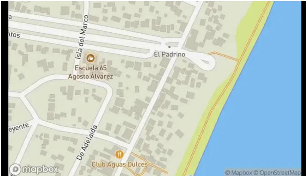
Lo del maestro mapa