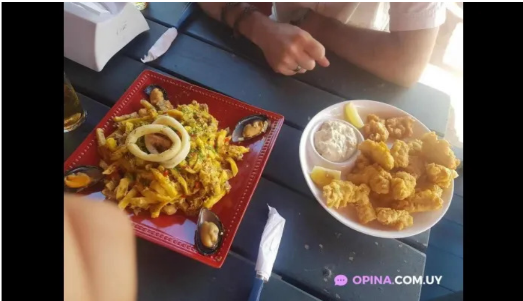
Lo del maestro papas fritas