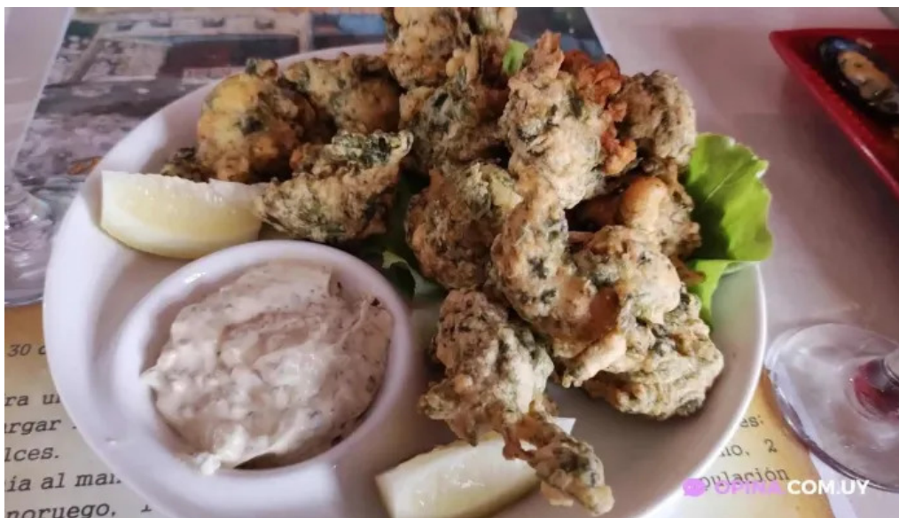
Lo del maestro comida y bebida