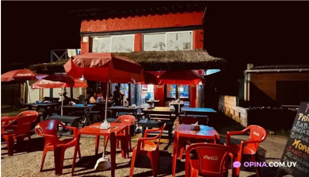
Lo del maestro todas