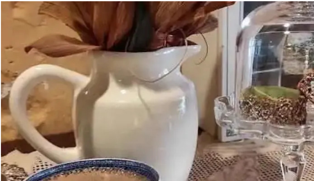
El gallinero comida y bebida