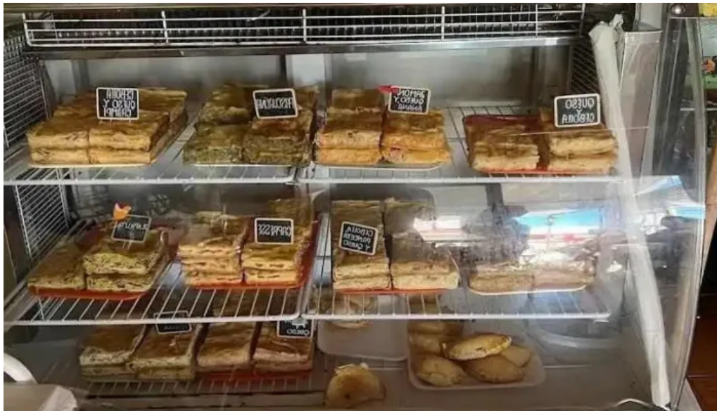
El gallinero ambiente