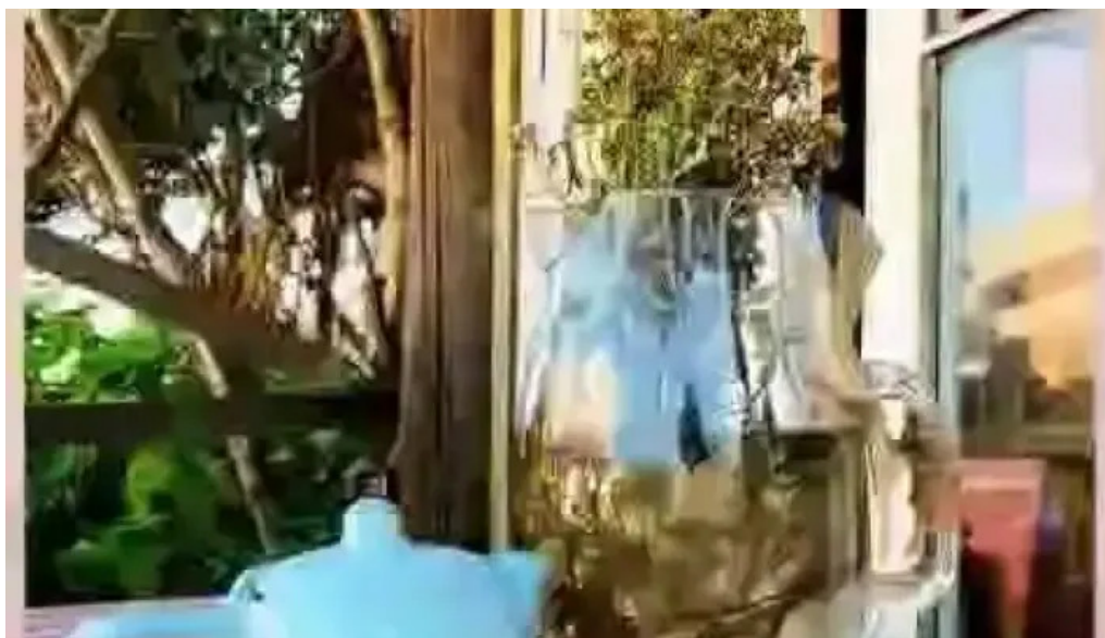
El gallinero videos