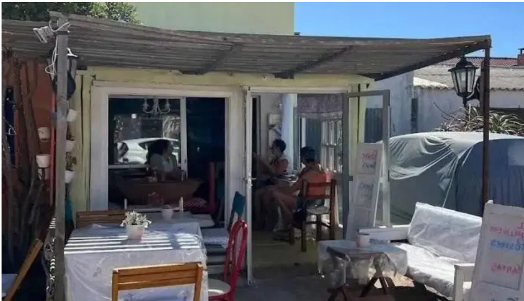
El gallinero todas