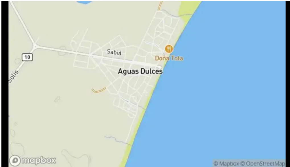
El gallinero mapa