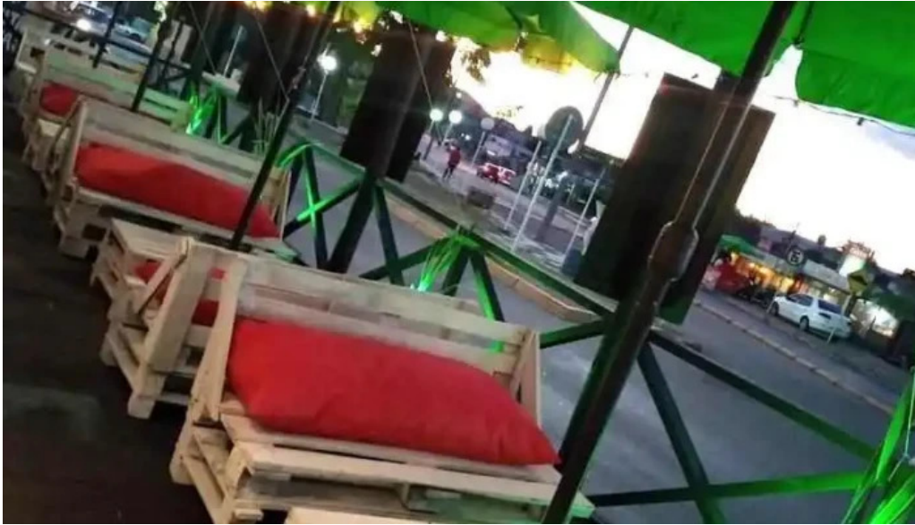
Agora del propietario