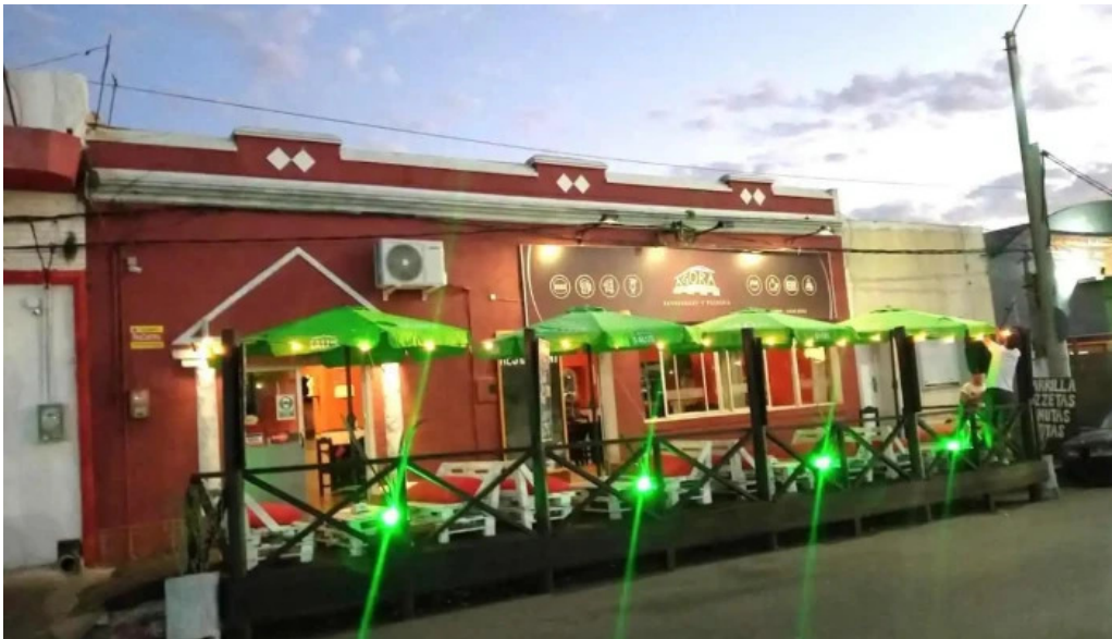
Agora pan de azucar