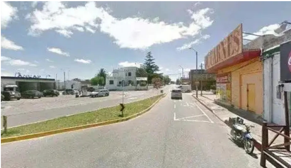
Agora street view y 360