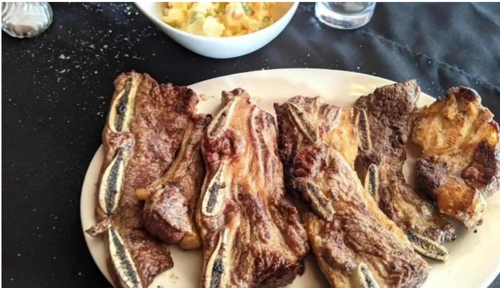
Agora comida y bebida