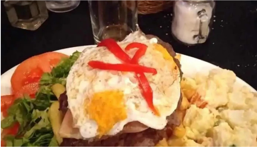
Agora papas fritas