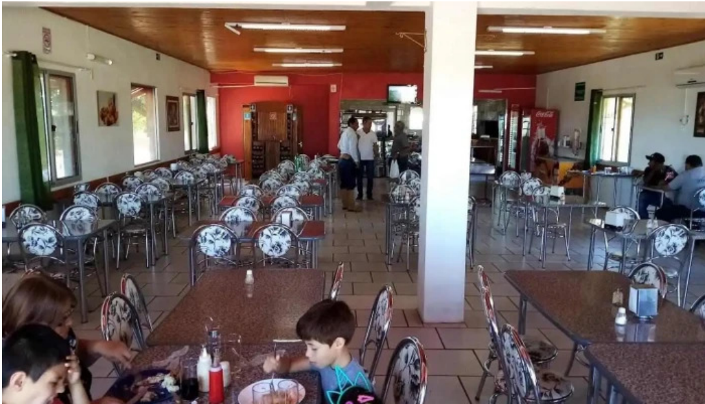
Restaurant vitom ambiente