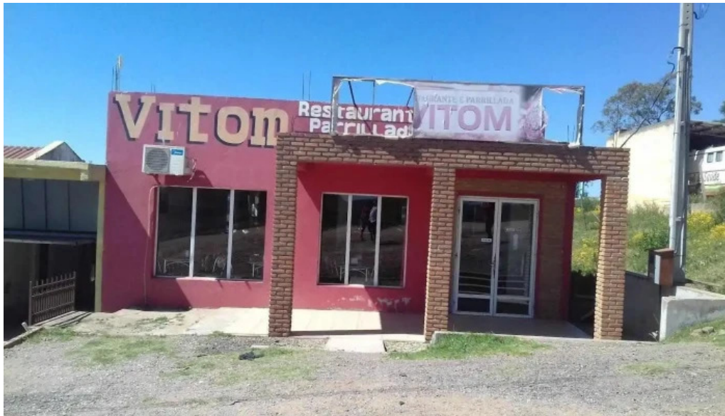
Restaurant vitom acegua