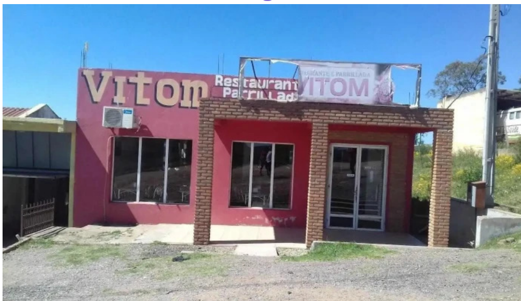
Restaurant vitom todas