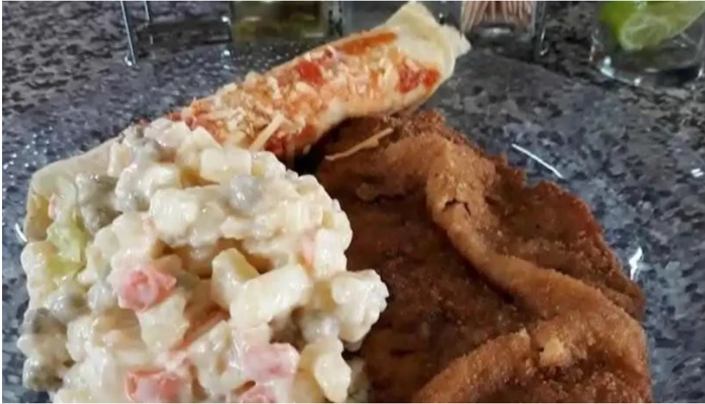
Restaurant vitom comida y bebida