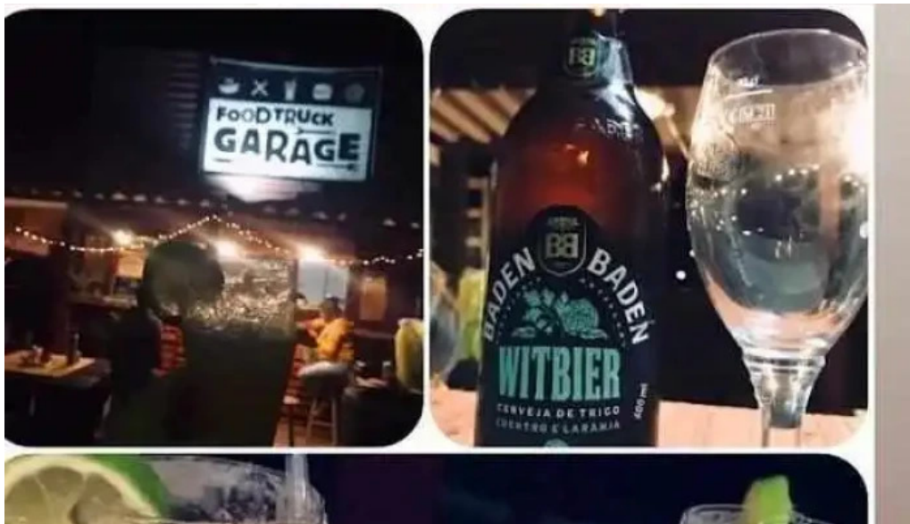
Garage food truck del propietario