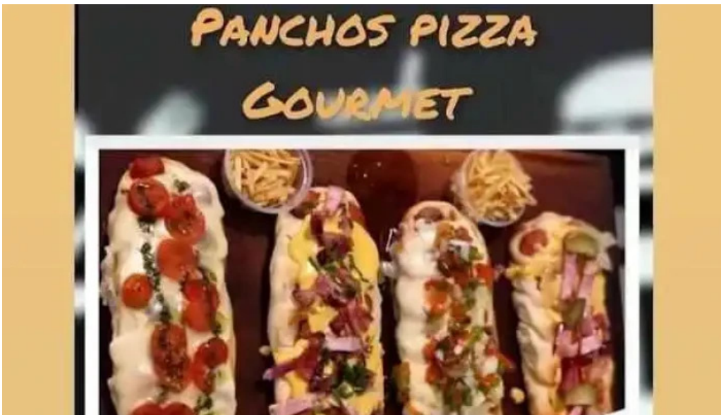
Garage food truck menu