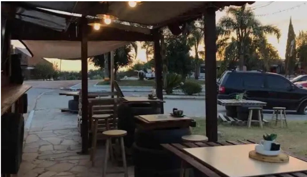
Garage food truck acegua