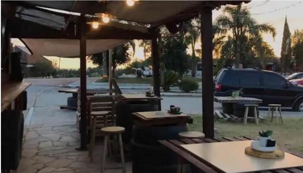
Garage food truck todas