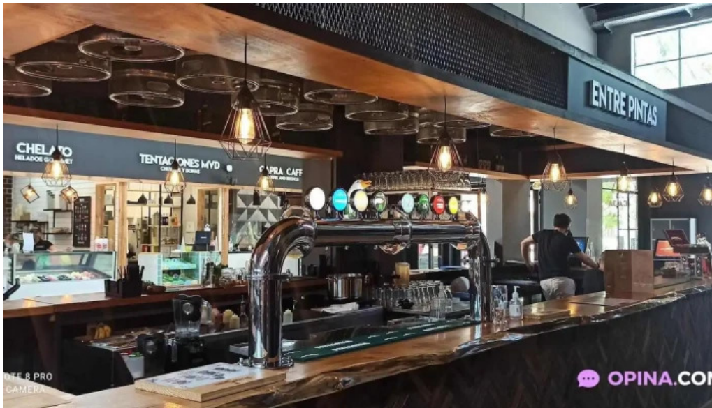
A l a b a m a ambiente