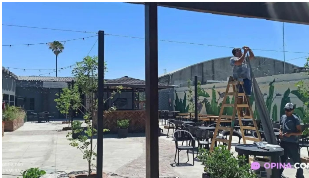
A l a b a m a todas