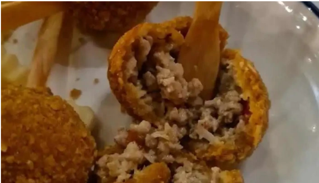
A l a b a m a comida y bebida