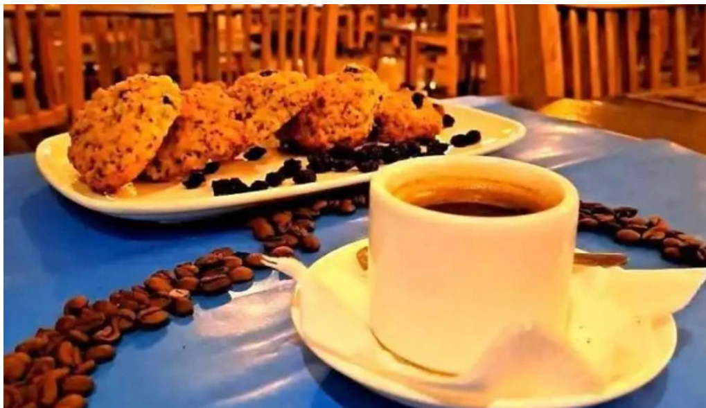
508 resto cafe comida y bebida