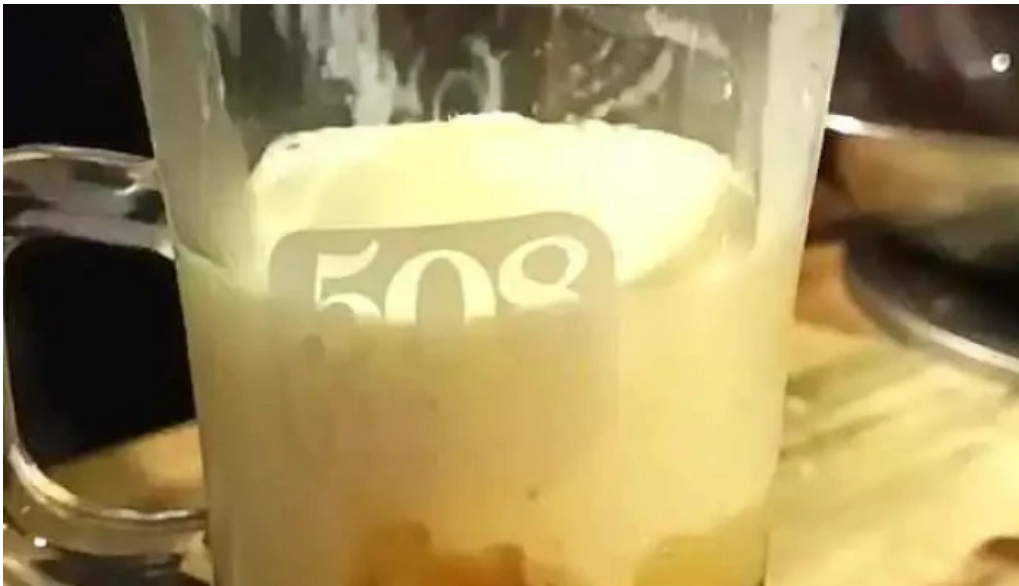
508 resto cafe videos