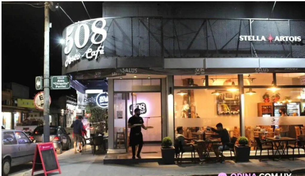
508 resto cafe Carmelo