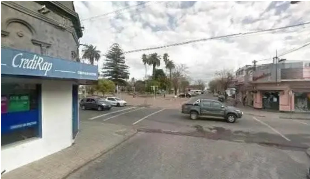
508 resto cafe street view y 360