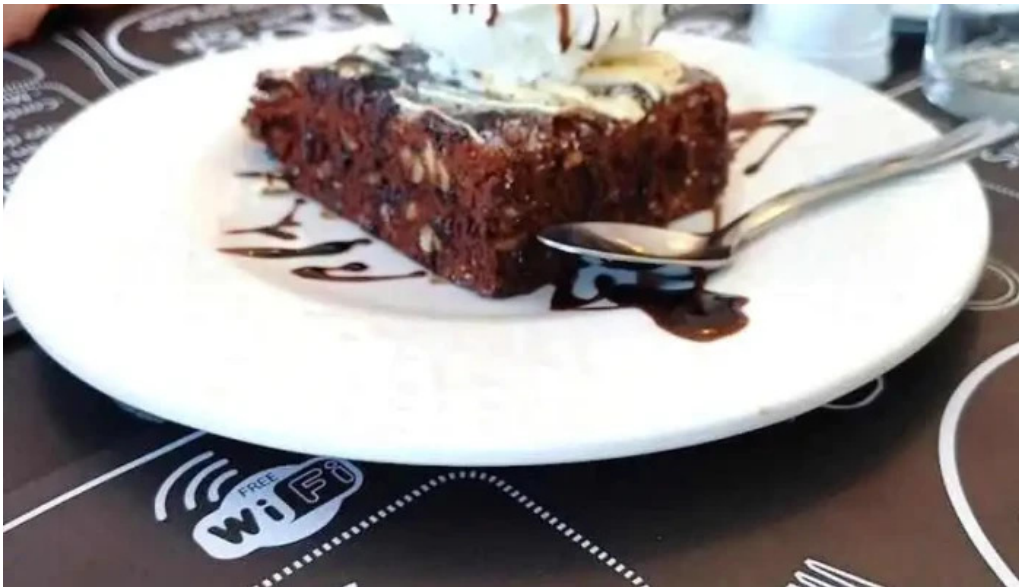
508 resto cafe mas recientes