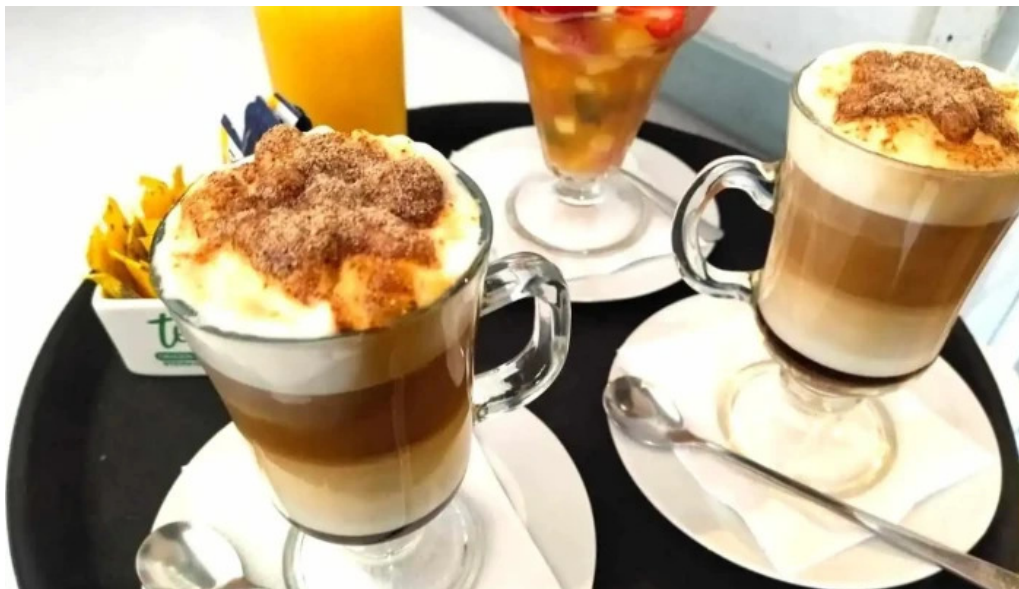
508 resto cafe capuchino