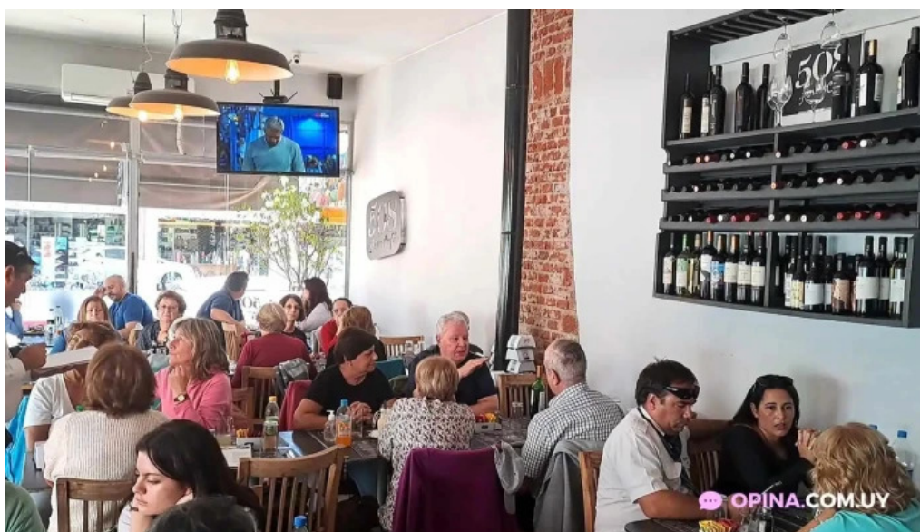
508 resto cafe ambiente