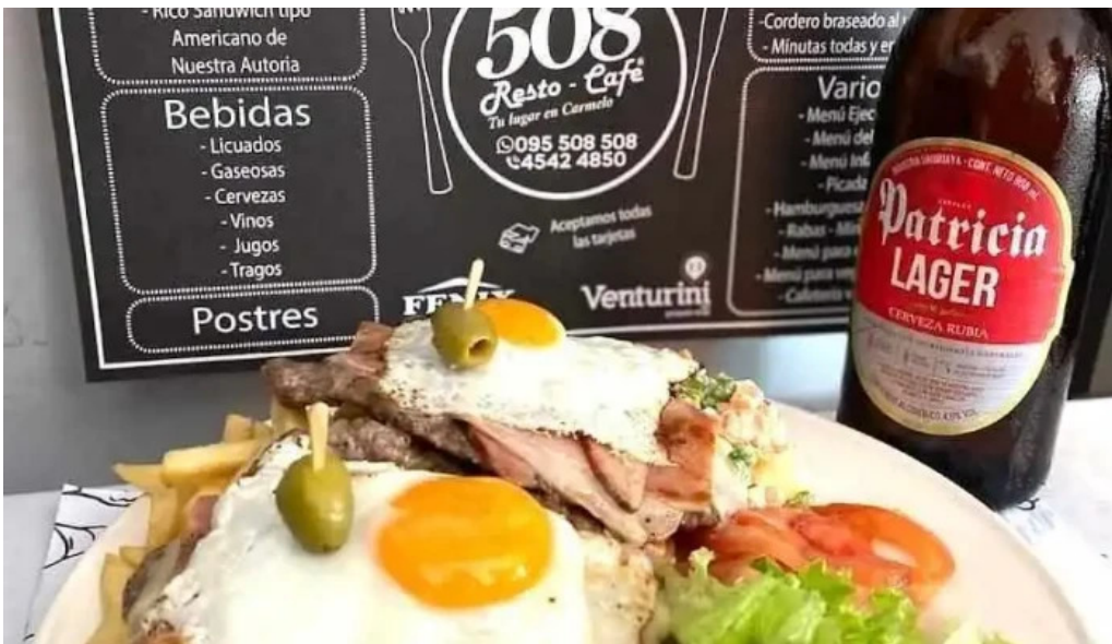
508 resto cafe menu