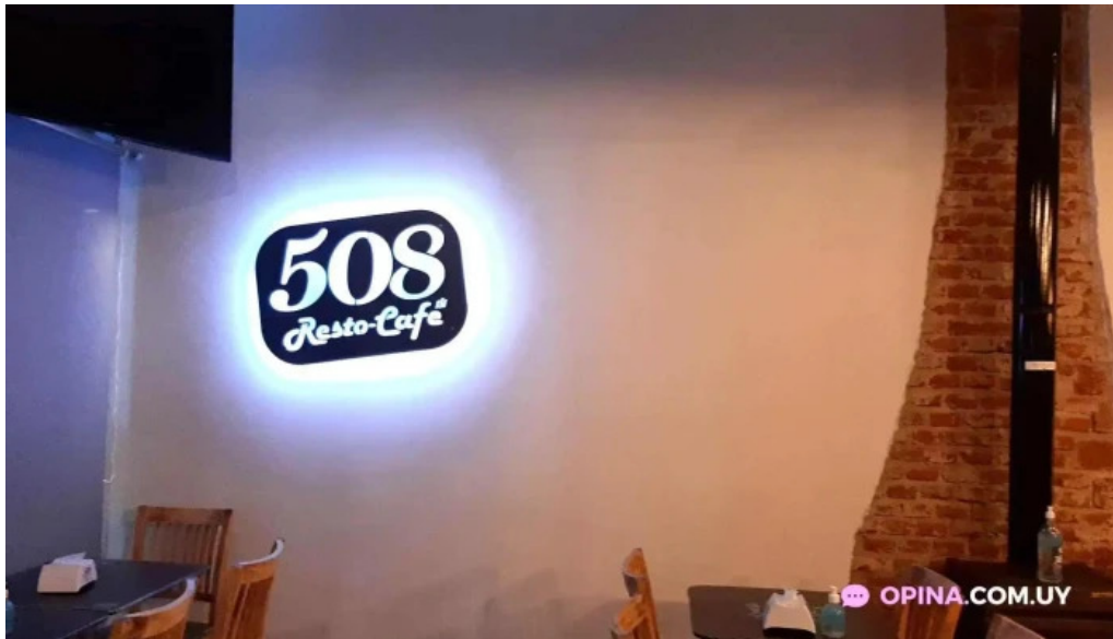
508 resto cafe del propietario