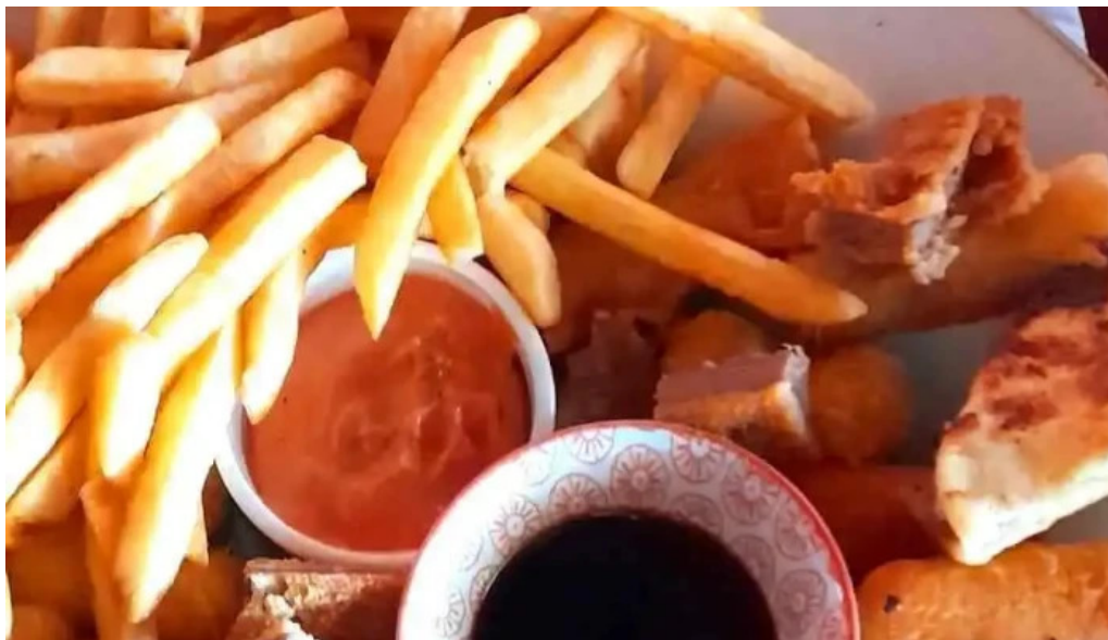
24 hs degustar comidas y bebidas