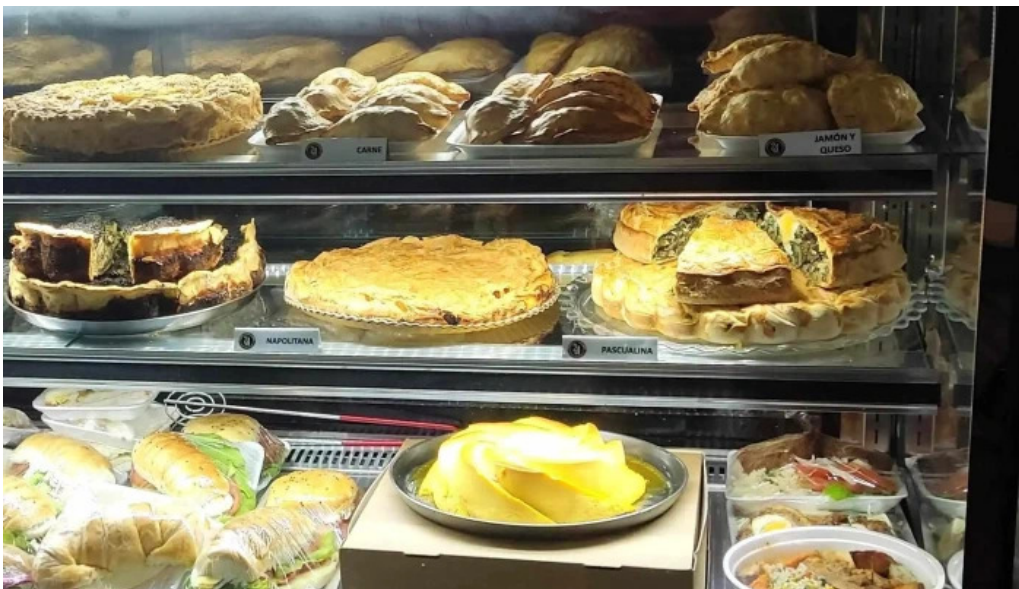
24 hs degustar comentario 2