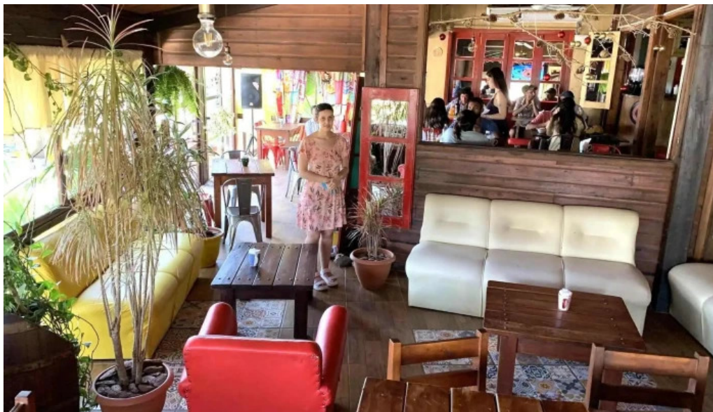
24 hs degustar ambiente