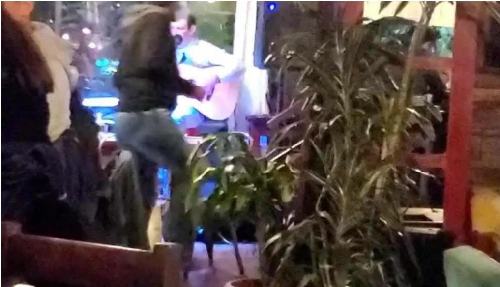
24 hs degustar videos