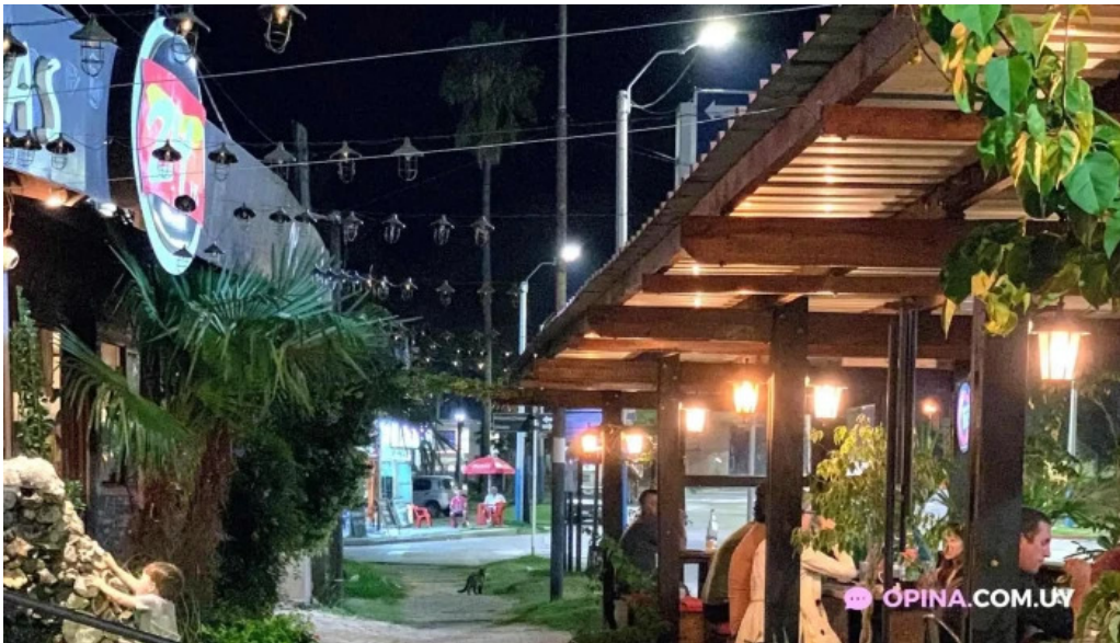
24 hs degustar tacuarembó