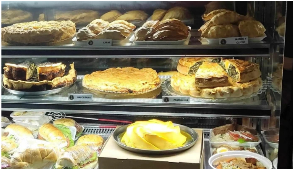
24 hs degustar comentario 7