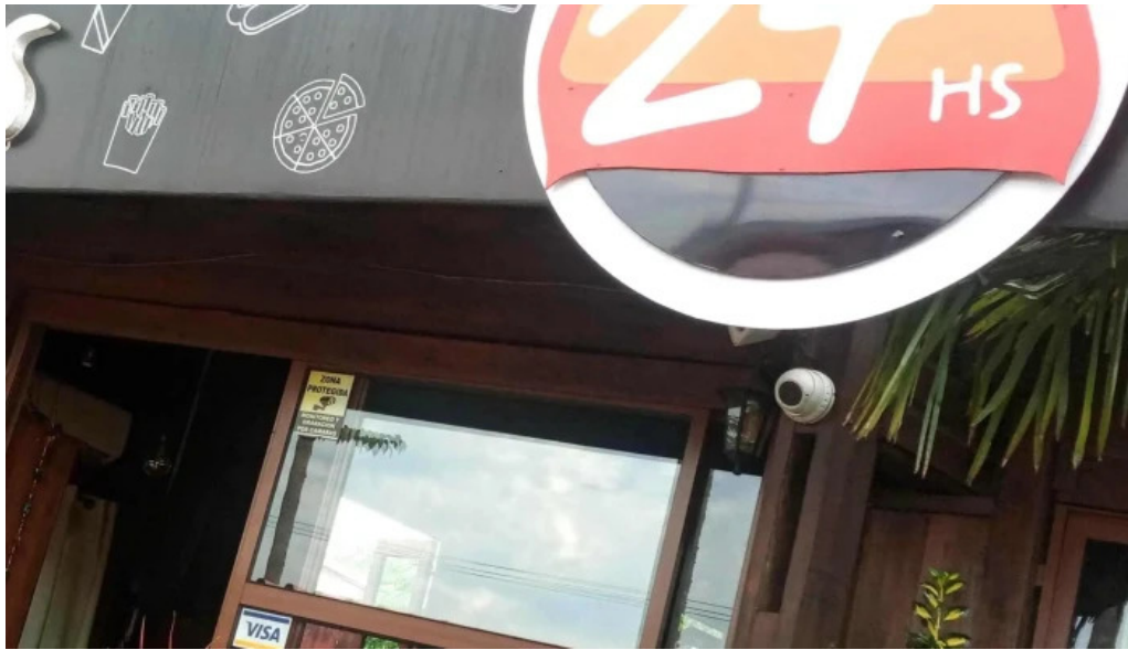
24 hs degustar comentario 5