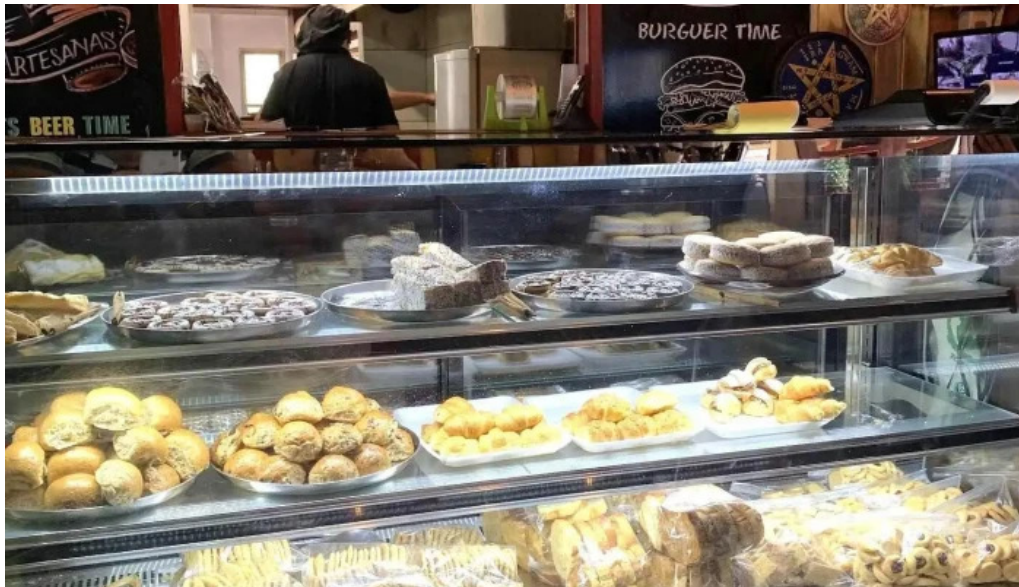
24 hs degustar del propietario