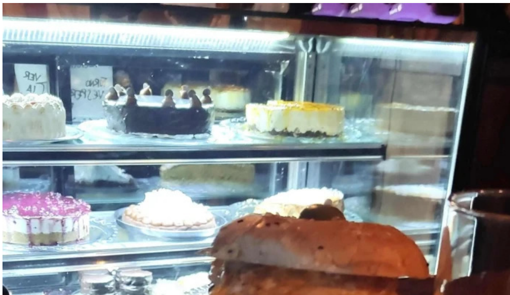
24 hs degustar comentario 6