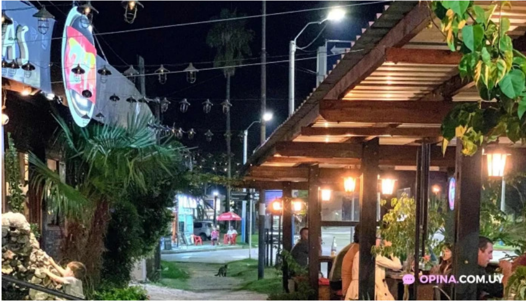
24 hs degustar todo