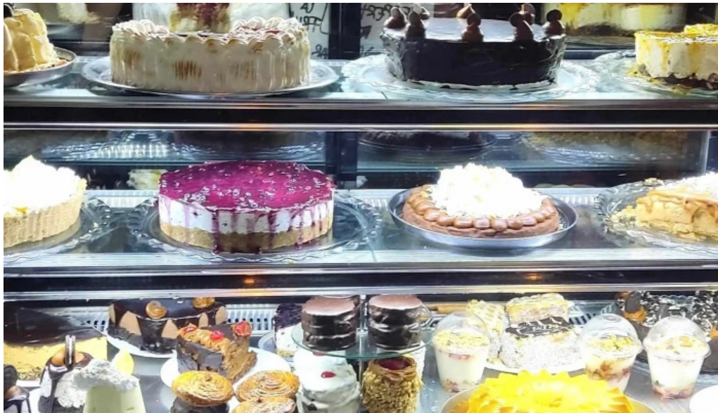
24 hs degustar comentario 8