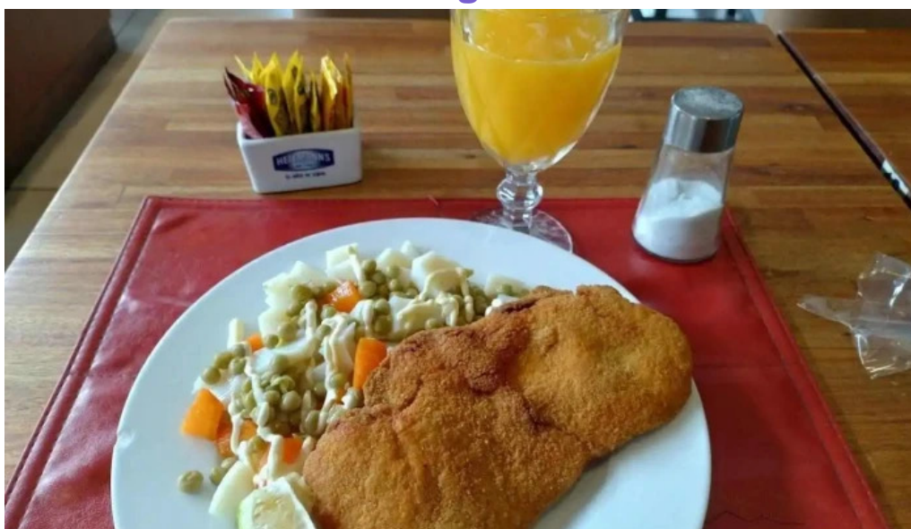
1000 grados montevideo