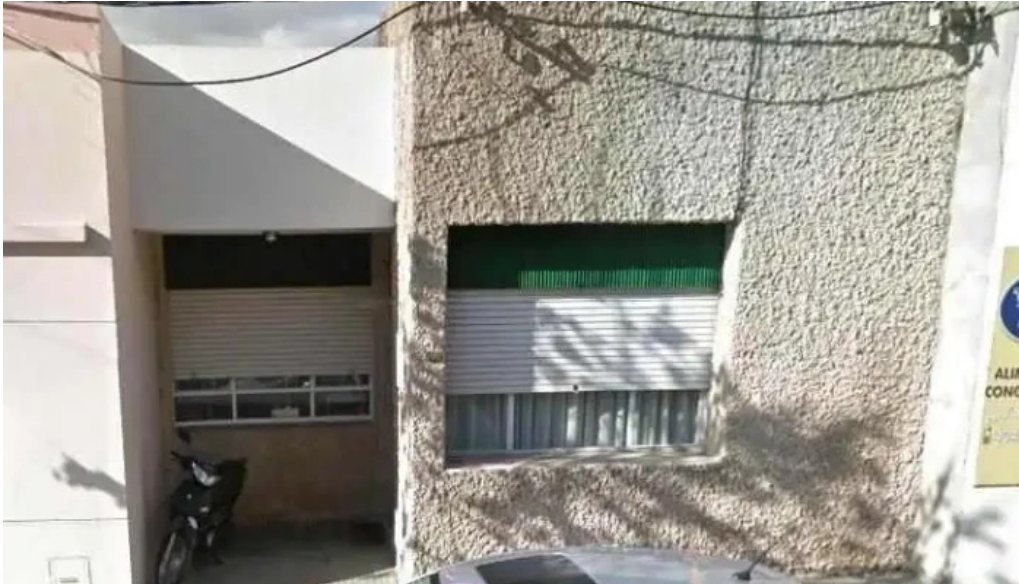
Restaurante halconero del propietario