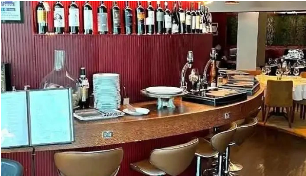
Restaurante halconero san jose de mayo