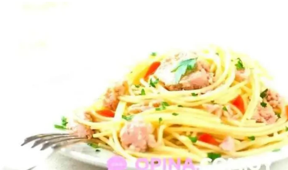
Restaurante halconero comida y bebida