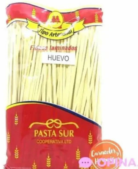
Restaurante halconero fideo