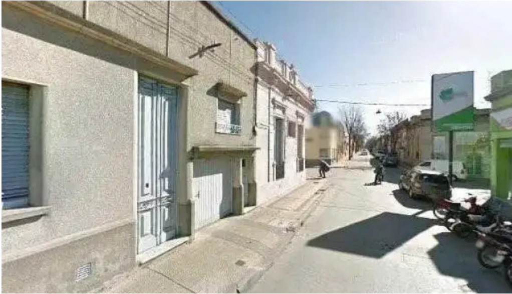
Restaurante halconero street view y 360