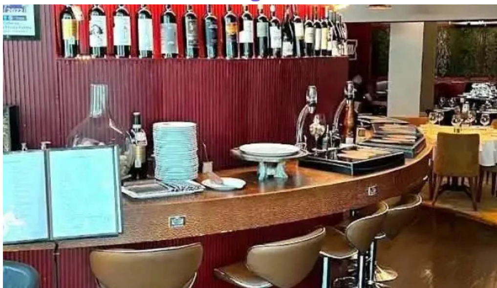
Restaurante halconero todas