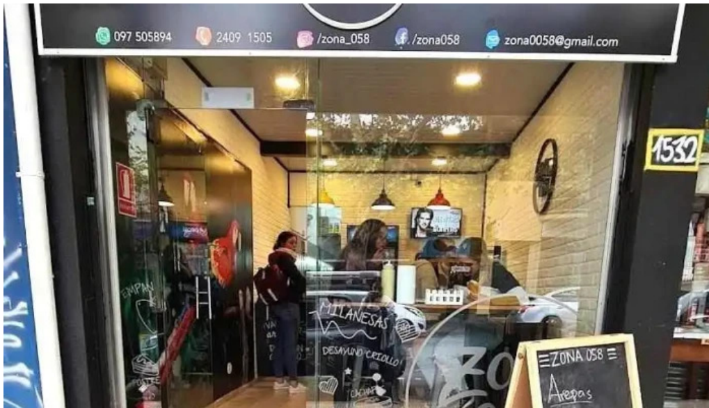
Zona 058 montevideo