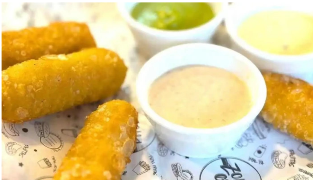
Zona 058 del propietario