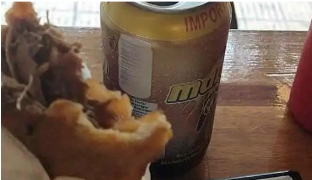
Zona 058 videos