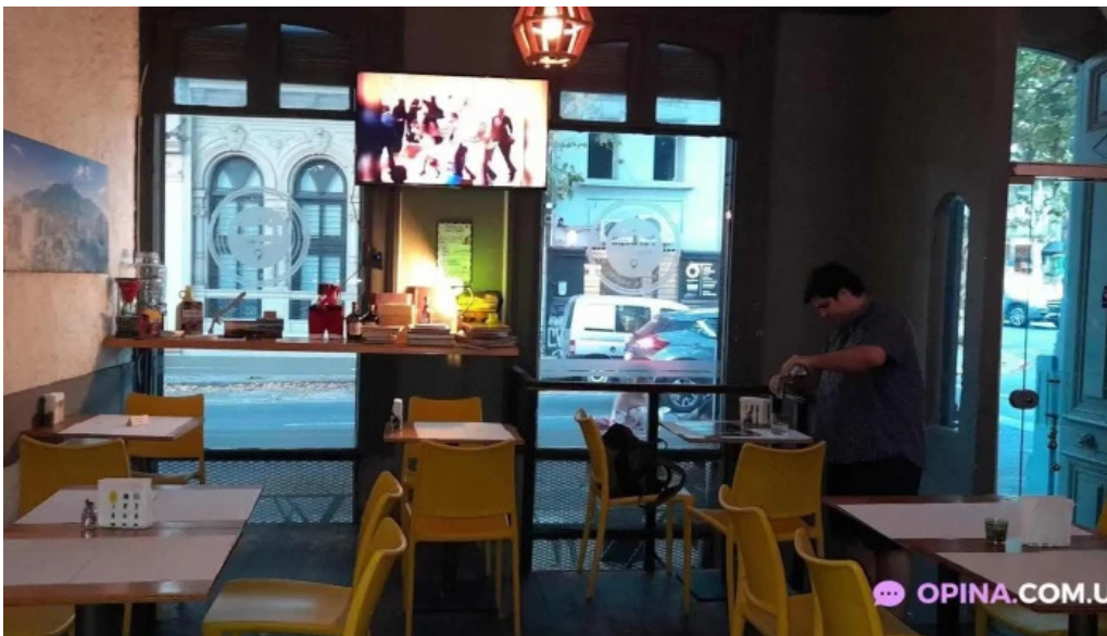
Poi depu restaurante y roneria ambiente