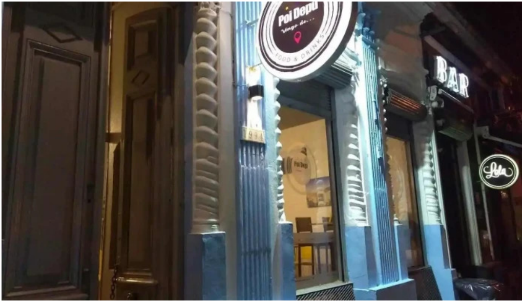
Poi depu restaurante y roneria montevideo