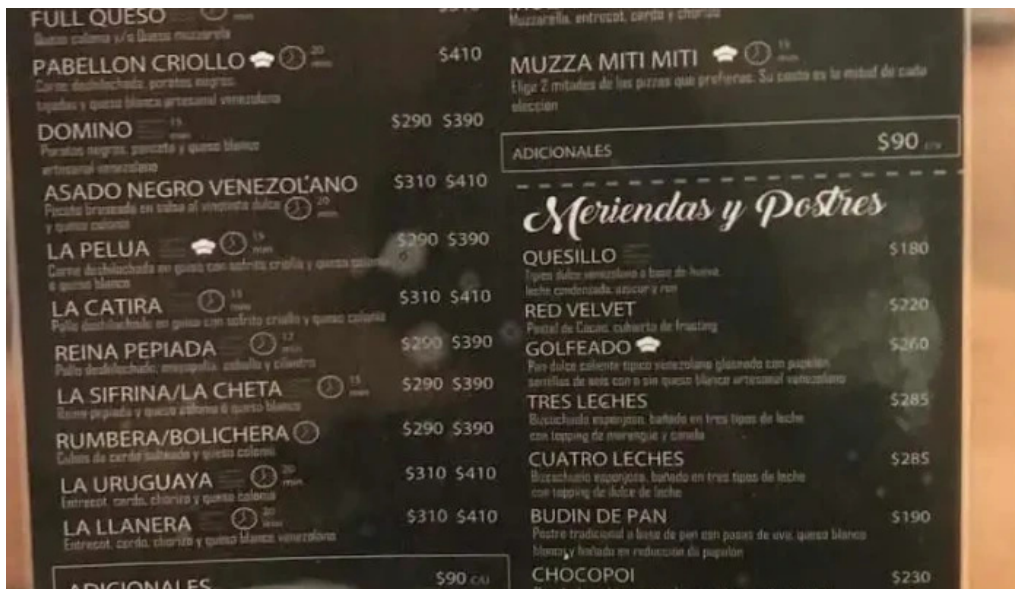
Poi depu restaurante y roneria menu