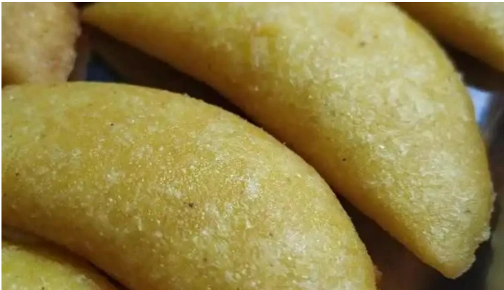
Poi depu restaurante y roneria comida y bebida