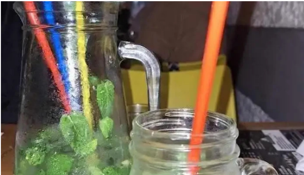
Poi depu restaurante y roneria mojito