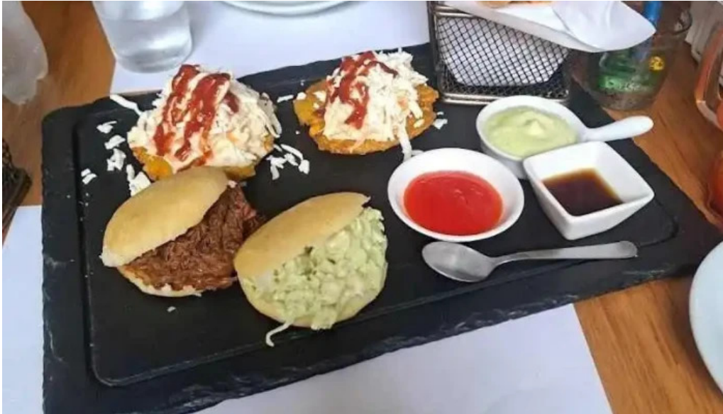
Poi depu restaurante y roneria empanada