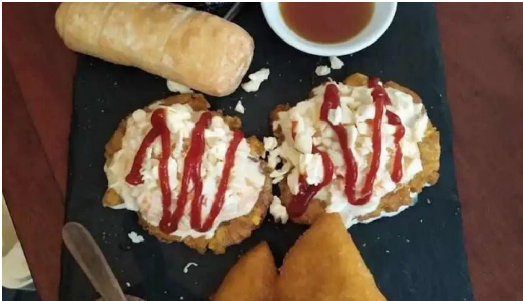
Poi depu restaurante y roneria del propietario