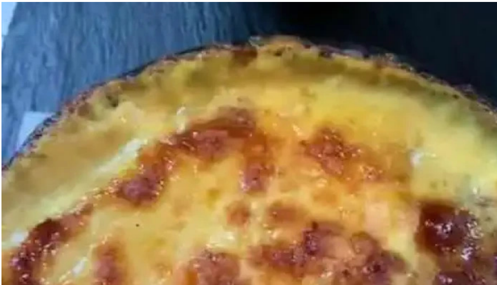
Poi depu restaurante y roneria videos