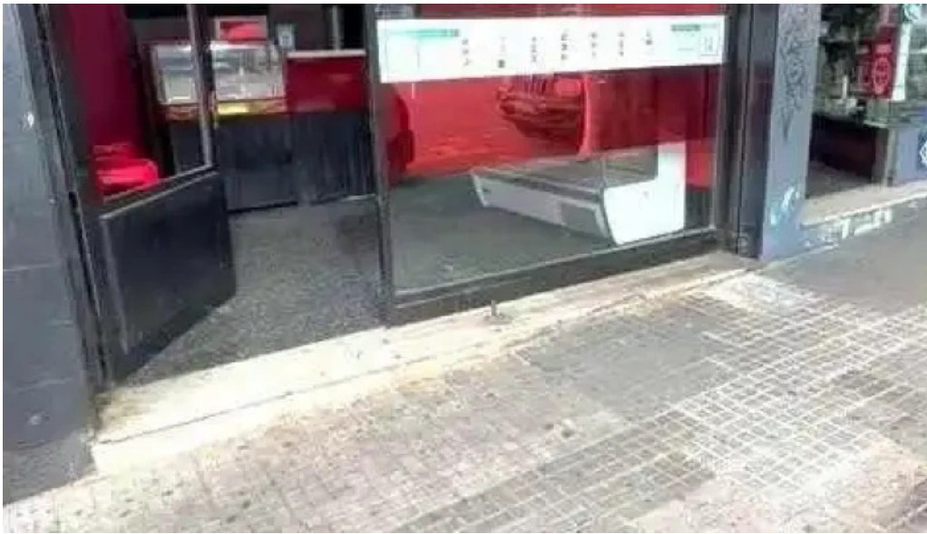
Pasapalo venezuela todas