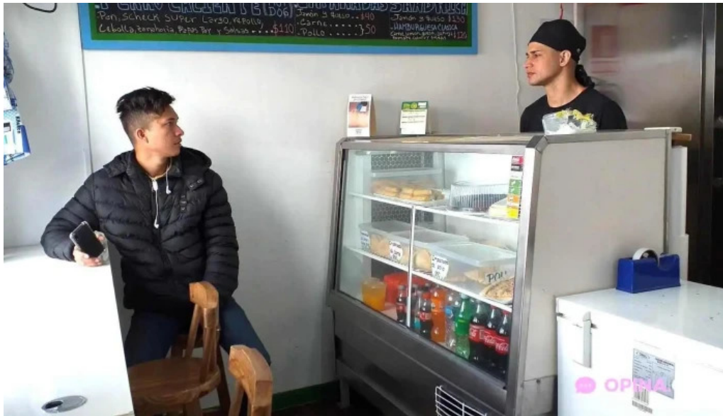
Pasapalo venezuela ambiente