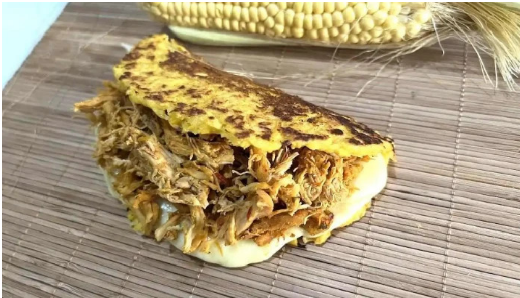
Pasapalo venezuela comida y bebida