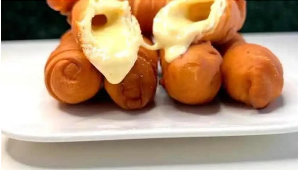
Pasapalo venezuela del propietario