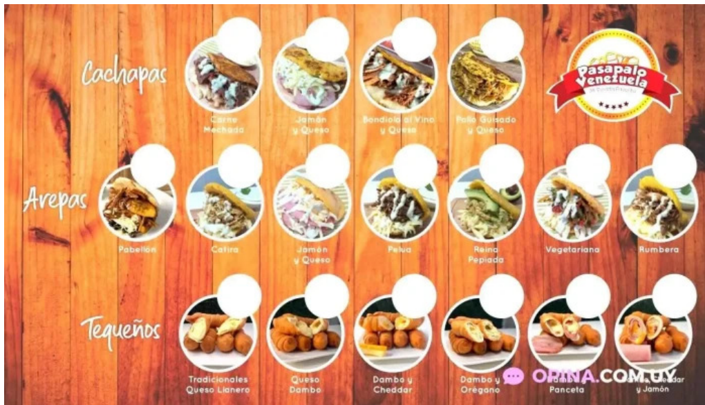
Pasapalo venezuela menu