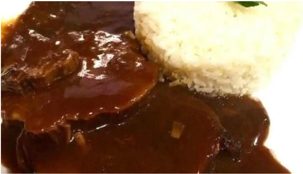
Parchita comida y bebida